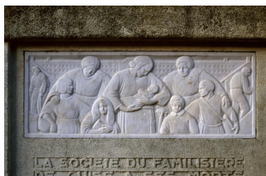
Vue du relief orant la partie supérieure gauche du monument : la Famille.