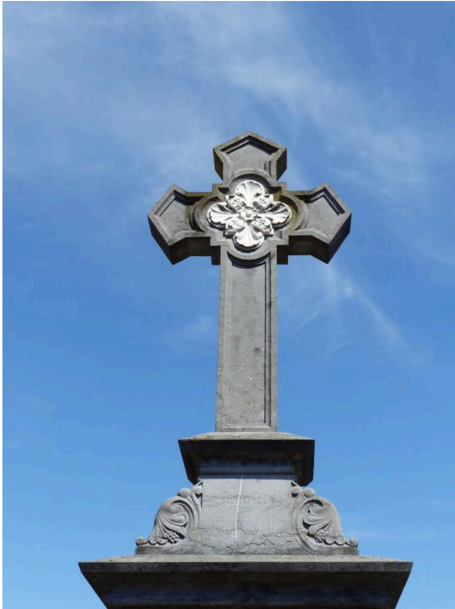
Vue de détail sur la partie supérieure du monument.