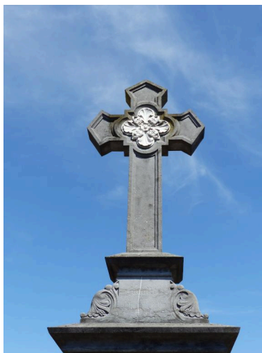
Vue de détail sur la partie supérieure du monument. IVR32_20208005122NUCA