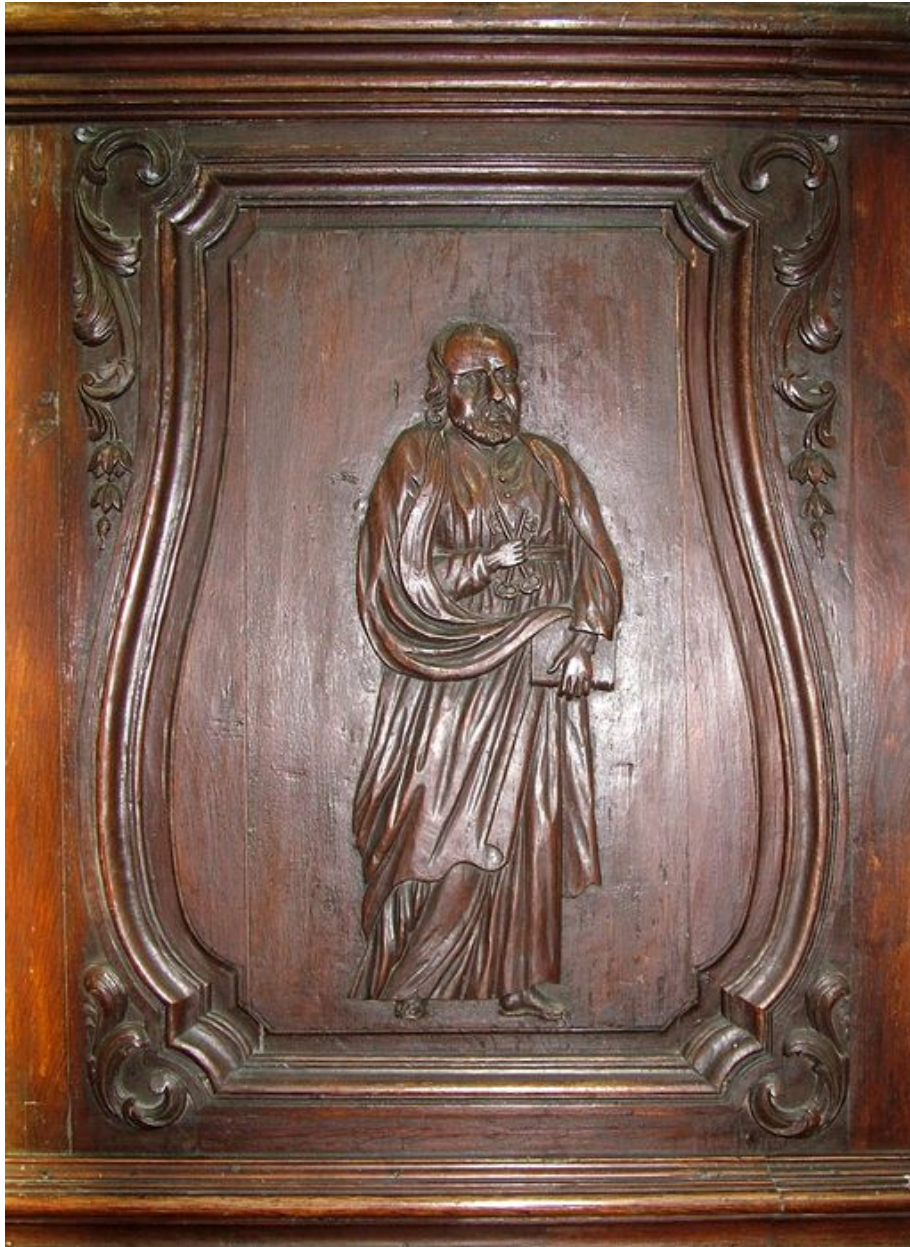
Panneau latéral de la cuve : Saint Pierre.