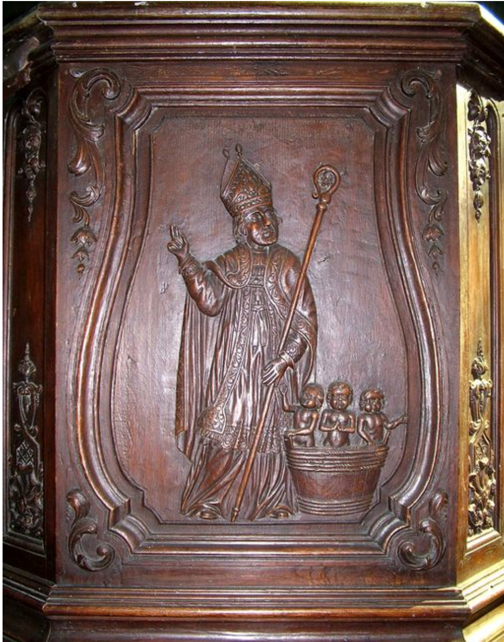
Panneau frontal de la cuve : Saint Nicolas.