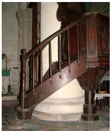
Escalier latéral.