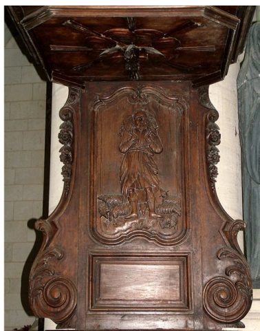
Dosseret : Saint Jean-Baptiste.