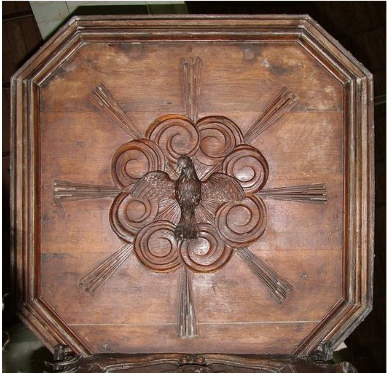
Abat-son : Colombe du Saint-Esprit.