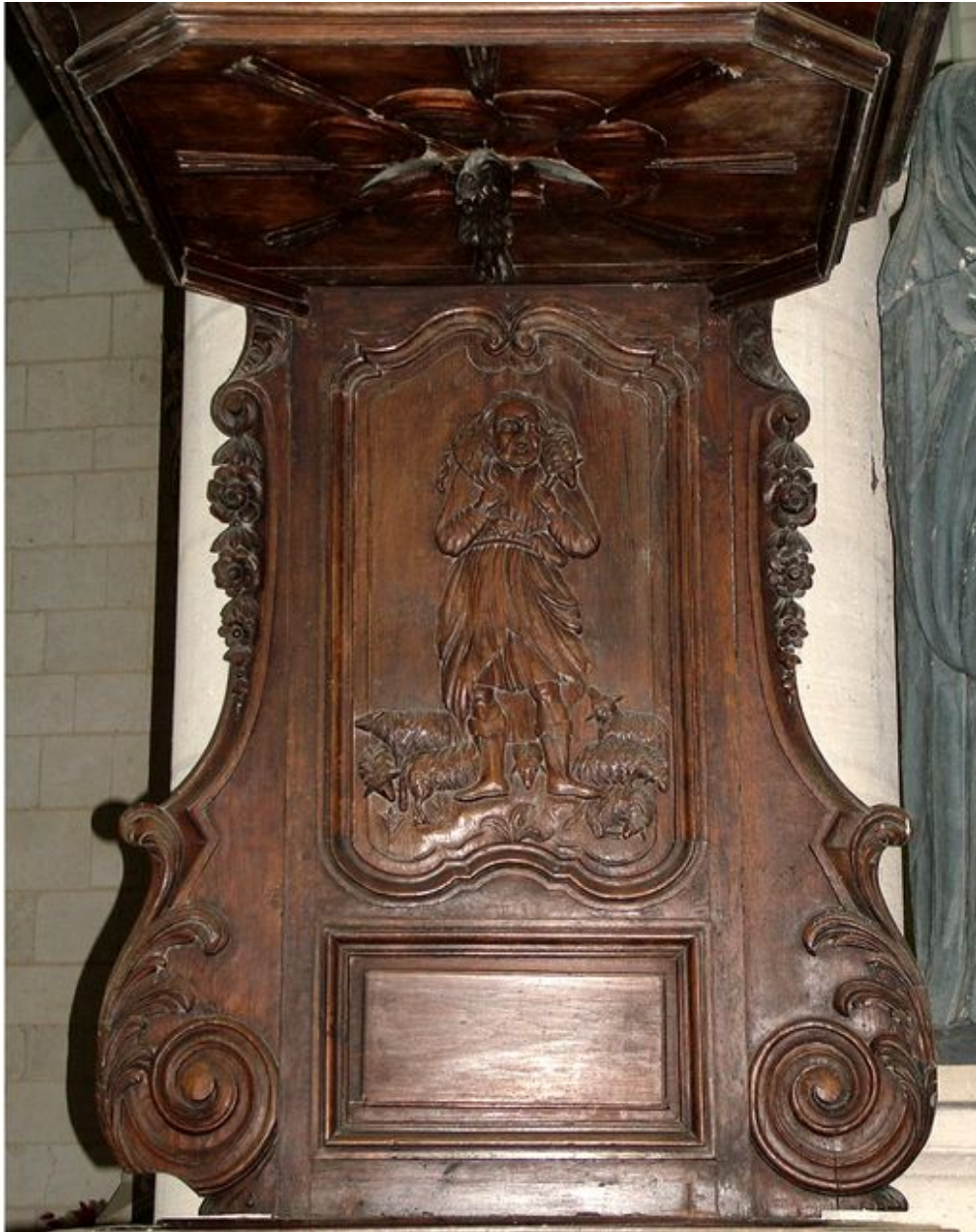
Dosseret : Saint Jean-Baptiste.