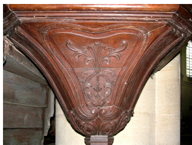
Culot de la cuve.