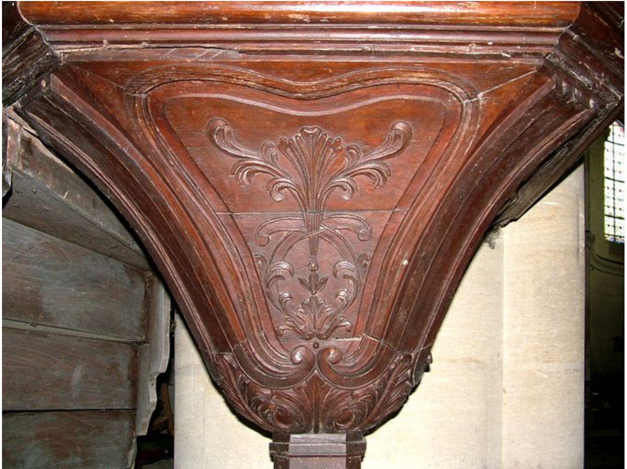
Culot de la cuve.