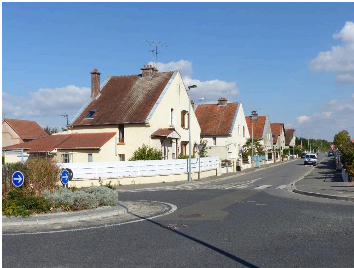
Les maisons subsistant, rue Lucette-Bonnard.