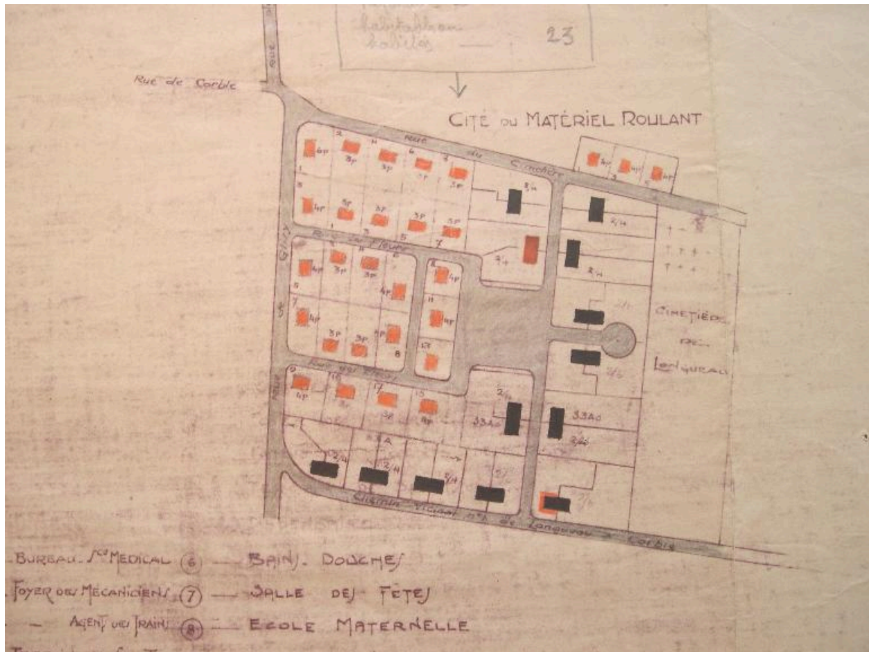
Plan de la cité, vers 1947 (AD Somme ; 15J 98). En noir, les maisons existantes, en orange les maisons à construire, de type VB.