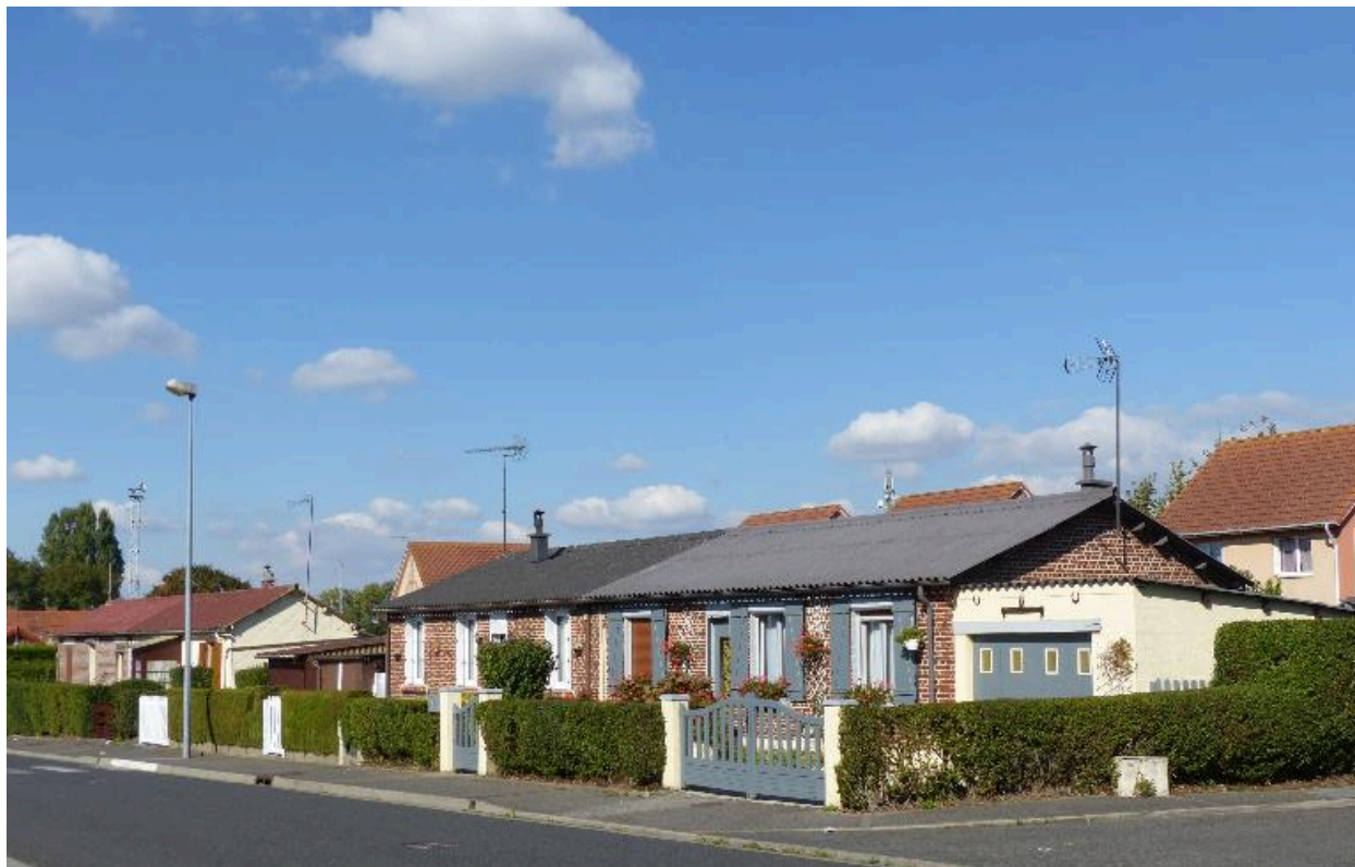
Les maisons reconstruites au milieu du 20e siècle, rue Paul-Baroux.