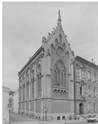
La chapelle reconstruite en 1895, vue depuis le sud-est. IVR22_19968000305V