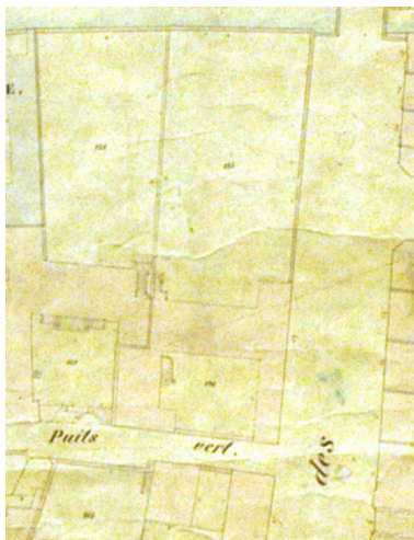
Extrait du cadastre de 1851 (DGI). IVR22_20038010974NUCA