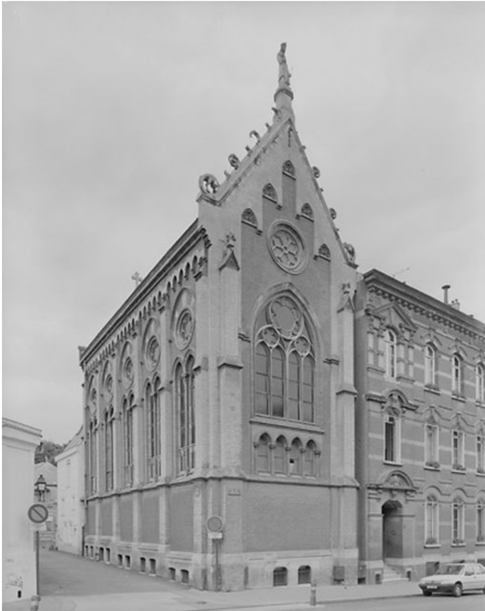
La chapelle reconstruite en 1895, vue depuis le sud-est.