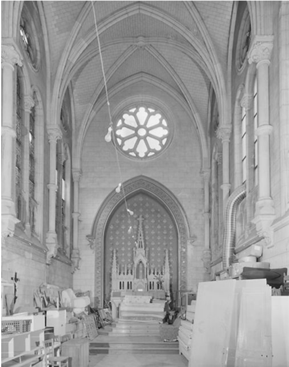
Vue intérieure de la chapelle vers le chœur.