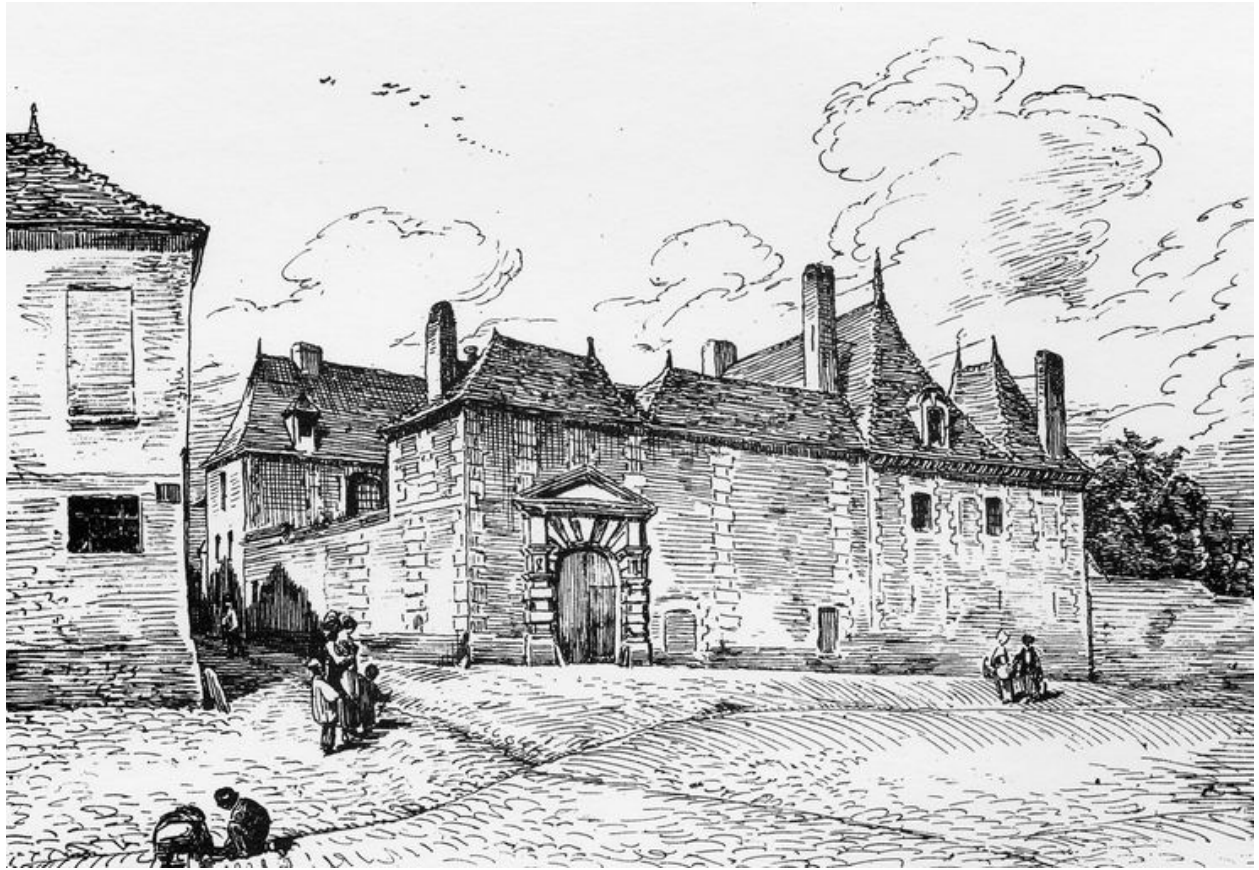
L'hôtel de l'Intendance, dessin par Louis Duthoit (Le Vieil Amiens, 1874).