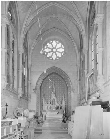
Vue intérieure de la chapelle vers le chœur. IVR22_19968000307V