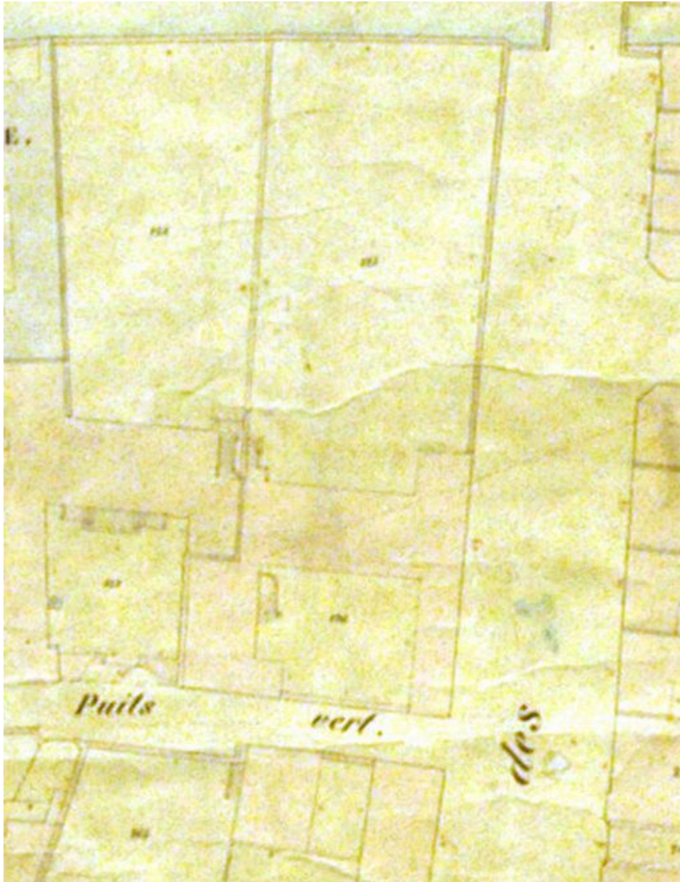
Extrait du cadastre de 1851 (DGI).