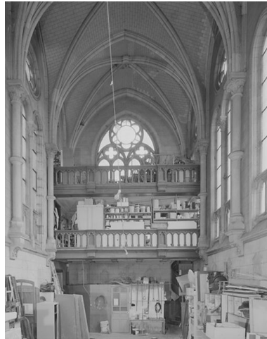
Vue intérieure de la chapelle vers l'est.