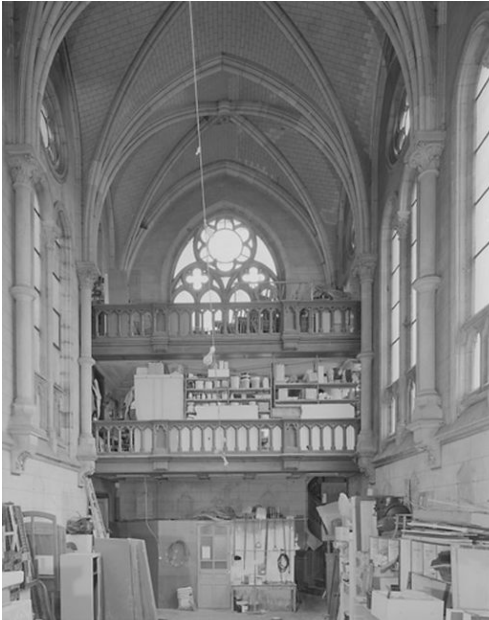
Vue intérieure de la chapelle vers l'est.