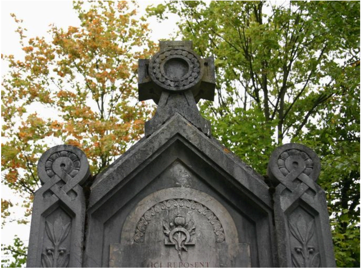
Détail du fronton de la stèle.