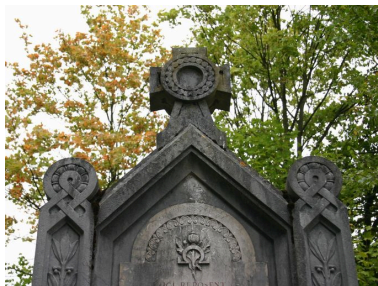
Détail du fronton de la stèle. IVR22_20098001317NUCA