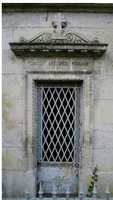
Détail du décor sculpté et de la porte en fonte ouvragée (N49) IVR22_20088000310NUCA