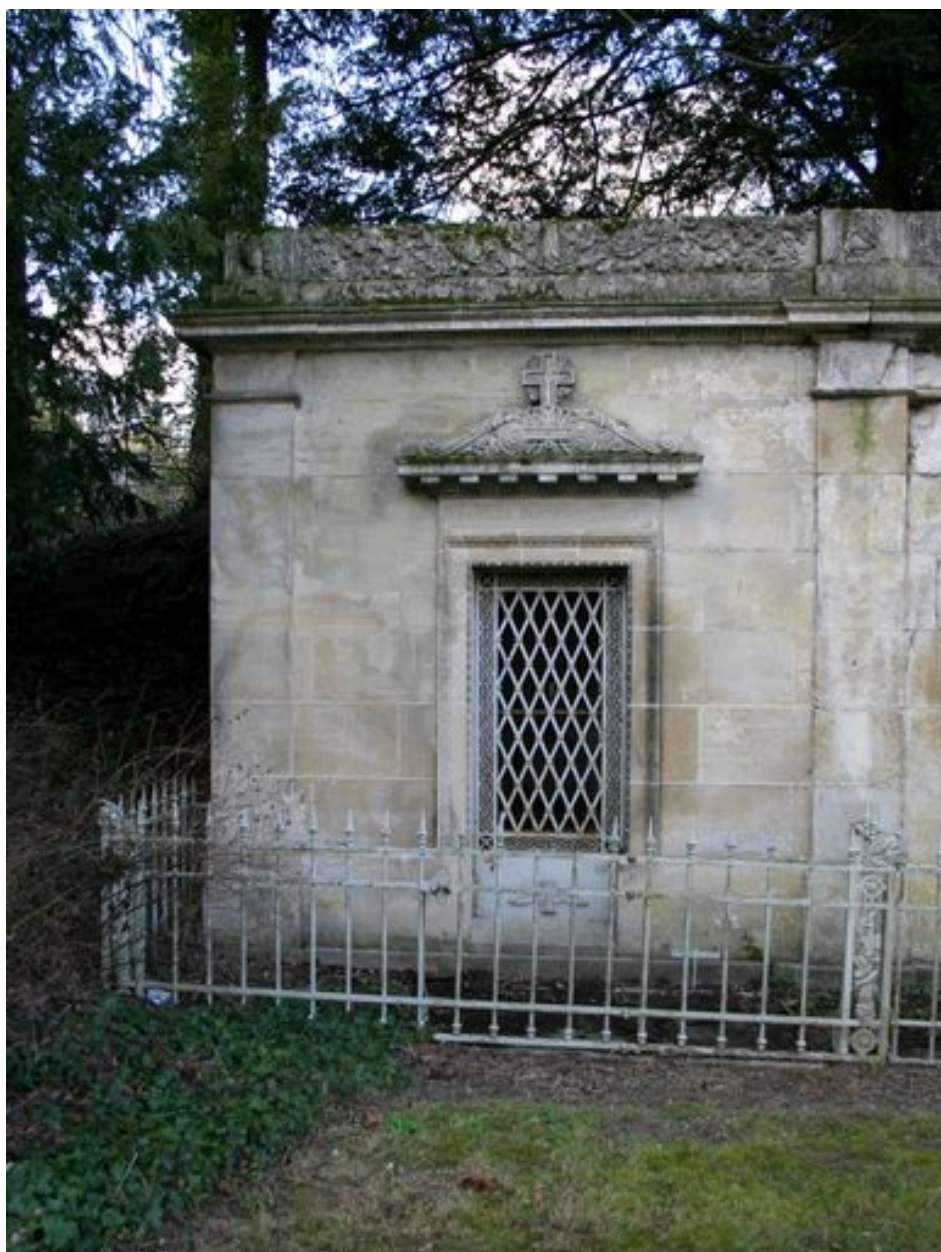
Vue du tombeau Dubois-Quillet (N51).