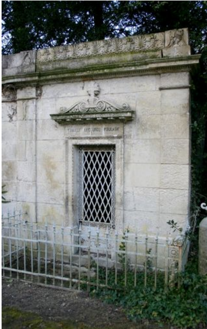
Vue du tombeau Leclercq-Poulain (N49).