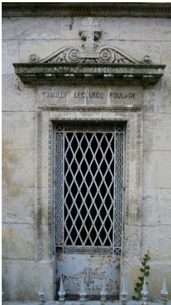
Détail du décor sculpté et de la porte en fonte ouvragée (N49)