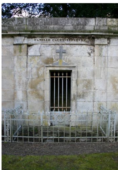
Vue du tombeau Cauët-Lefebvre (N50). IVR22_20088000311NUCA