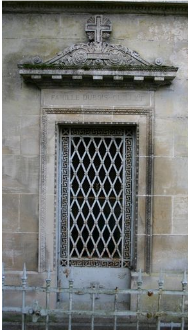
Détail du décor sculpté et de la porte en fonte ouvragée (N51).