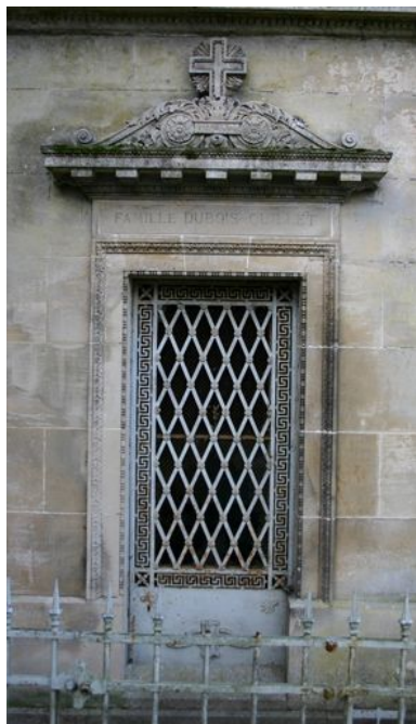
Détail du décor sculpté et de la porte en fonte ouvragée (N51).