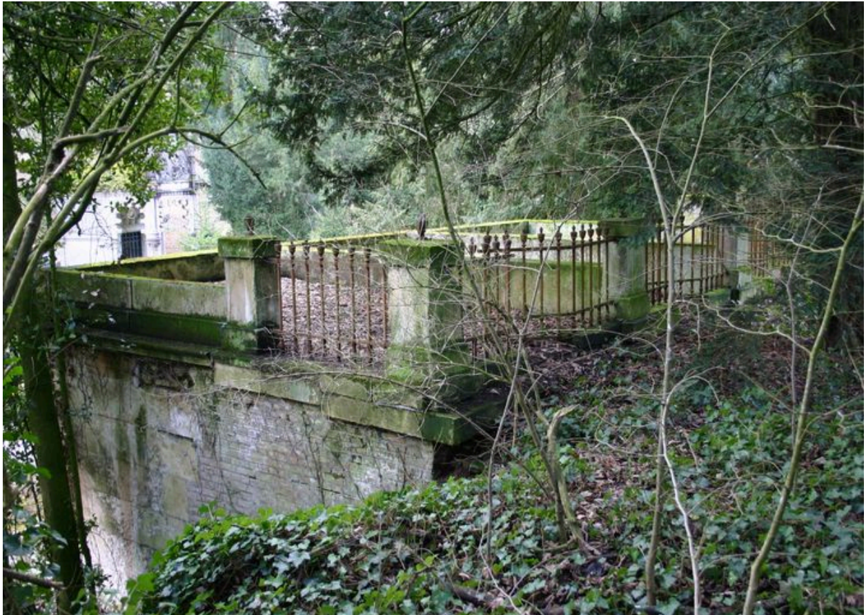
Vue du toit-terrasse.