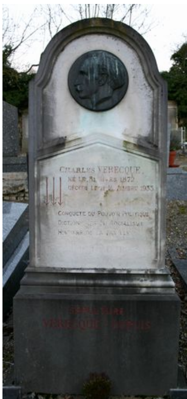
Stèle en forme de chapeau de gendarme. IVR22_20088000204NUCA