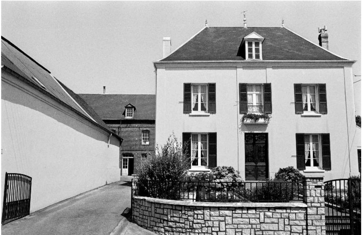
Façade antérieure, en 1990.