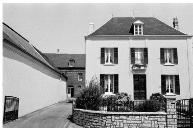
Façade antérieure, en 1990. IVR22_19908000409Z