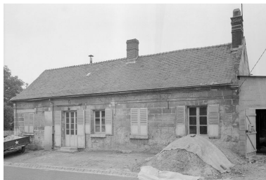
Elévation antérieure. IVR22_19846001003X

Plan de situation. Extrait du plan cadastral de 1982, section B2 286. IVR22_20096000021NUCA