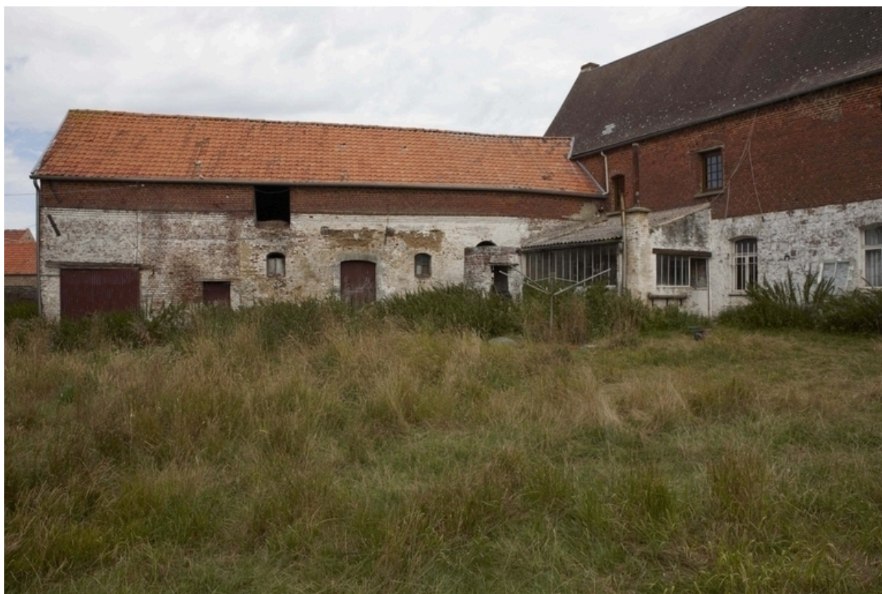
Vue de l'élévation sur cour des étables-fenil situées au nord-ouest.