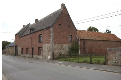
Vue générale de l'élévation sur rue depuis le nord-ouest. IVR31_20095902676NUCA