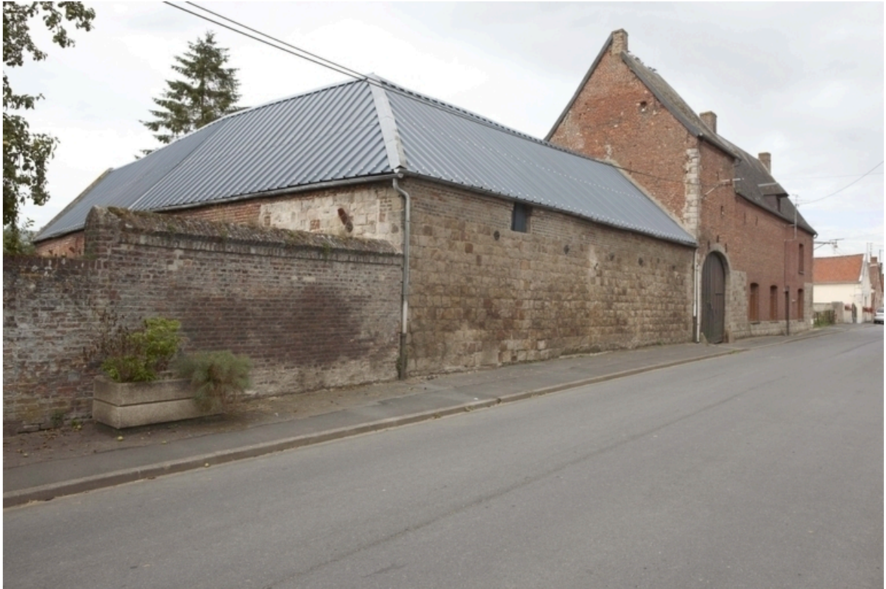
Vue générale de l'élévation sur rue depuis le sud-est.