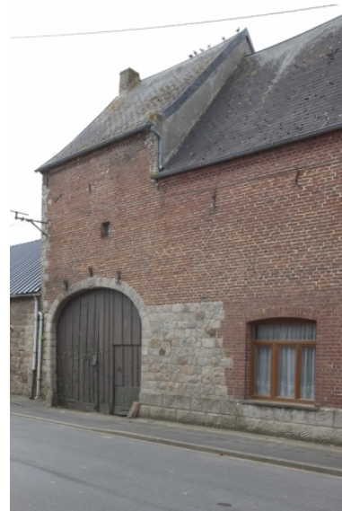
Vue du pigeonier-porche, depuis la Grand'Rue. IVR31_20095902675NUCA