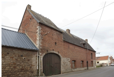
Vue du pigeonier-porche et du logis.