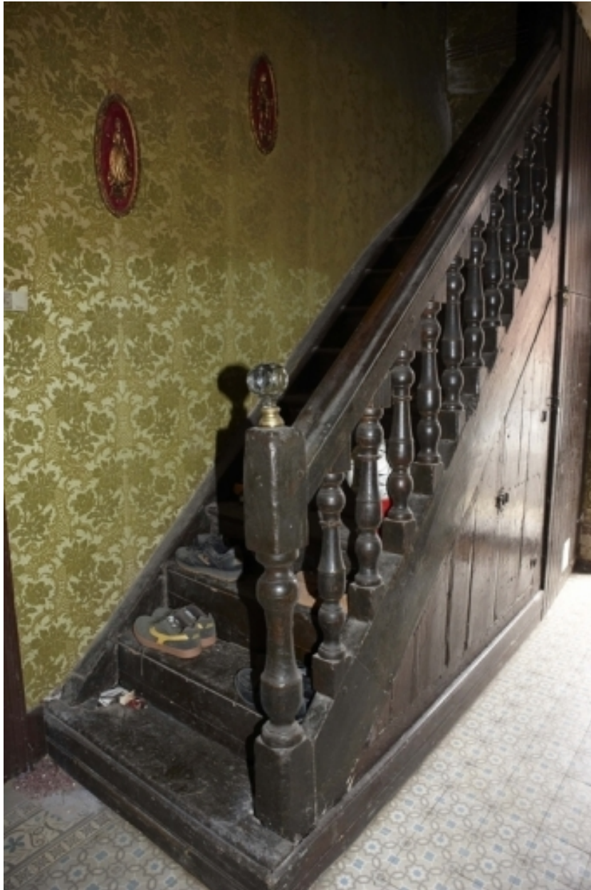
Détail du départ de l'escalier du logis.