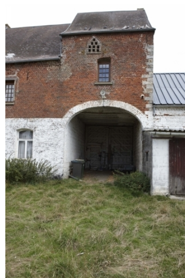
Détail du pigeonier- porche depuis la cour.