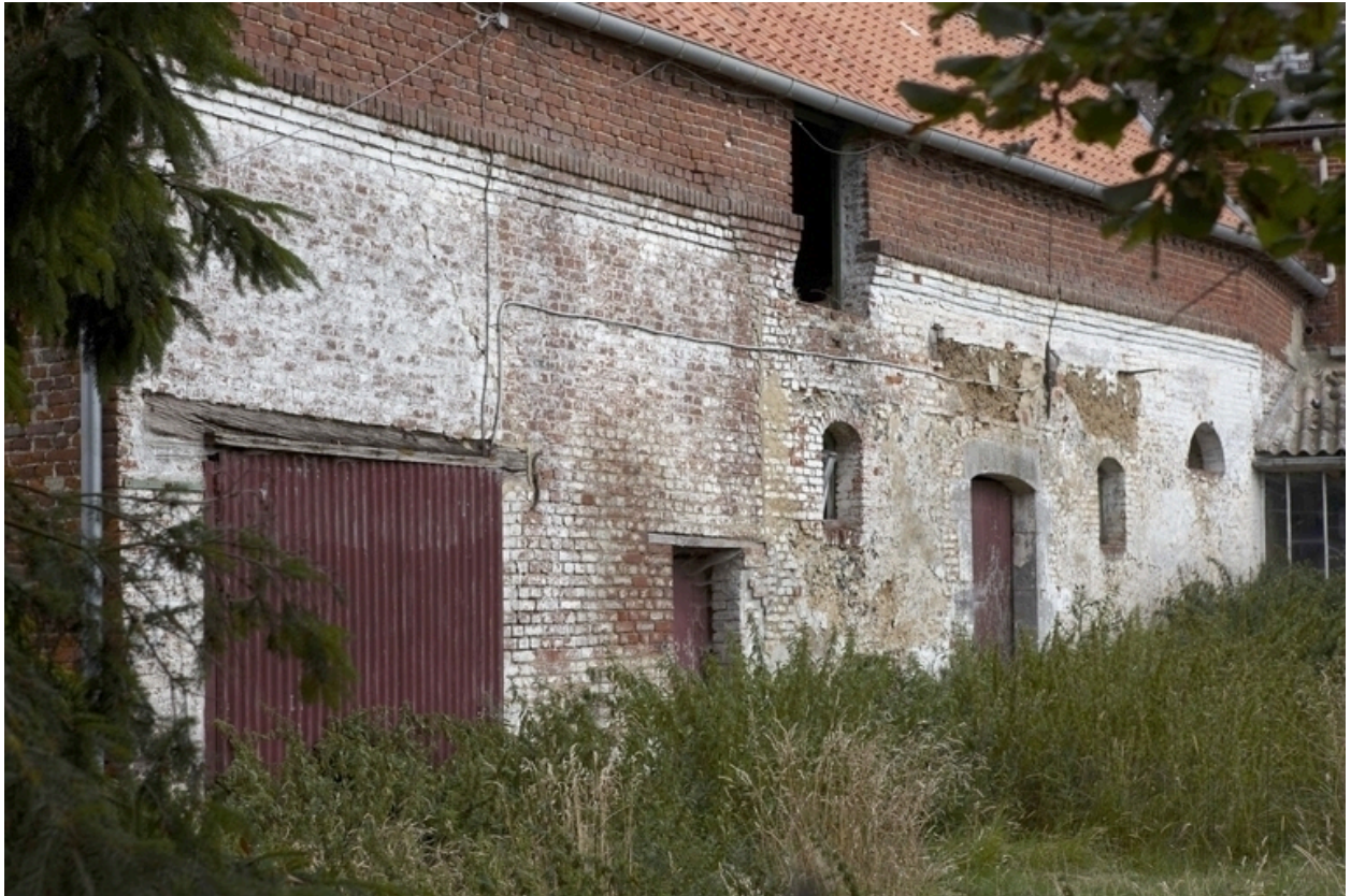
Détail des étables-fenil situées au nord-ouest : deux campagnes de construction sont visibles.