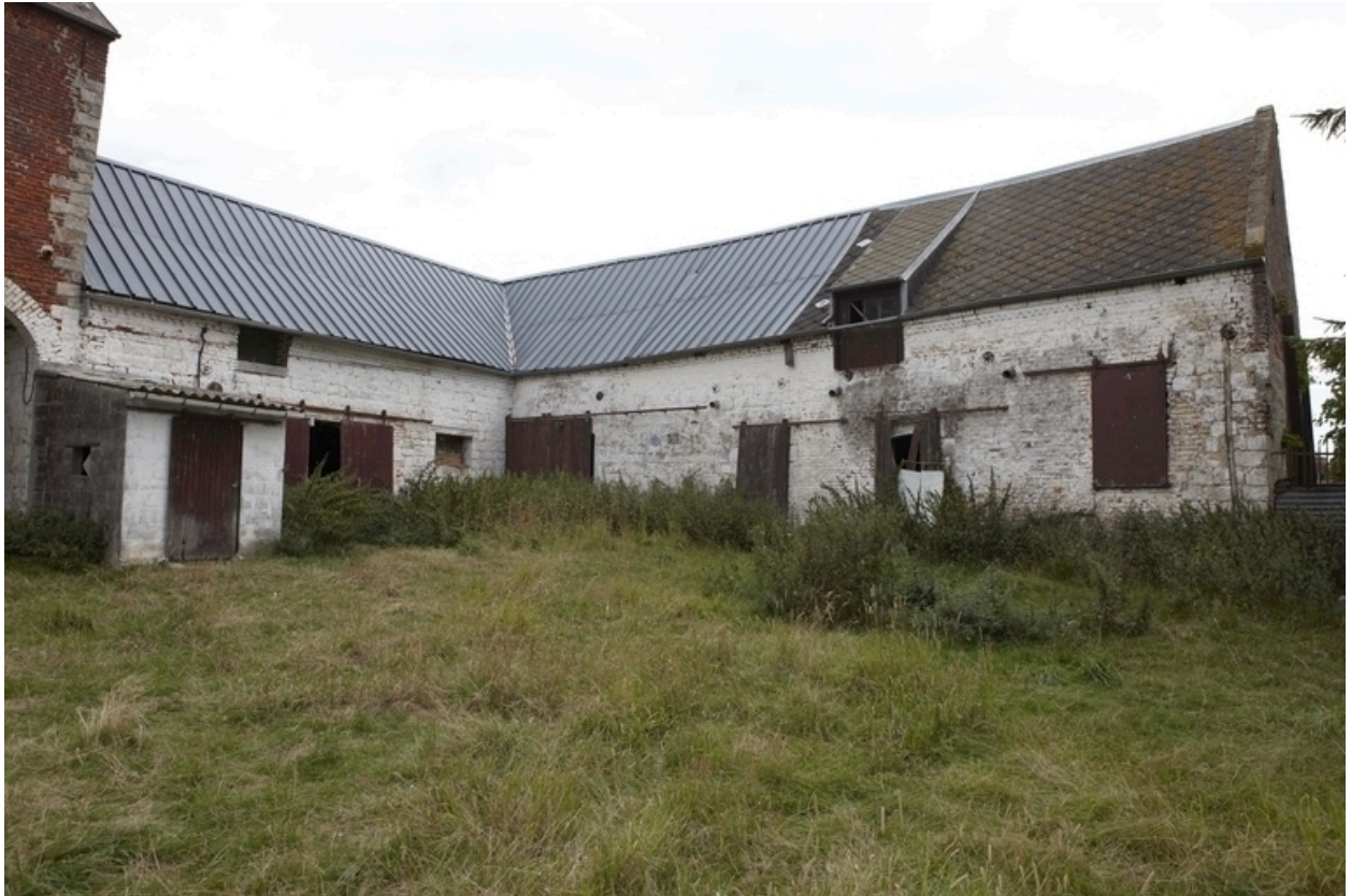
Vue, depuis la cour, du revers des étables situées au sud-est.