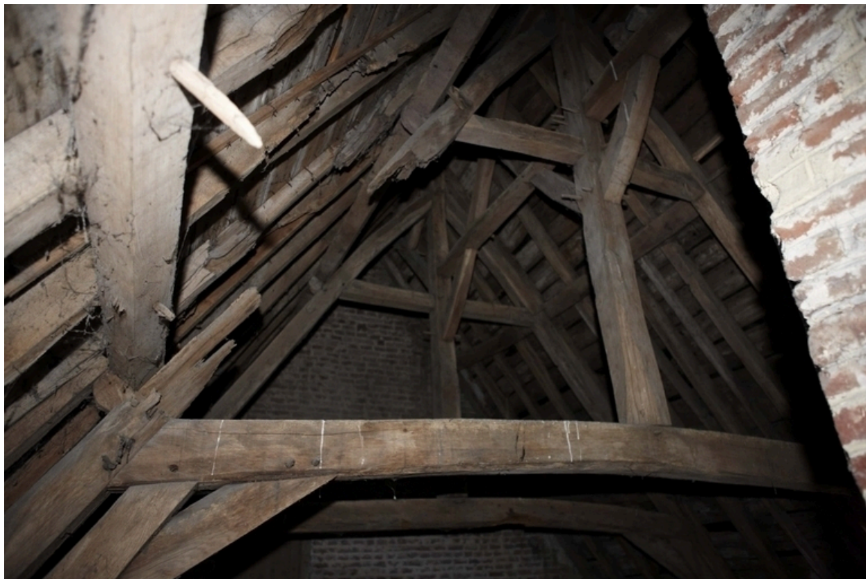
Détail de la charpente du logis.