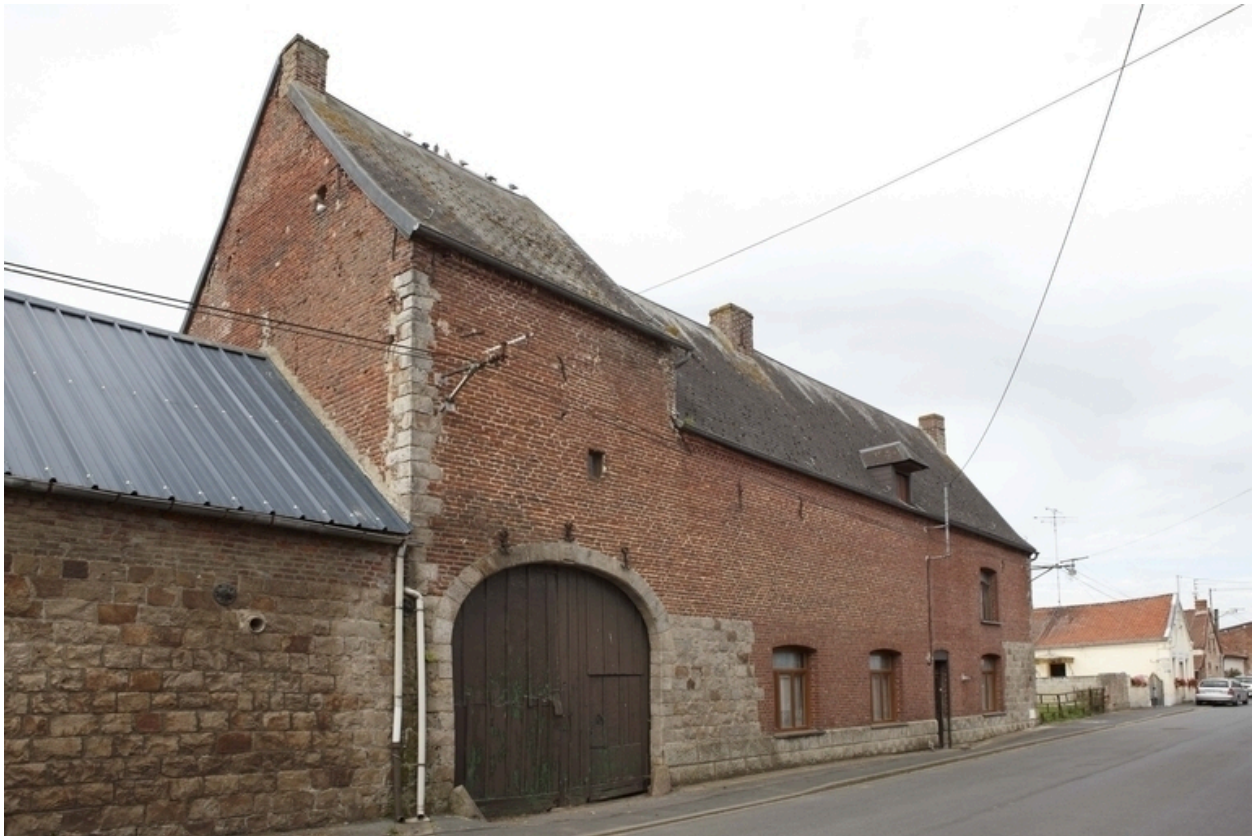
Vue du pigeonnier-porche et du logis.