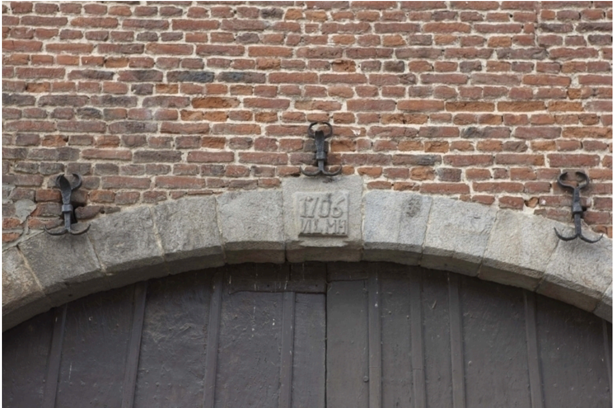
Détail de la date portée à l'entrée du porche.