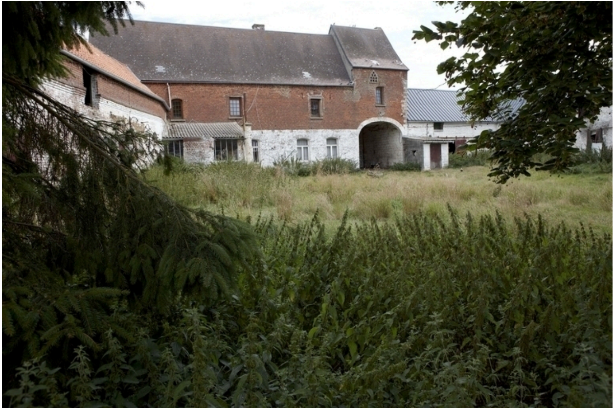
Vue de la ferme depuis la cour.