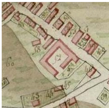
Extrait de la feuille cadastrale A et B. Plan de situation en 1804.