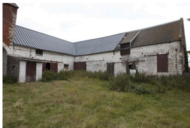
Vue, depuis la cour, du revers des étables situées au sud-est.