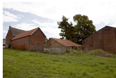
Vue du pignon du hangar, d'une remise, du revers des étables-fenil et du pignon nord-ouest du logis. IVR31_20095902677NUCA

Détail des étables-fenil situées au nord-ouest : deux campagnes de construction sont visibles. IVR31_20095902681NUCA