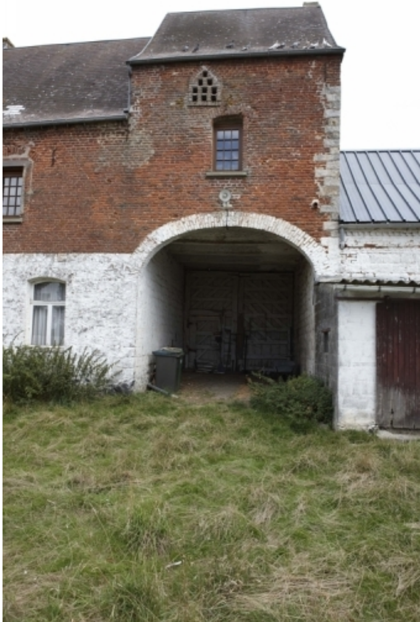
Détail du pigeonnier-porche depuis la cour.