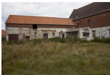
Vue de l'élévation sur cour des étables-fenil situées au nord-ouest.