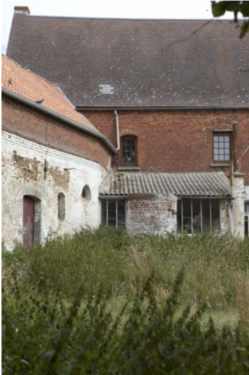
Détail du logis et des étables-fenil depuis la cour.