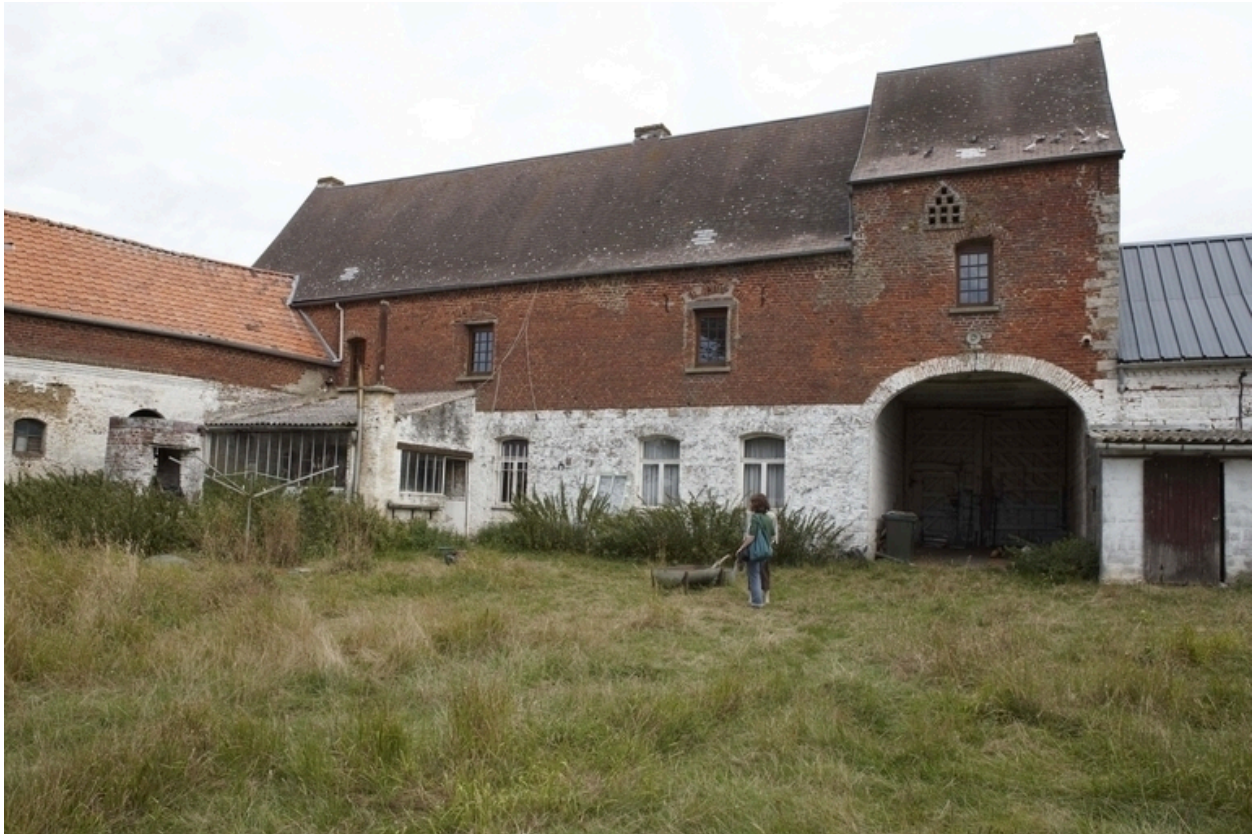
Vue de l'élévation sur cour du logis et du pigeonnier-porche.