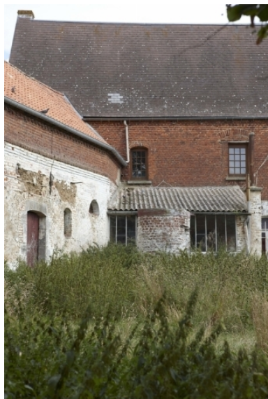
Détail du logis et des étables-fenil depuis la cour.