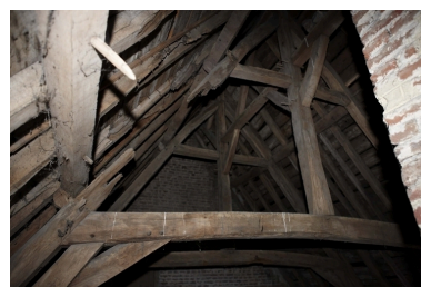
Détail de la charpente du logis. IVR31_20095902719NUCA