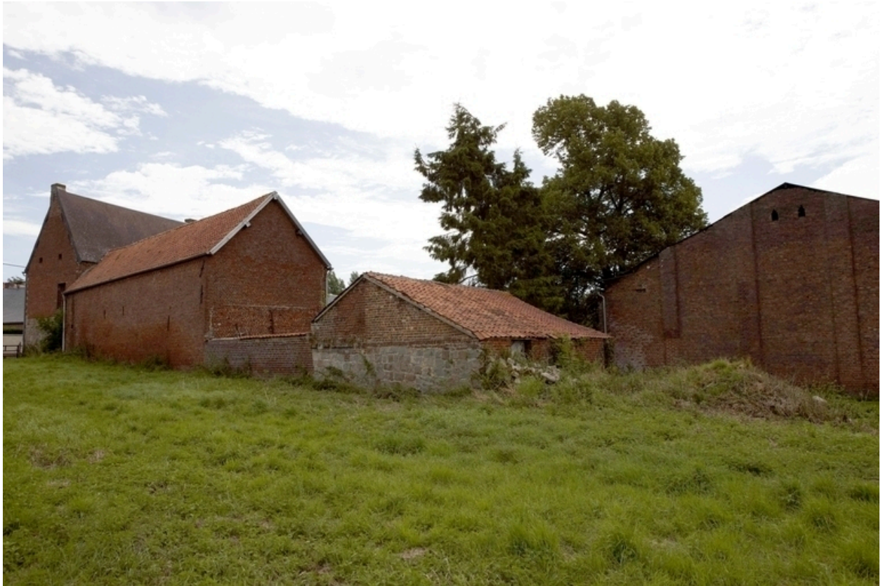
Vue du pignon du hangar, d'une remise, du revers des étables-fenil et du pignon nord-ouest du logis.