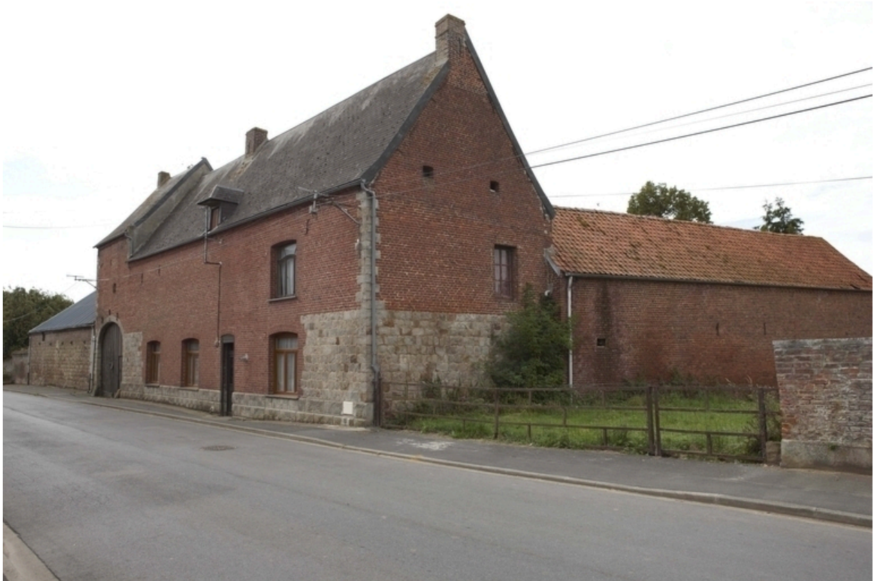
Vue générale de l'élévation sur rue depuis le nord-ouest.