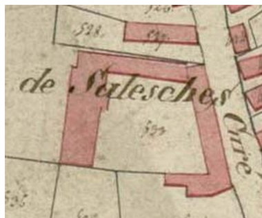
Extrait de la feuille cadastrale A. Plan de situation en 1831. IVR31_20095902593NUCA