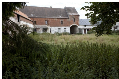
Vue de la ferme depuis la cour.