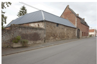
Vue générale de l'élévation sur rue depuis le sud-est. IVR31_20095902671NUCA