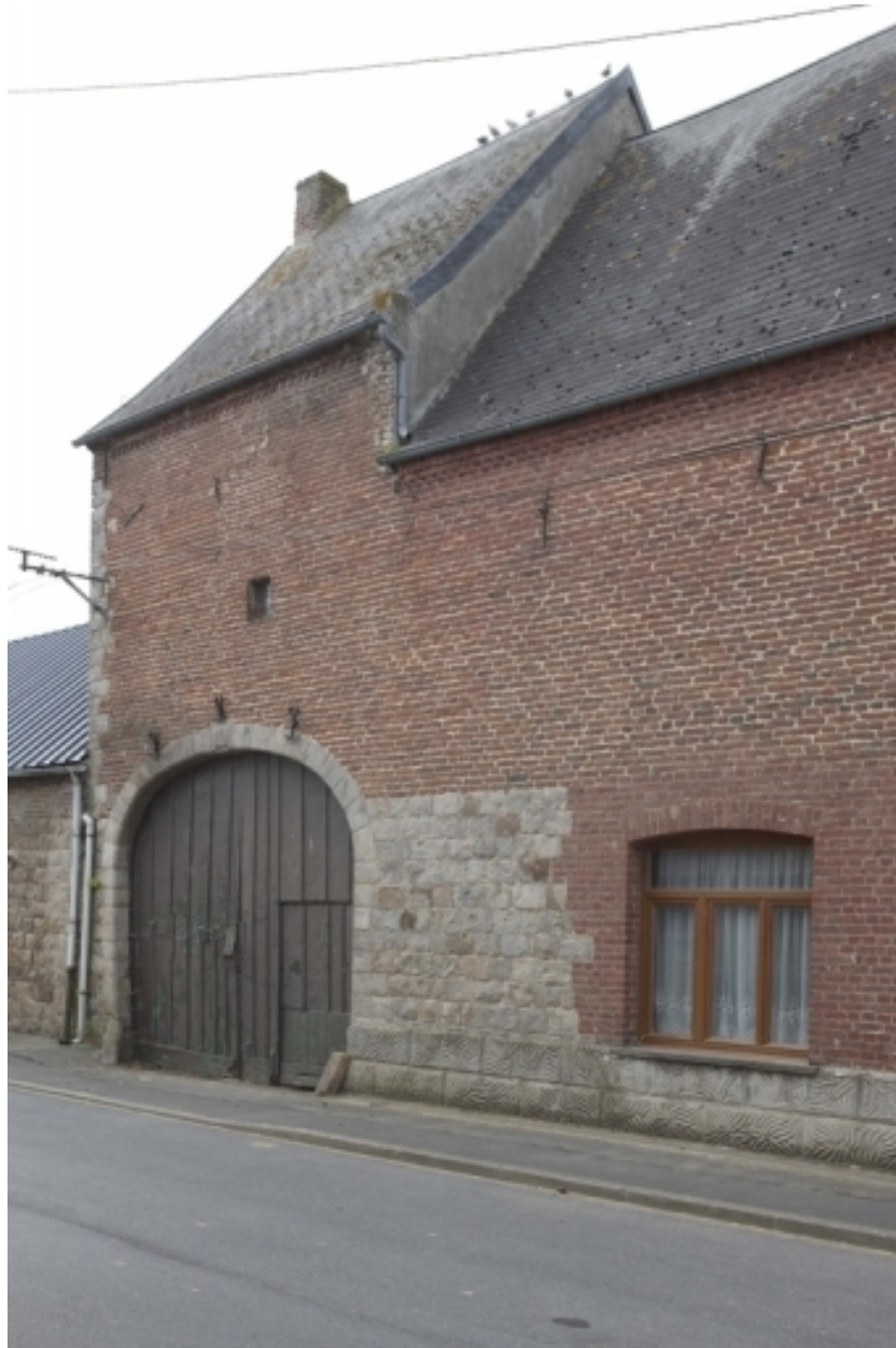
Vue du pigeonnier-porche, depuis la Grand'Rue.