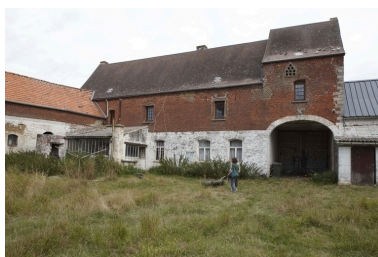
Vue de l'élévation sur cour du logis et du pigeonier-porche.