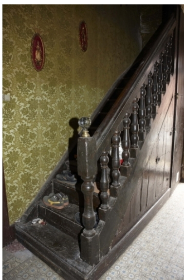
Détail du départ de l'escalier du logis.