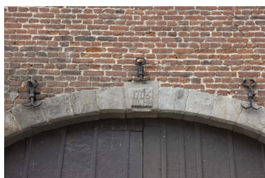
Détail de la date portée à l'entrée du porche.