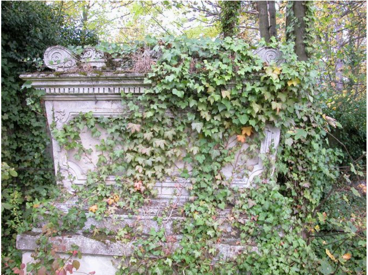
Vue de profil.