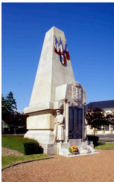
Vue depuis le sud-ouest, prise en 2011.