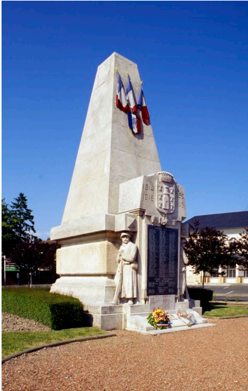
Vue depuis le sud-ouest, prise en 2011.