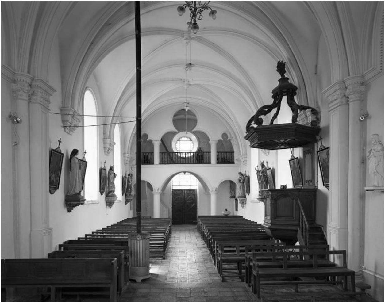
Vue intérieure depuis le chœur.