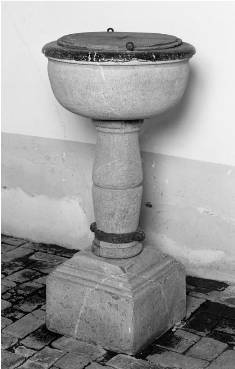
Les fonts baptismaux.