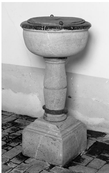
Les fonts baptismaux.