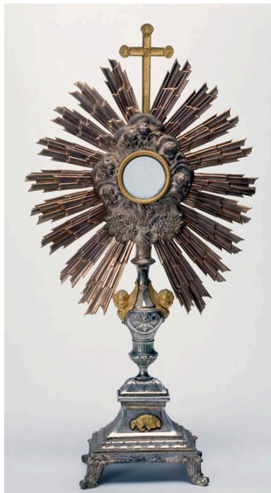
Ostensoir. IVR22_19930200795XA

Statue en terre cuite (grandeur nature) : Saint Raphaël. IVR22_19930200792XA