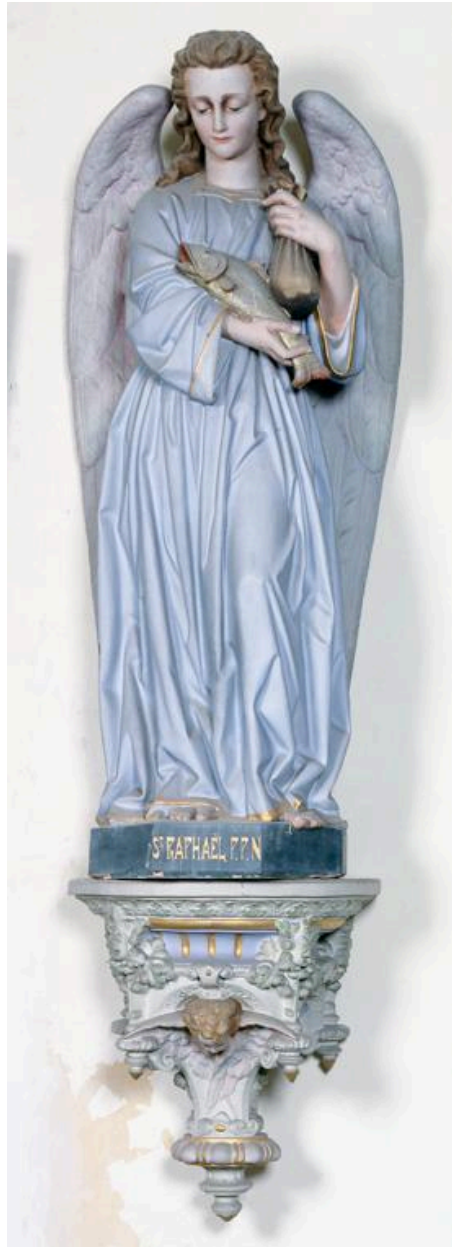
Statue en terre cuite (grandeur nature) : Saint Raphaël.