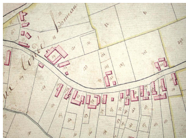
Plan de situation. Cadastre de 1818 (AD Nord. Série P31/169).

Phot. Sophie Luchier IVR31_20045906140NUCA