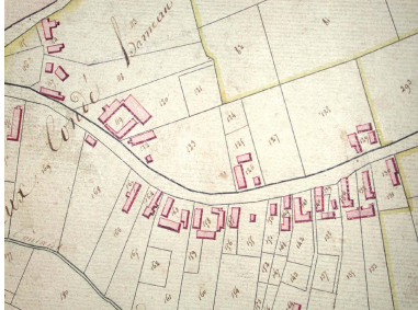
Plan de situation. Cadastre de 1818 (AD Nord. Série P31/169). IVR31_20045906140NUCA