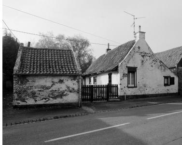
Vue générale. IVR31_20045900676X