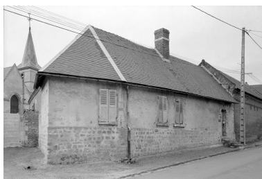
Vue générale depuis la rue. IVR22_19846000967X

Plan de situation. Extrait du plan cadastral de 1982, section A5 815. IVR22_20096000011NUCA