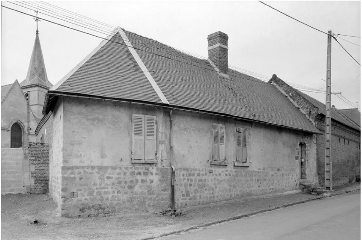
Vue générale depuis la rue.