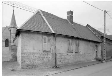
Vue générale depuis la rue. IVR22_19846000967X