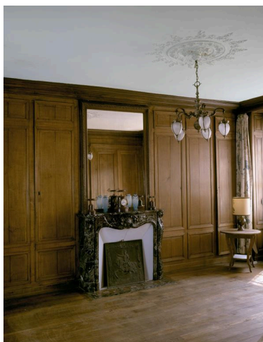
Vue de la salle à manger lambrissée.

Phot. Pierre-Yves Brest IVR22_19990207138Z