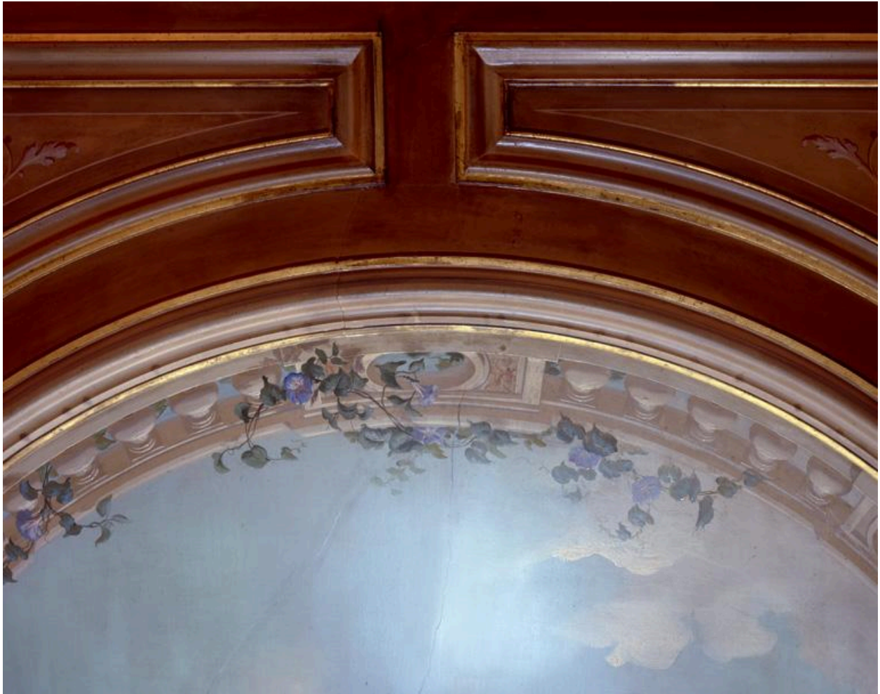
Détail du plafond peint du salon, représentant une balustrade envahie par des liserons ; l'ensemble se détachant sur fond de ciel.