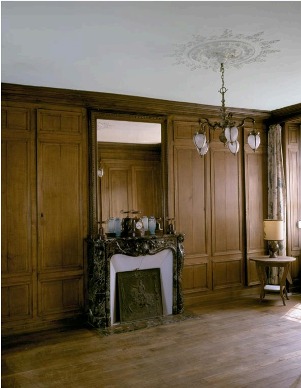
Vue de la salle à manger lambrissée.