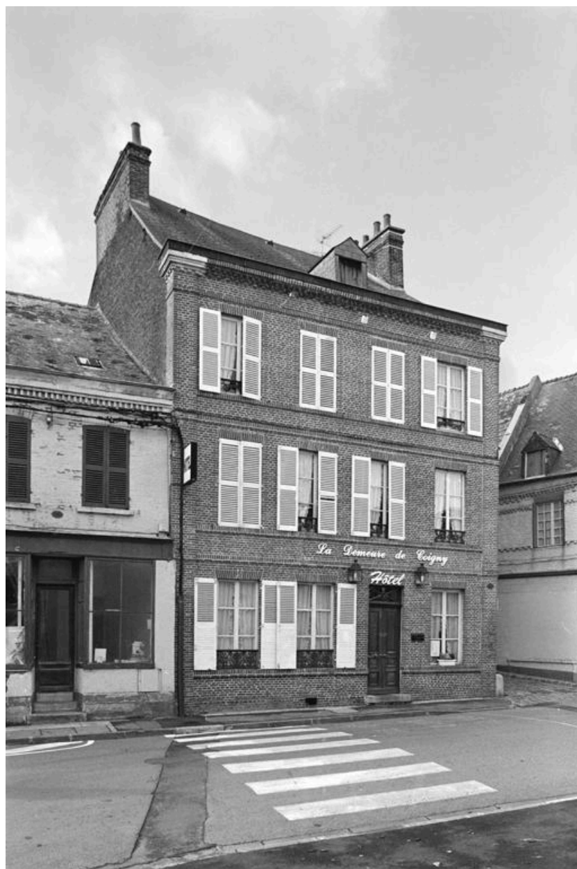
Vue de la façade principale, depuis la rue du Vieux Château.