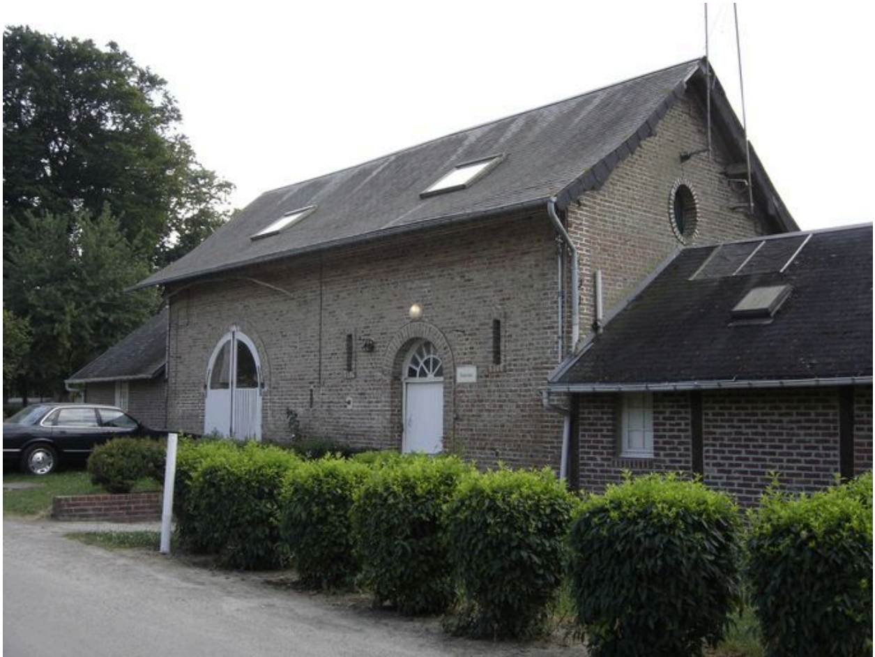
Vue de la grange.