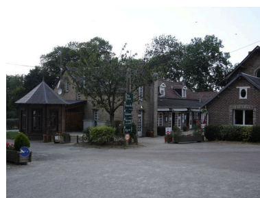
Vue générale des bâtiments agricoles .