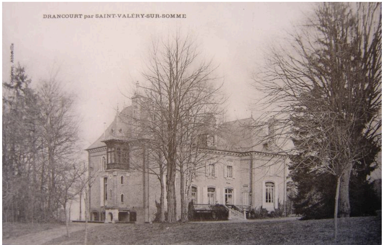
Vue postérieure de l'édifice au début du 20e siècle.