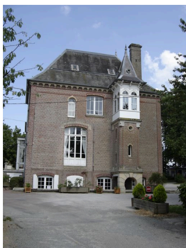
Vue latérale ouest.