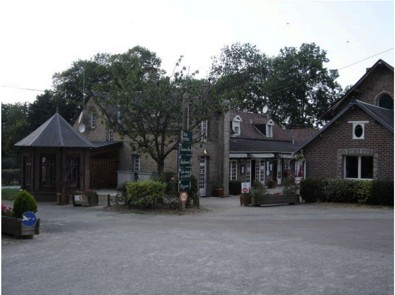
Vue générale des bâtiments agricoles .