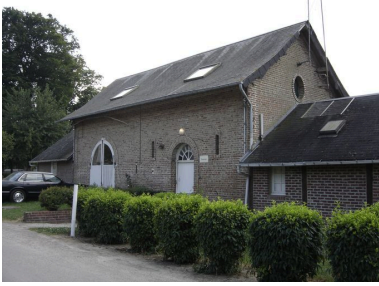
Vue de la grange.