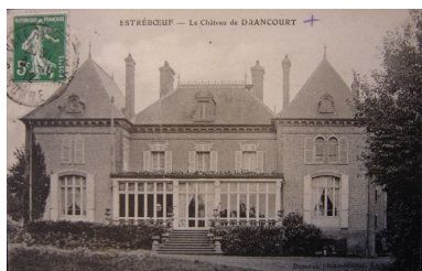
Vue du château au début du 20e siècle.