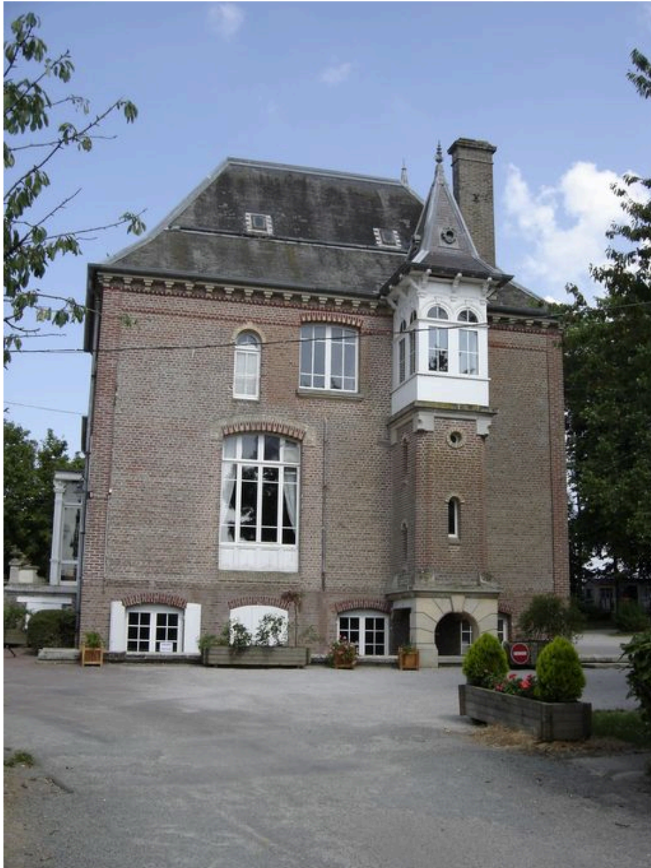
Vue latérale ouest.