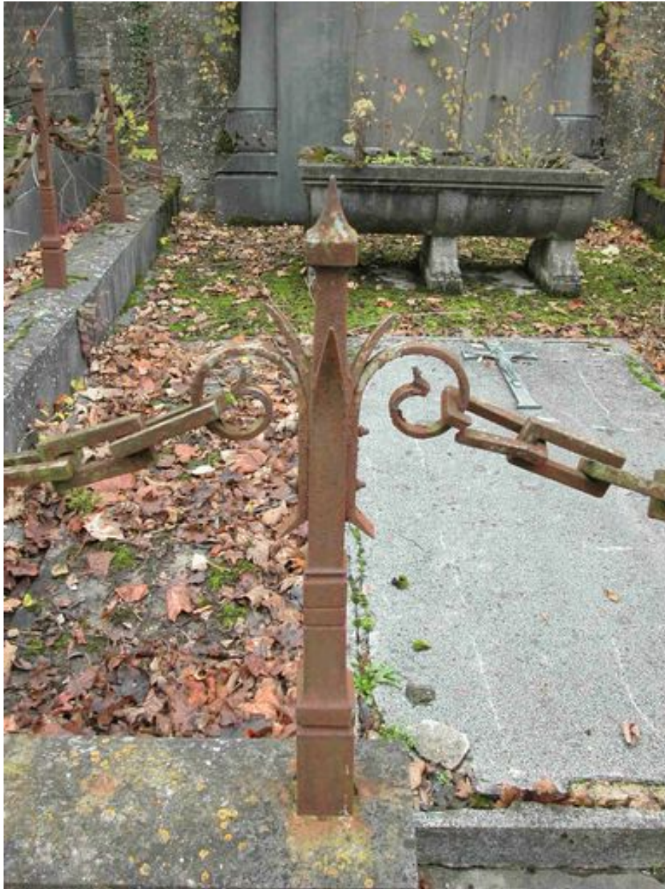
Détail d'un pilier.