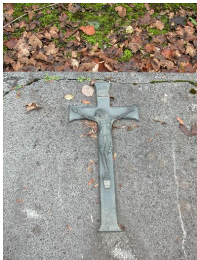
Vue du crucifix.