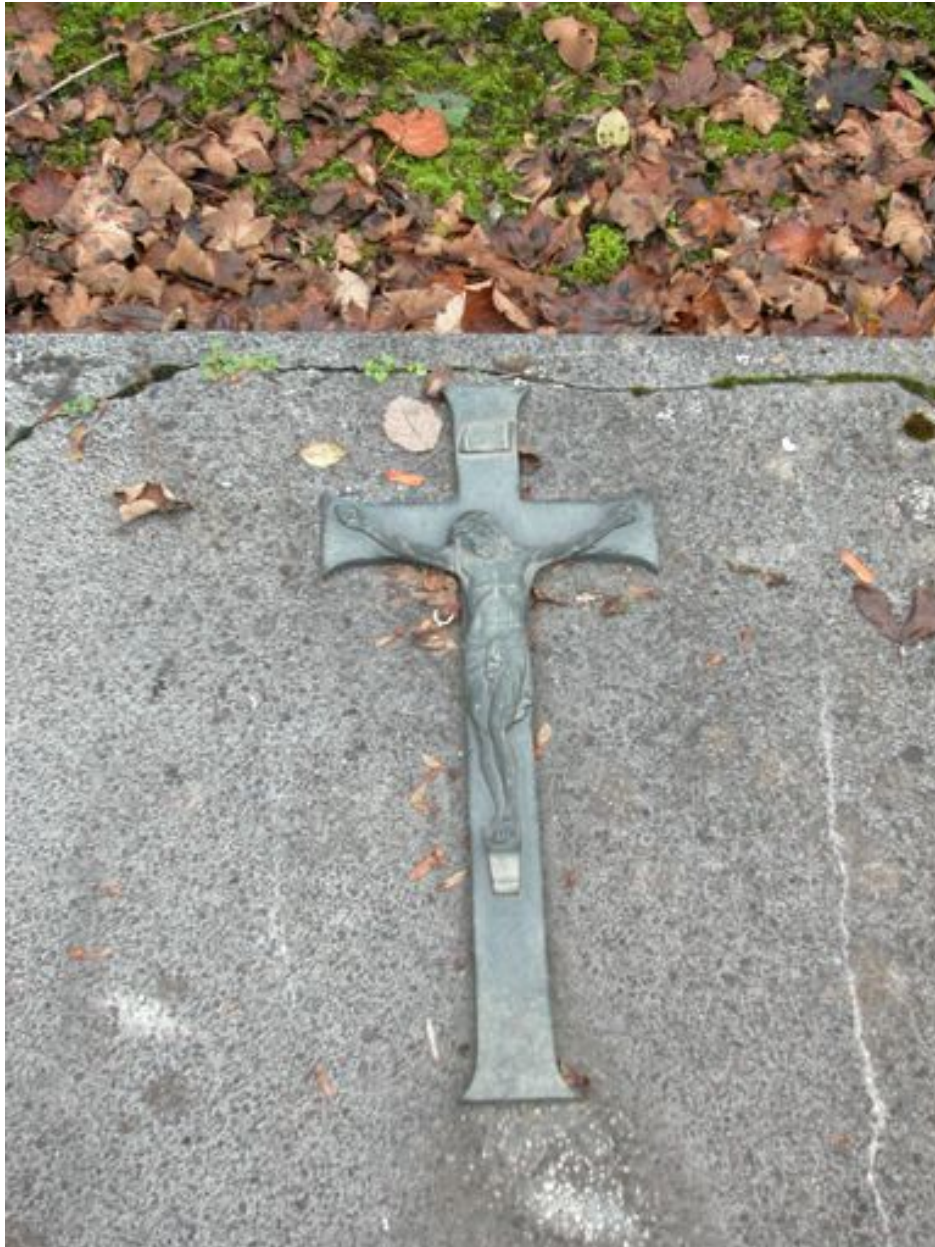
Vue du crucifix.