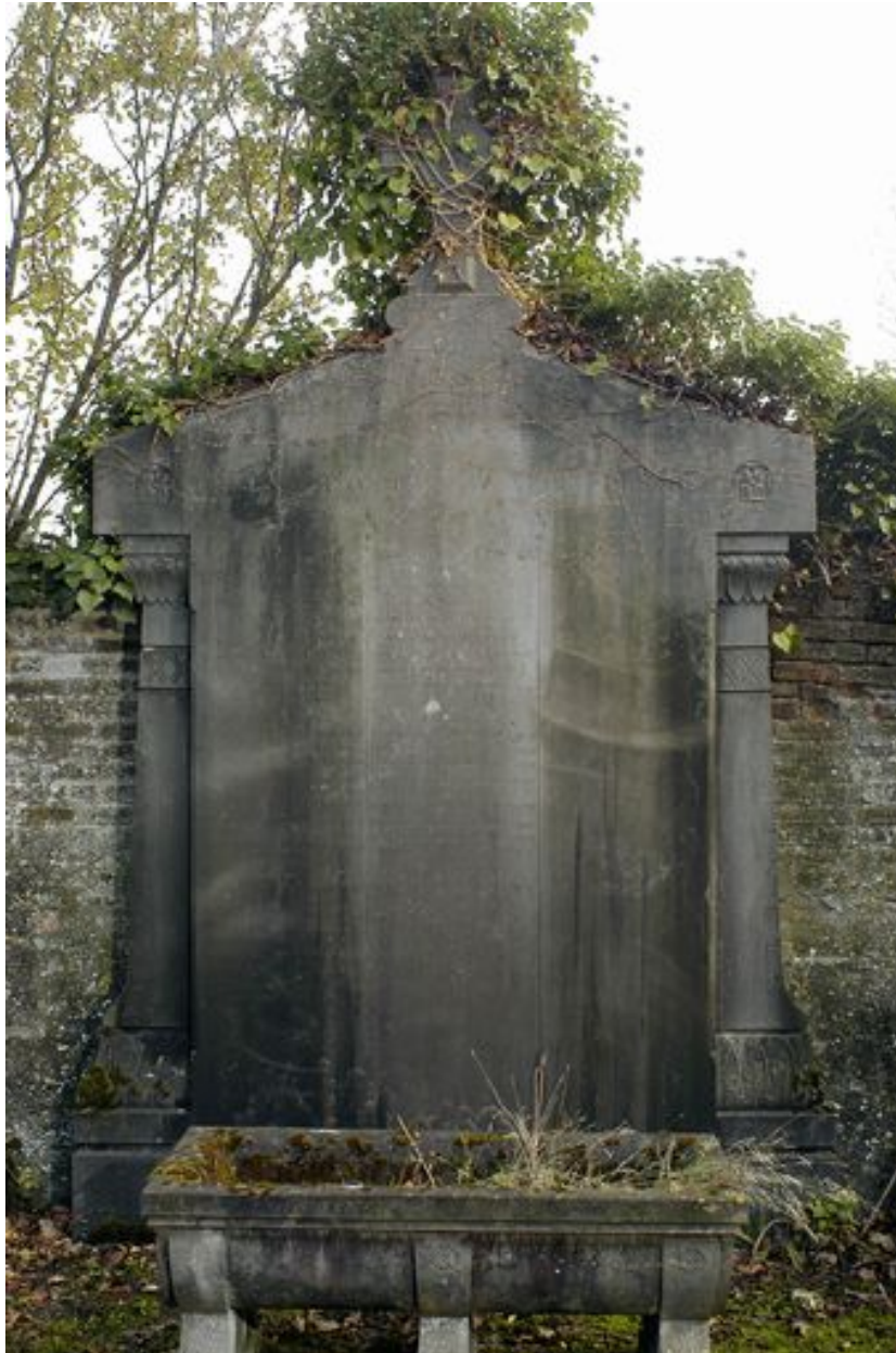
Vue de la stèle.