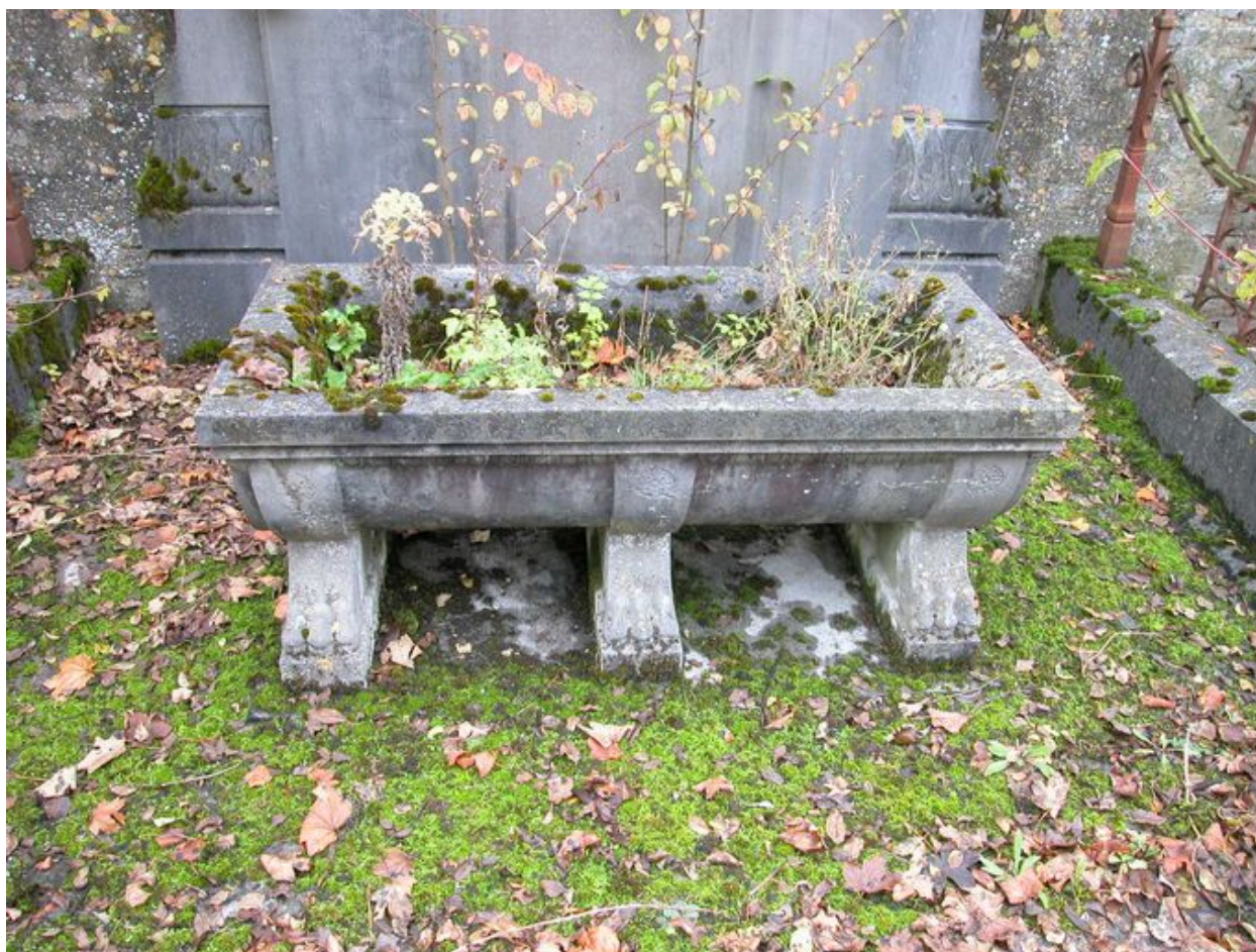
Jardinière à plantes en marbre.