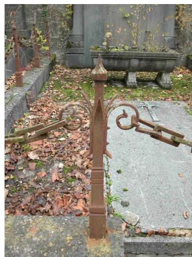
Détail d'un pilier. IVR22_20048001207NUCA