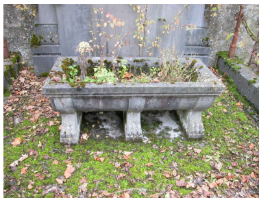
Jardinière à plantes en marbre. IVR22_20048001206NUCA