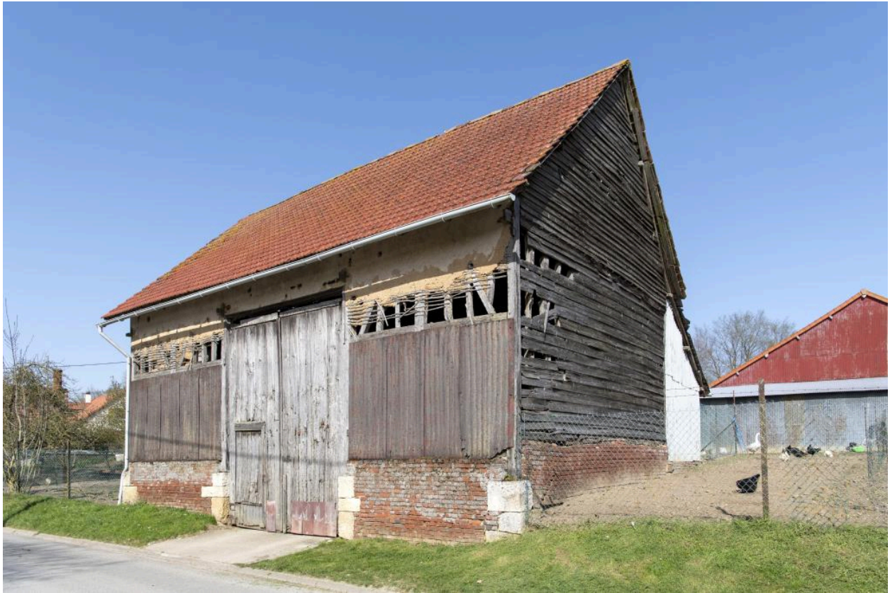
Ancienne grange sur rue, n°10 rue du Chauffour, vue depuis le sud-ouest.