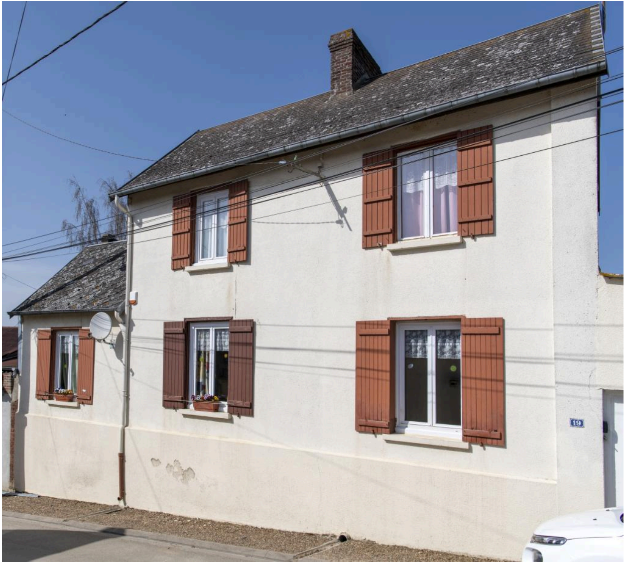
Ancien commerce (?) n°19 rue de Saint-Pierre, vue depuis le sud.