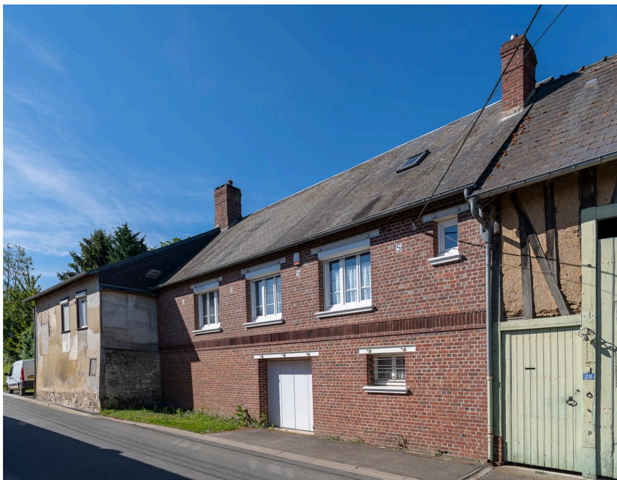
Maison datée de 1955 (date portée sur la façade), n°28 rue des Fresnes, vue depuis l'est.