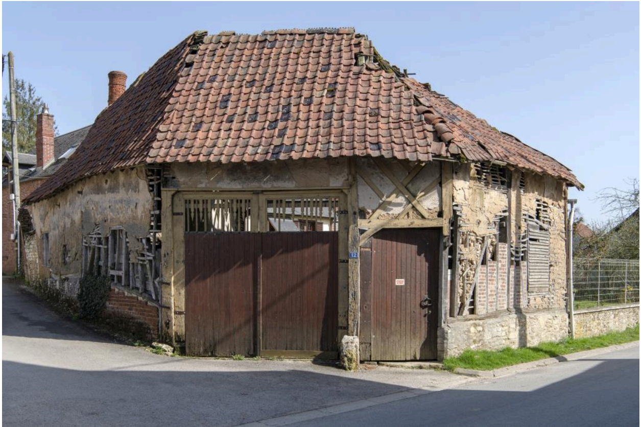
Anciennes entrée charretière et porte piétonne, n°12 rue du Chauffour, vue depuis le nord-ouest.