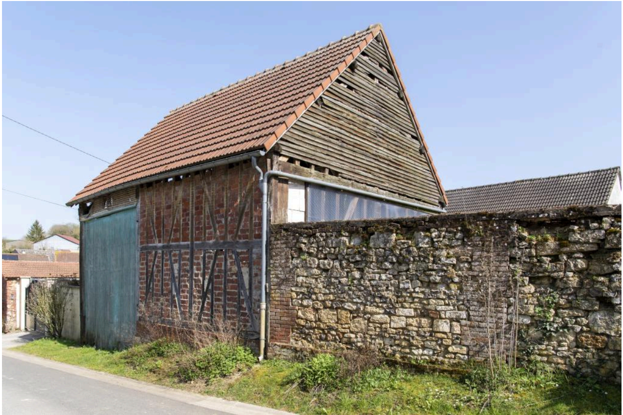
Ancienne grange alignée sur la rue, n°7 rue des Fresnes, vue depuis le nord-ouest.