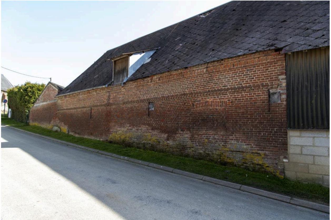
Bâtiments agricoles alignés sur la rue de la ferme au n°2 rue Saint-Pierre, vue depuis le nord.