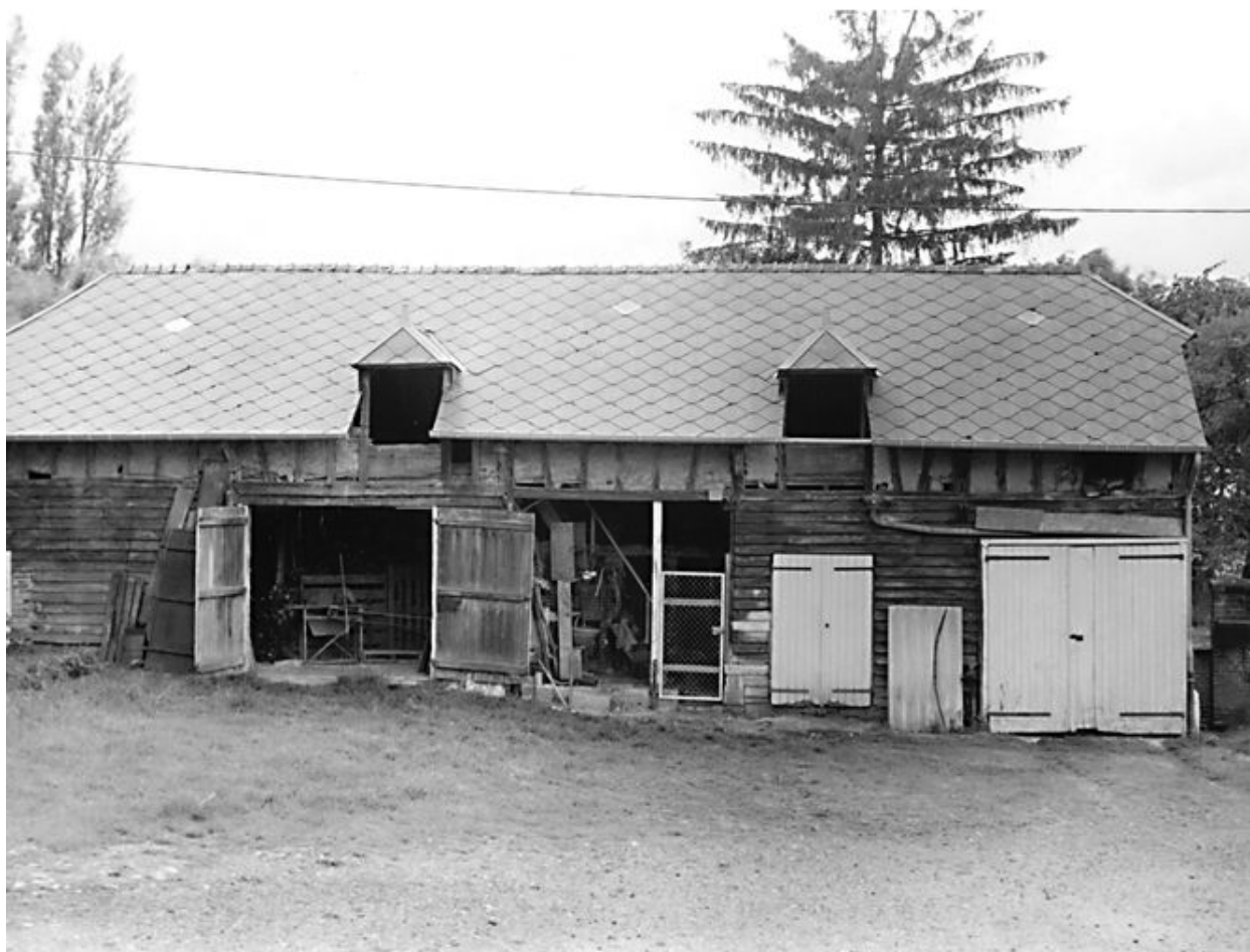
Vue de l'étable et de la forge.