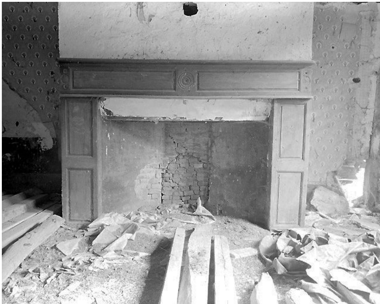
Vue de la cheminée de la pièce principale du logis portant la date 1820.