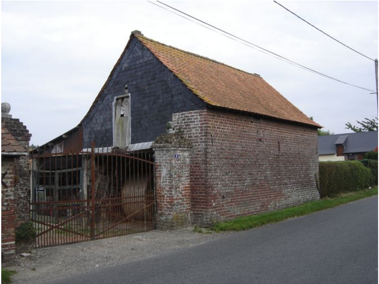
Vue de la charreterie sur rue.