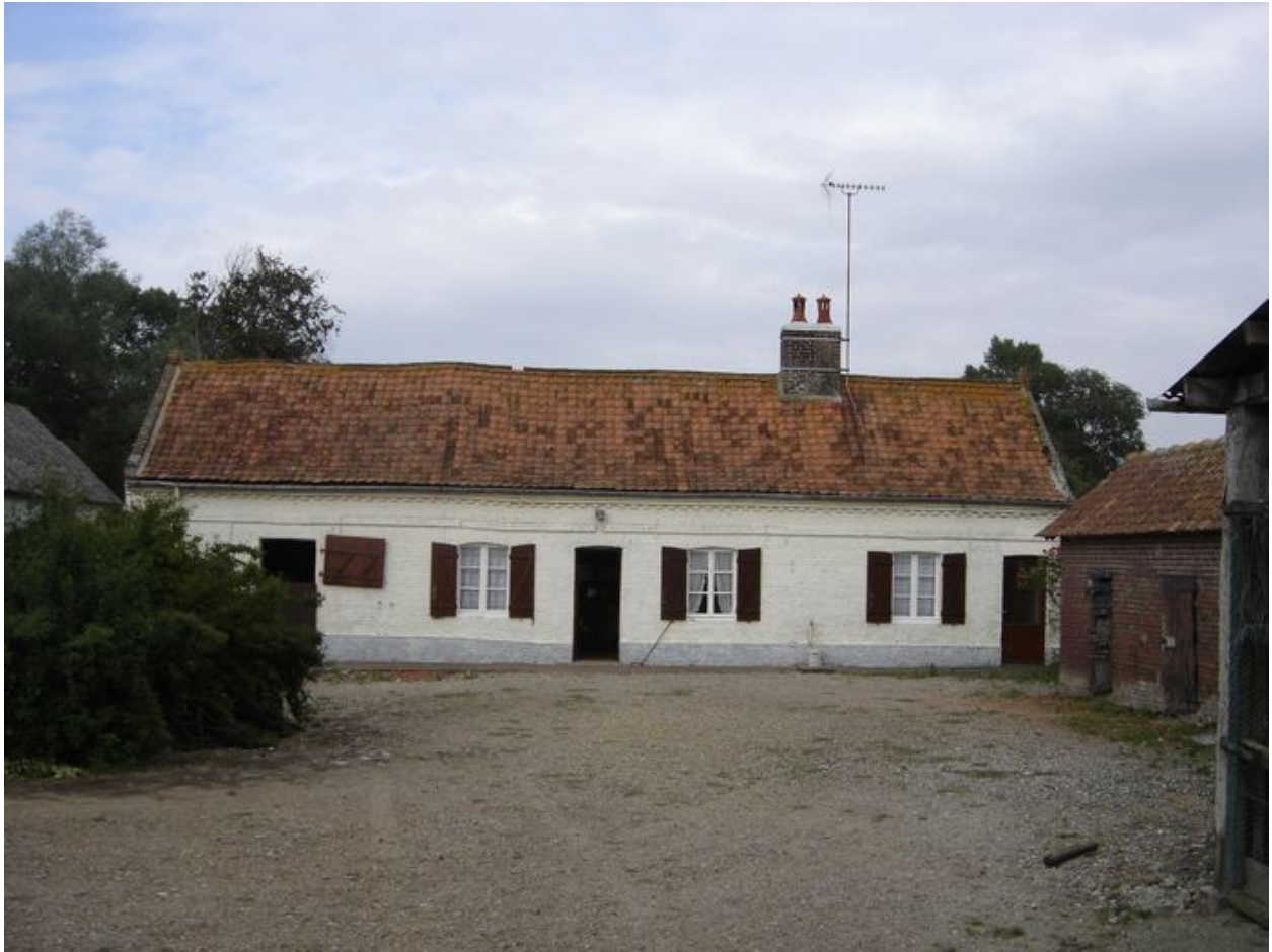
Vue du logis.