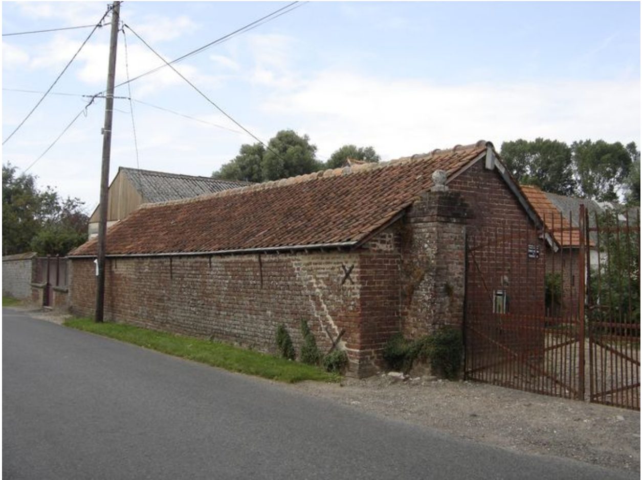
Vue des étables sur rue.