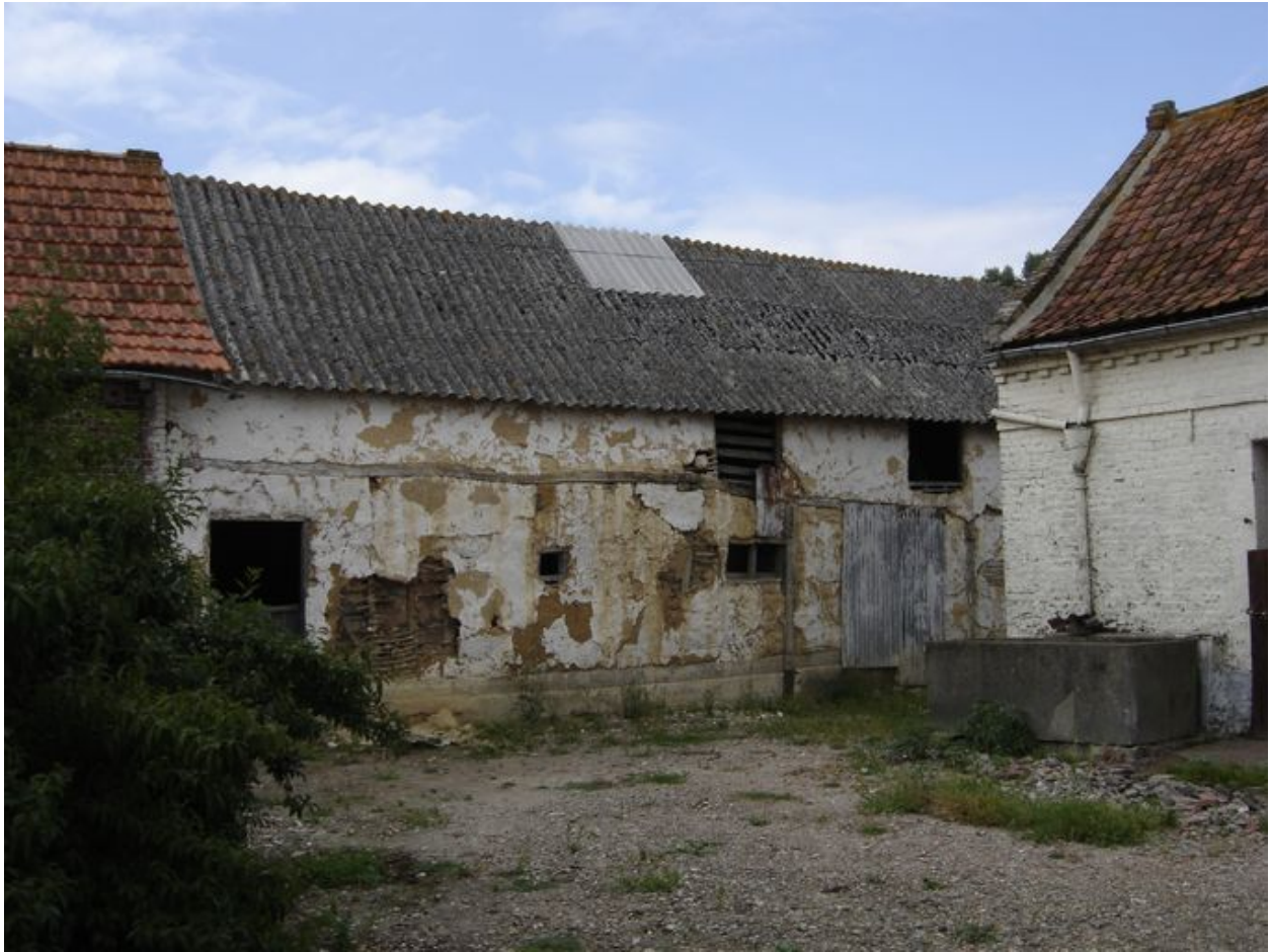
Vue de la grange.