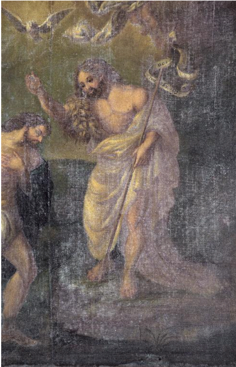
Détail du tableau : saint Jean-Baptiste.