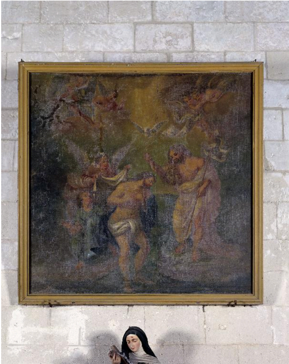
Vue générale du tableau.