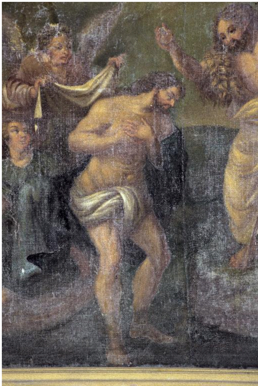
Détail du tableau : le Christ.