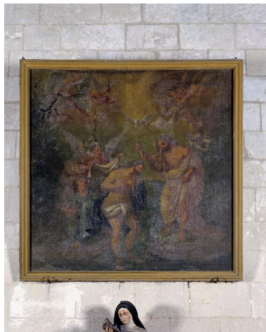
Vue générale du tableau. IVR22_19930200137VA