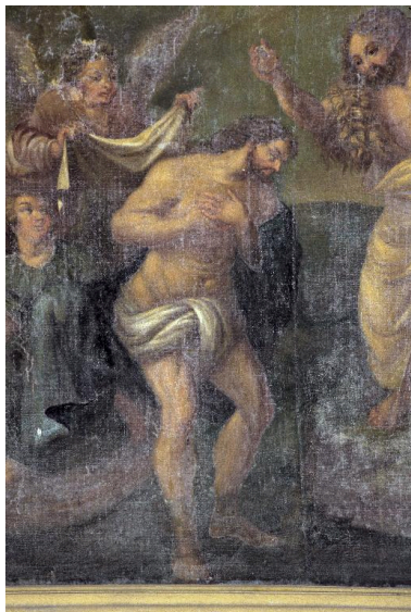
Détail du tableau : le Christ.