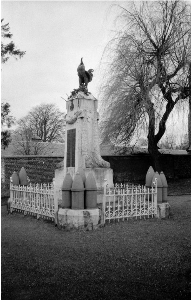
Vue de trois-quarts.