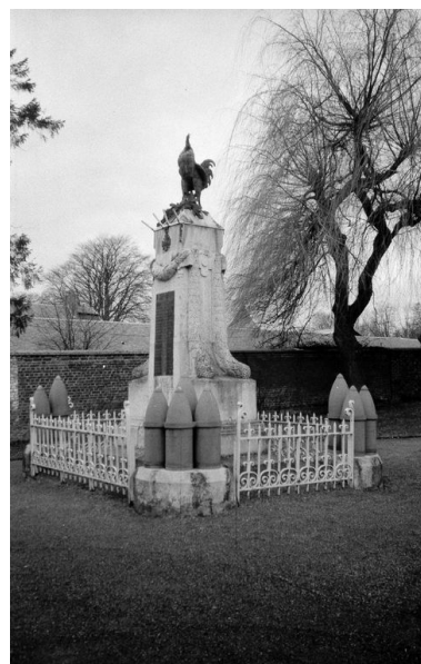
Vue de trois-quarts. IVR22_19968000180Z