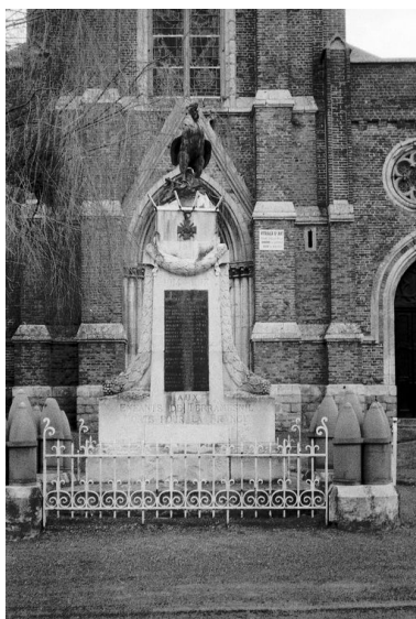
Vue antérieure. IVR22_19968000179Z