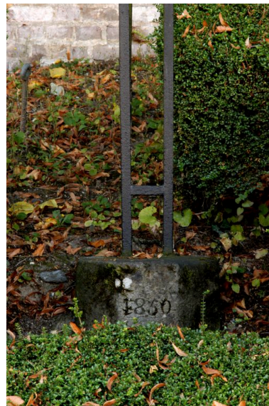
Détail sur la date portée sur la base.