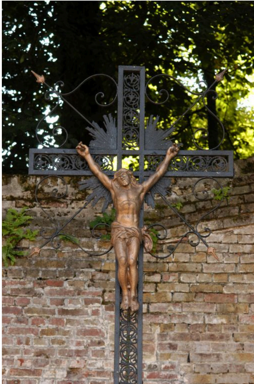
Détail sur la partie supérieure de la croix.