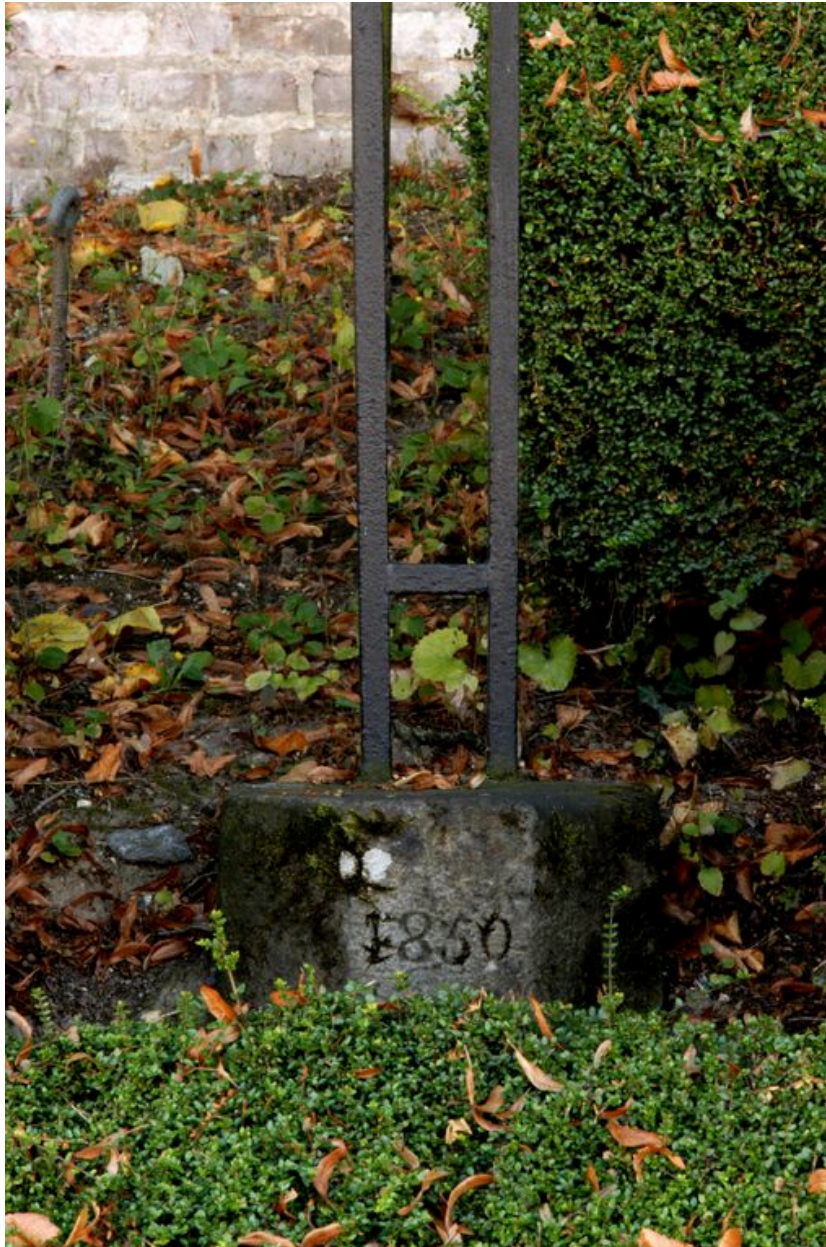
Détail sur la date portée sur la base.