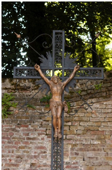
Détail sur la partie supérieure de la croix. IVR22_20038000890NUCA