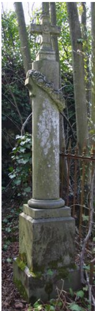
Colonne (droite).