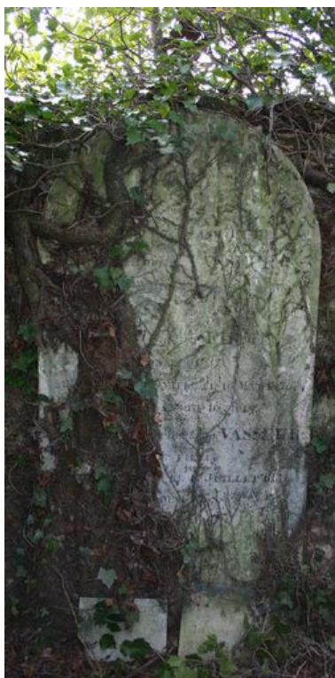
Stèle cintrée. IVR22_20068000813NUCA