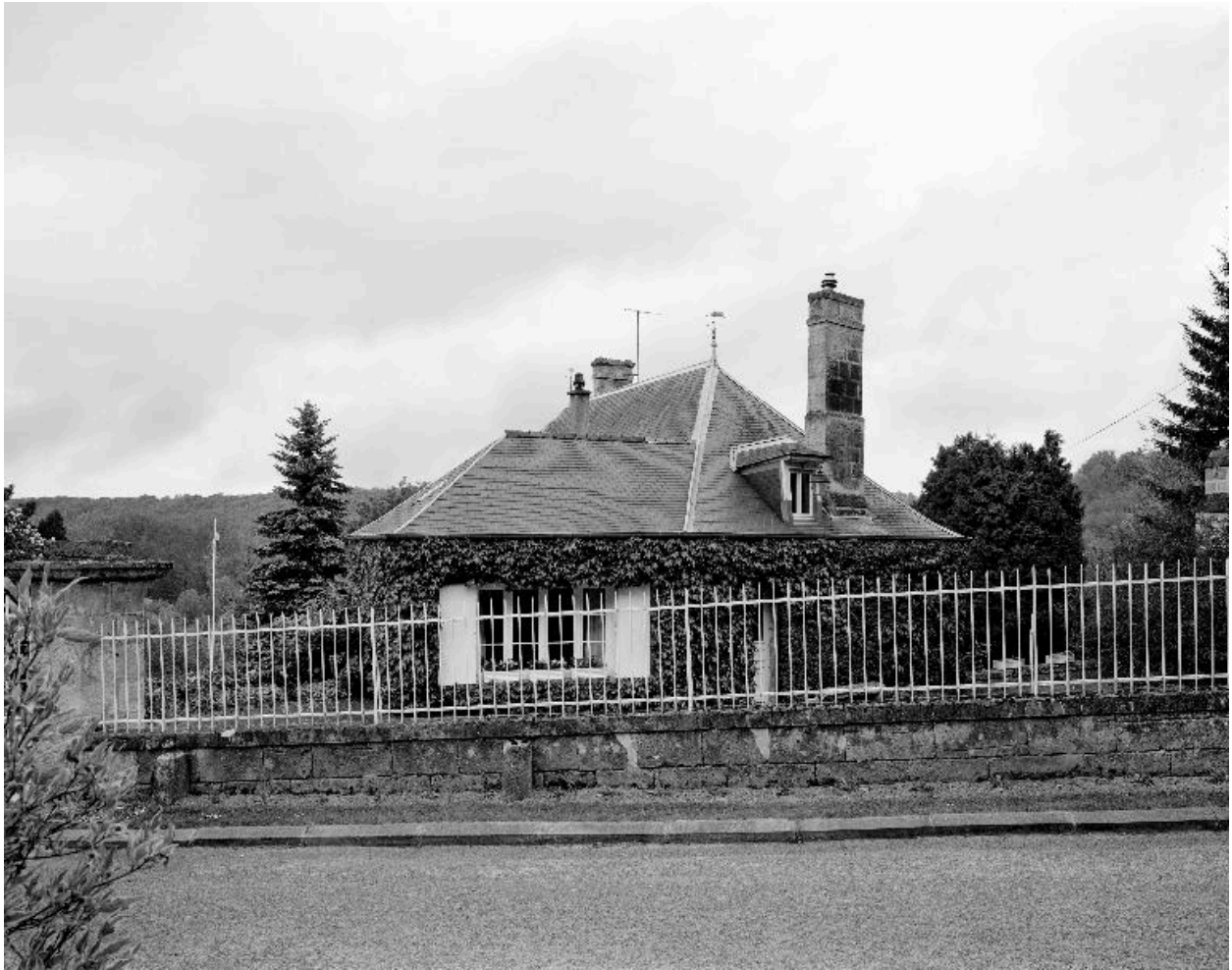
Vue de l'ancien presbytère, depuis la rue de l'Église à l'ouest.