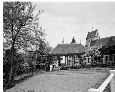
Vue nord-ouest de l'ancien presbytère, dans son environnement.

IVR22_19900200857V