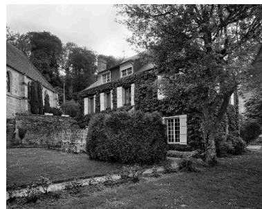
Vue de l'ancien presbytère, depuis l'est.

Phot. Thierry Lefébure IVR22_19900200860V