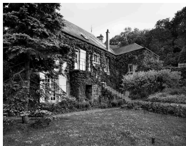
Vue générale nord.

IVR22_19900200858V