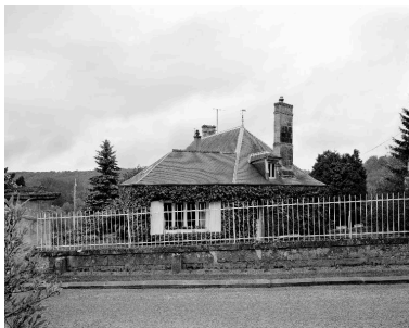
Vue de l'ancien presbytère, depuis la rue de l'Église à l'ouest.

IVR32_20160205187NUCA