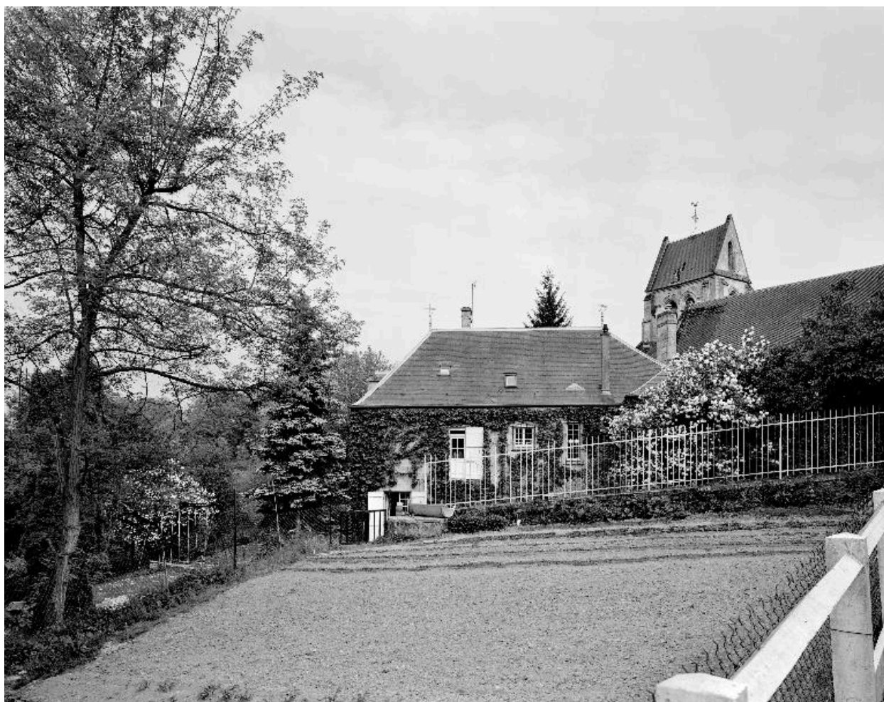
Vue nord-ouest de l'ancien presbytère, dans son environnement.