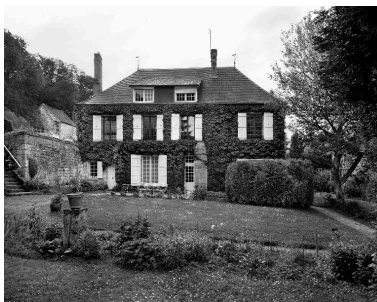
Vue de l'élévation sud-est.

Phot. Thierry Lefébure IVR22_19900200859V