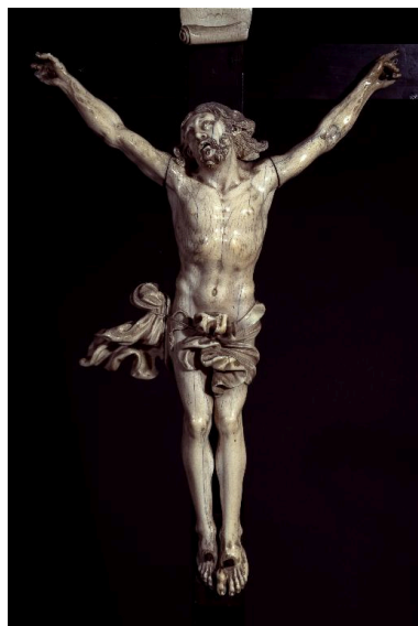
Vue de détail : le Christ. IVR22_19956000404XA