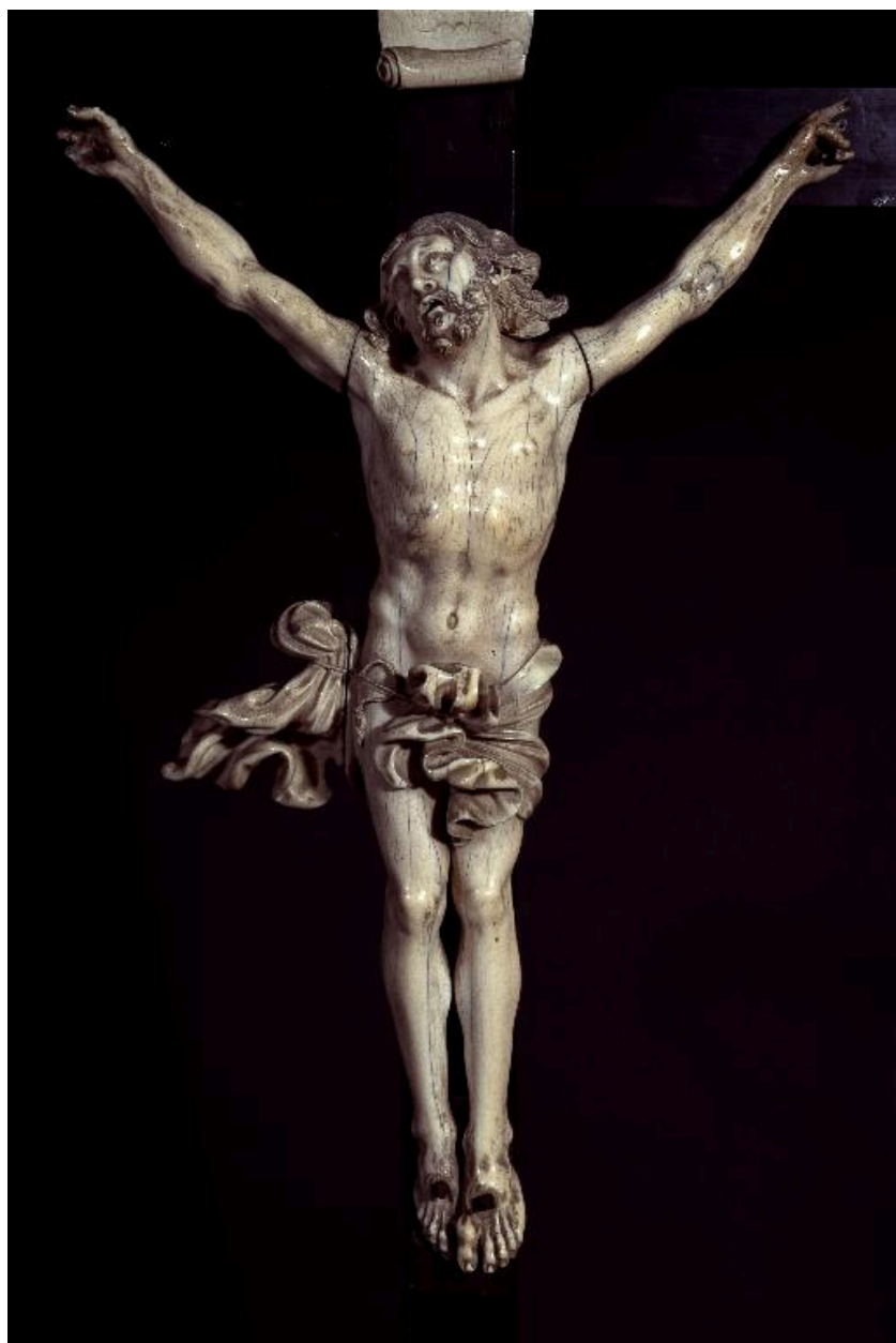
Vue de détail : le Christ.