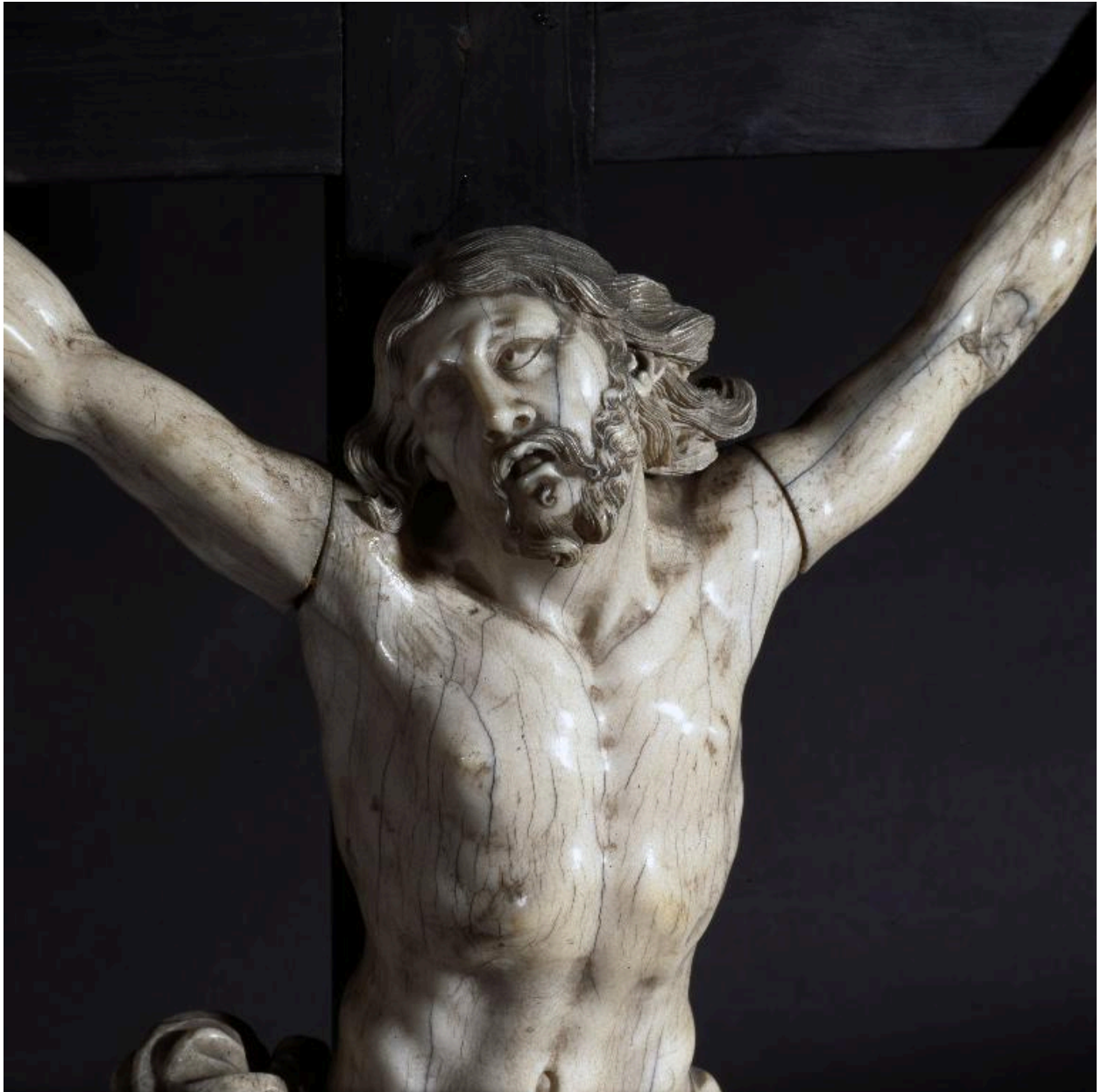
Vue de détail : la partie haute du Christ.