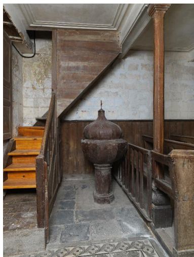
Vue de situation. IVR22_20128001310NUC2A