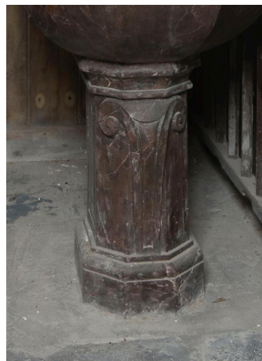
Pied de la cuve. IVR22_20148000121NUC2A