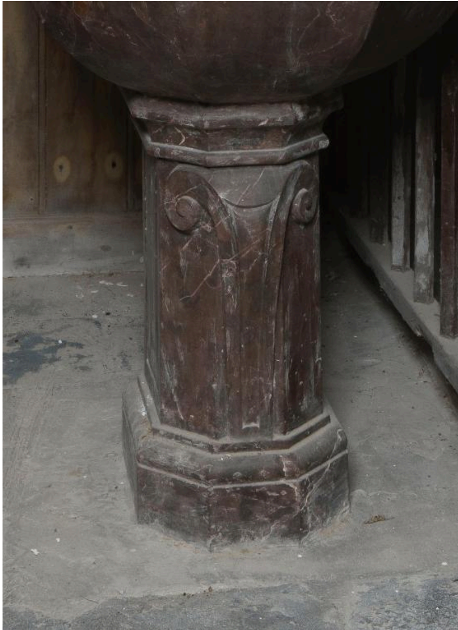
Pied de la cuve.