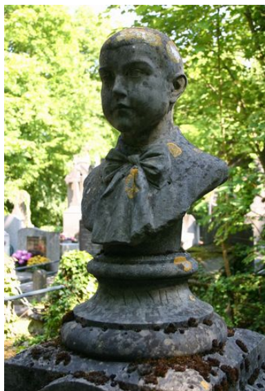
Vue générale. IVR22_20098001340NUCA