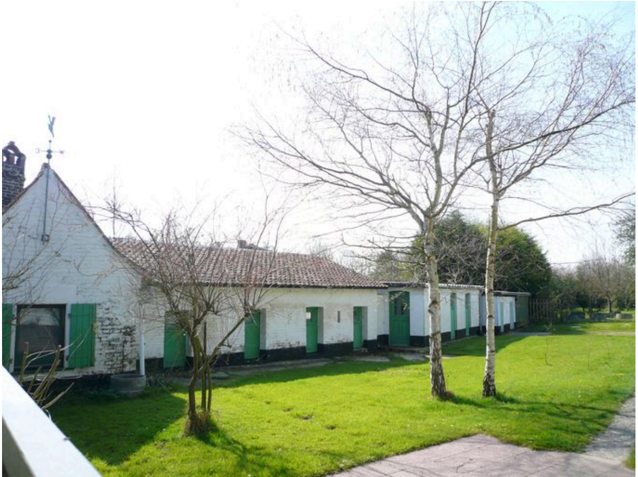
Vue des dépendances.