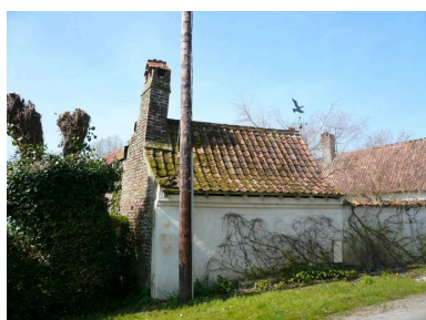
Vue postérieure du fournil. IVR22_20078005917NUCA