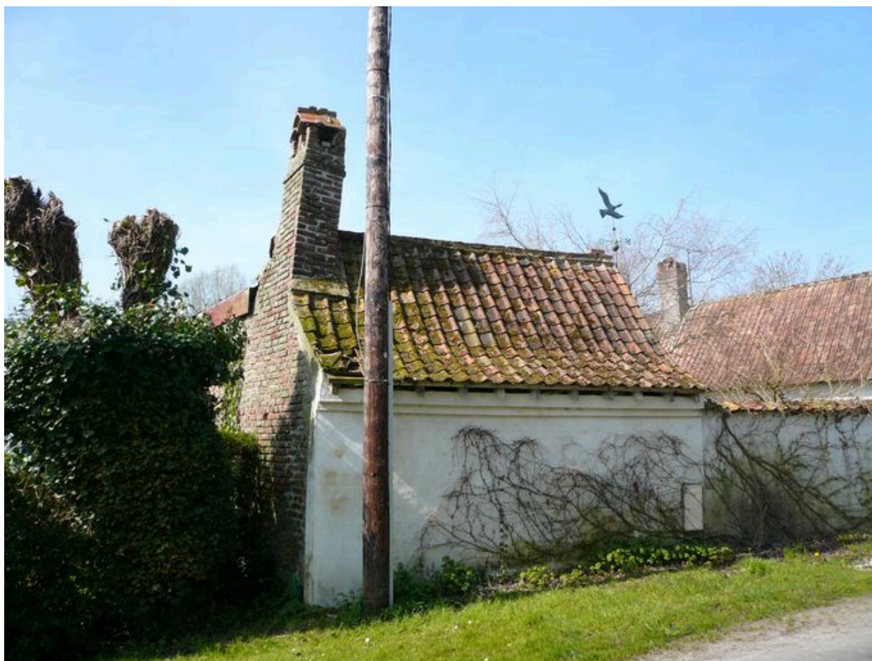
Vue postérieure du fournil.