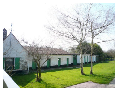
Vue des dépendances.