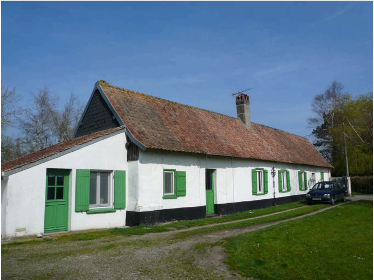
Vue du logis.