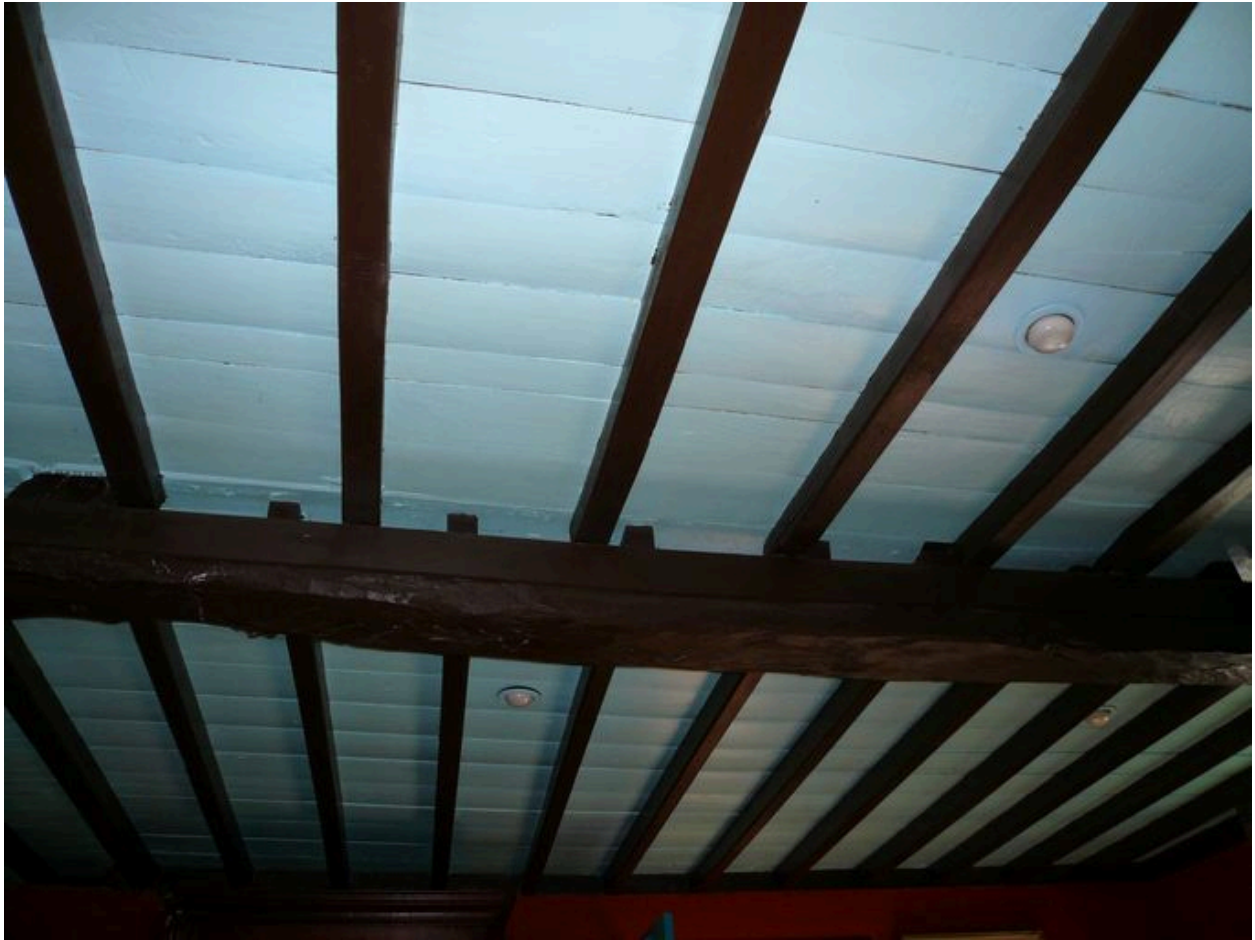
Vue du plafond de la salle commune avec poutres maîtresses et solives apparentes.