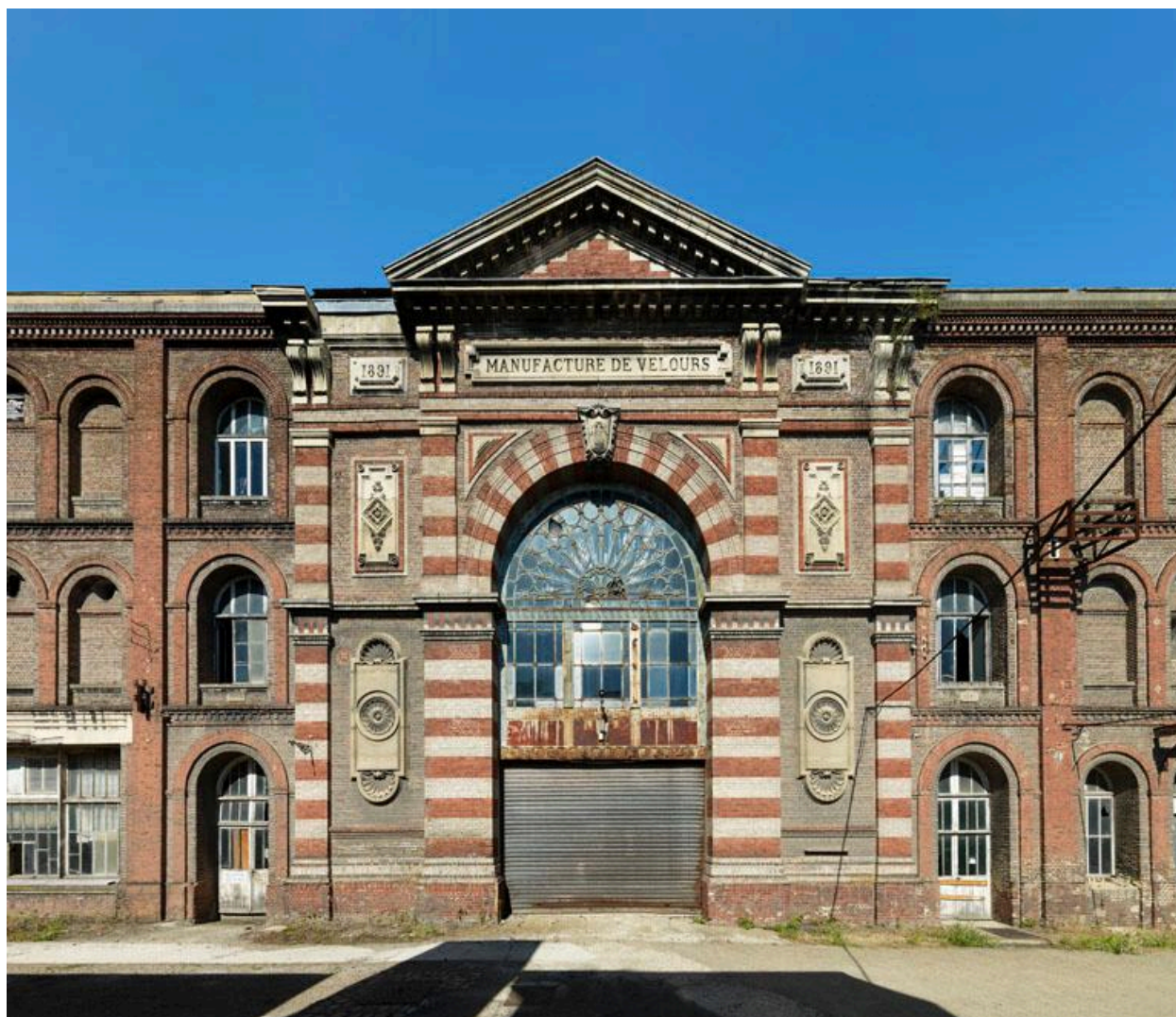
AMIENS. Ancien tissage de toiles et de velours, dit manufacture de velours Cosserat - Façade de la salle des machines.