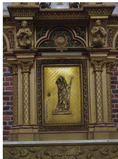
Tabernacle, de face : porte avec le Bon Pasteur IVR31_20106202665NUCA