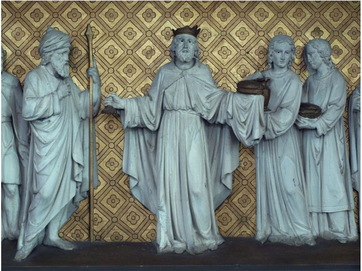
Détail du devant d'autel : Abraham et Melchisédech