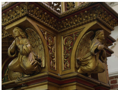
Consoles sculptées sous l'exposition : anges en prière IVR31_20106202664NUCA