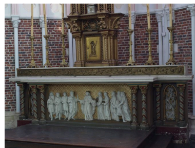
Autel et tabernacle IVR31_20106202658NUCA