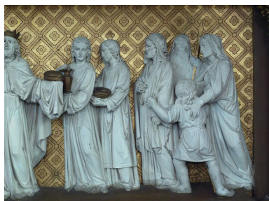
Détail du devant d'autel : personnages à senestre IVR31_20106202661NUCA