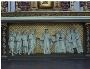
Relief du devant d'autel, vue générale IVR31_20106202659NUCA