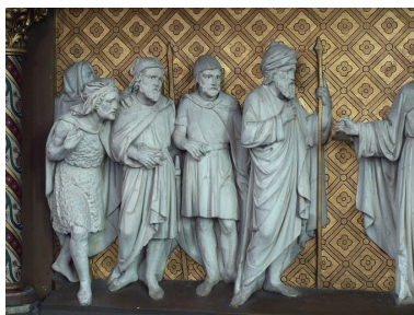
Détail du devant d'autel : personnages à droite IVR31_20106202662NUCA