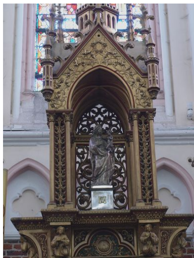
Maître-autel, détail : exposition abritant la Vierge à l'Enfant IVR31_20106202667NUCA