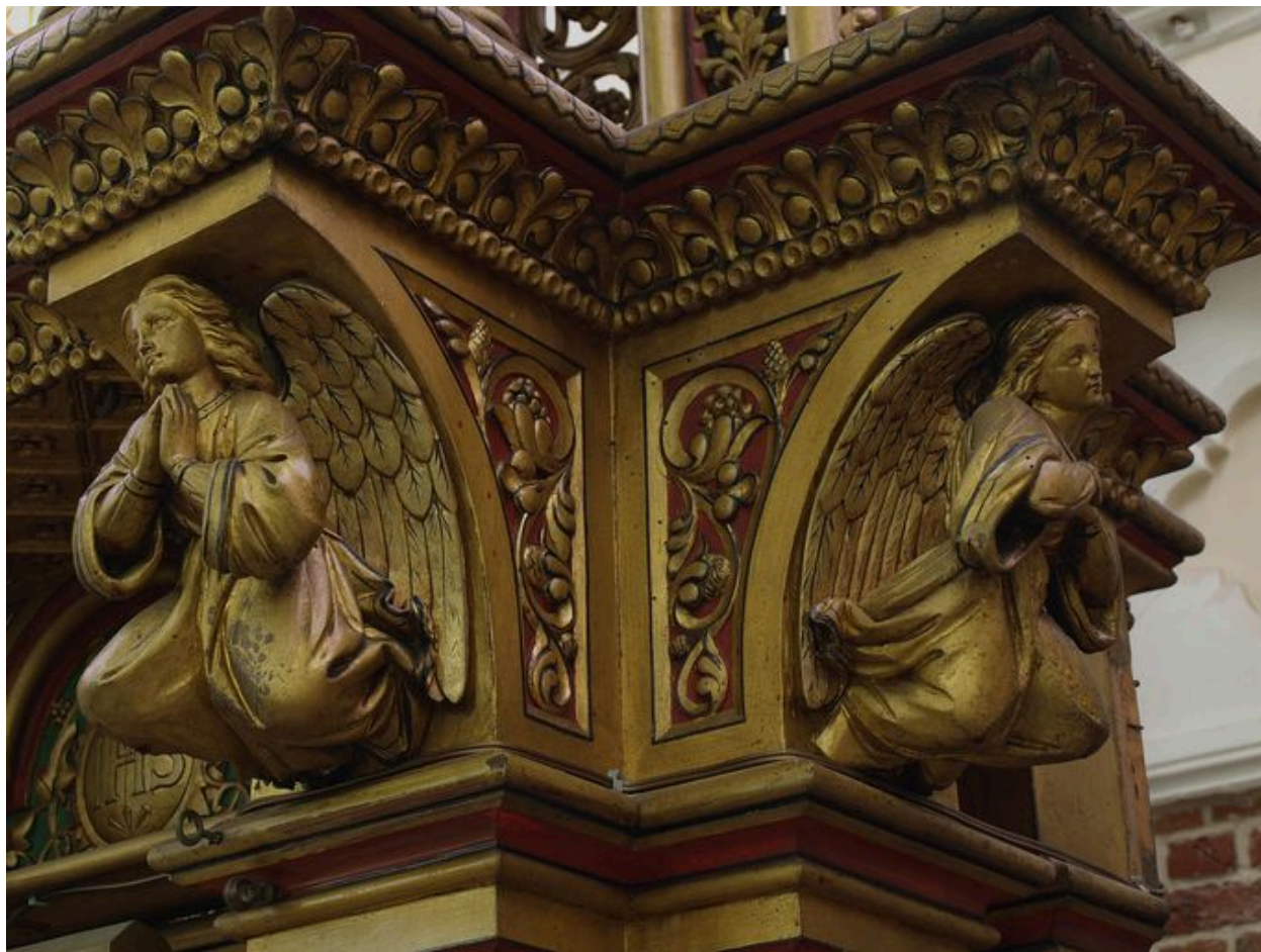
Consoles sculptées sous l'exposition : anges en prière