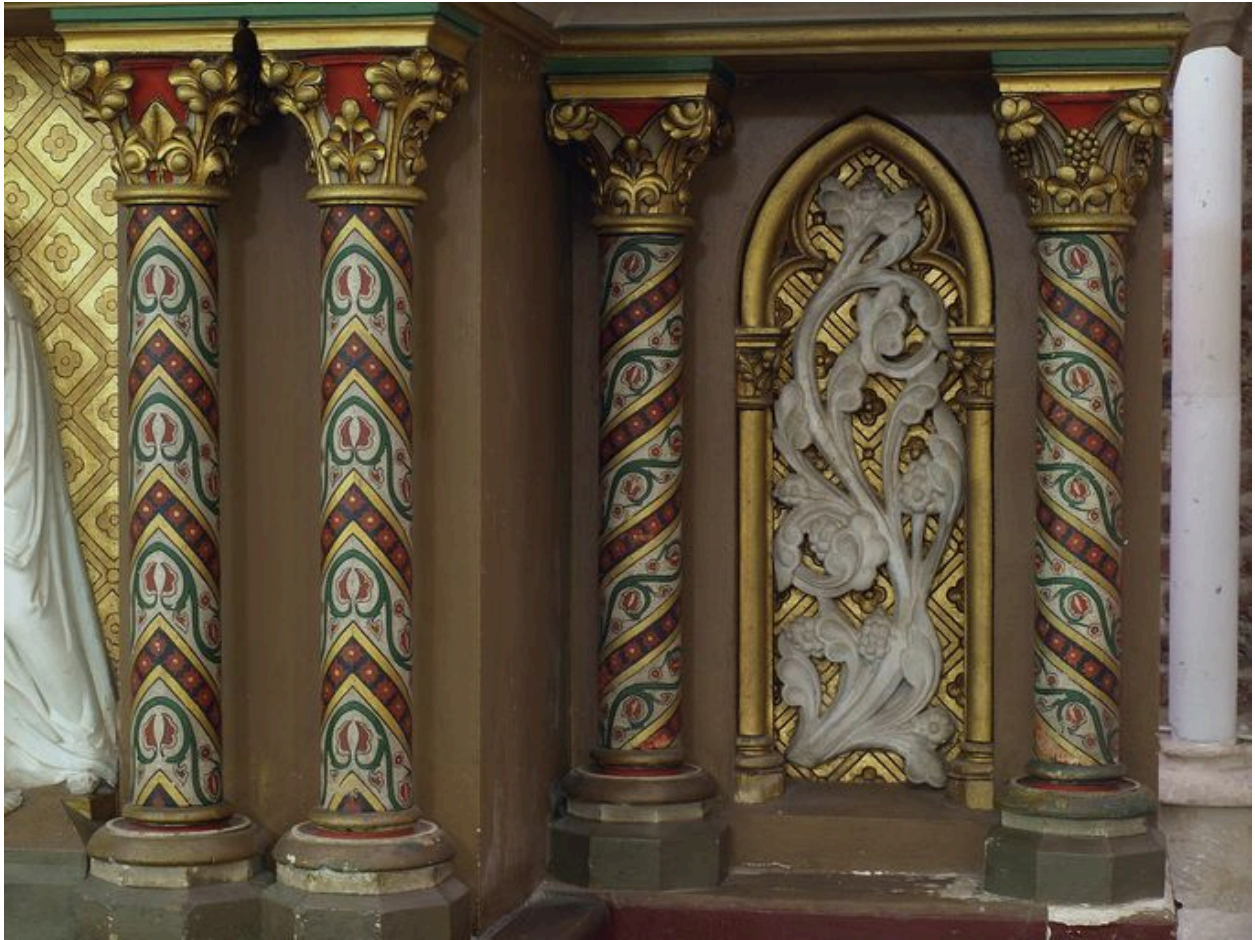
Partie antérieure senestre de l'autel : décor peint et doré