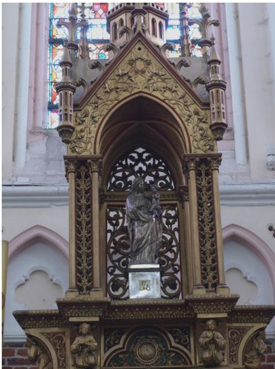
Maître-autel, détail : exposition abritant la Vierge à l'Enfant