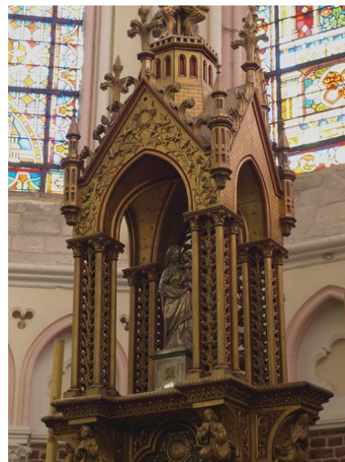
Exposition IVR31_20106202666NUCA