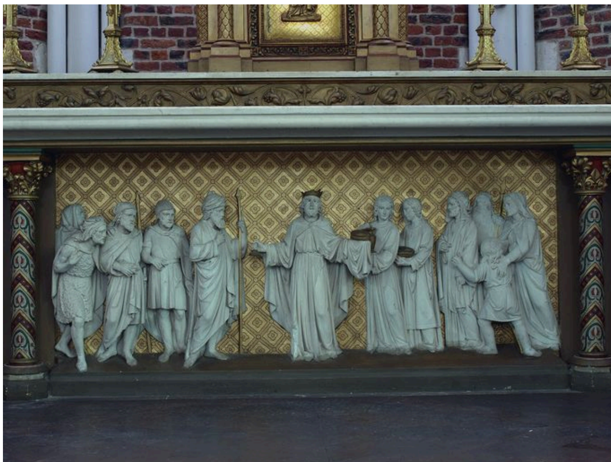
Relief du devant d'autel, vue générale