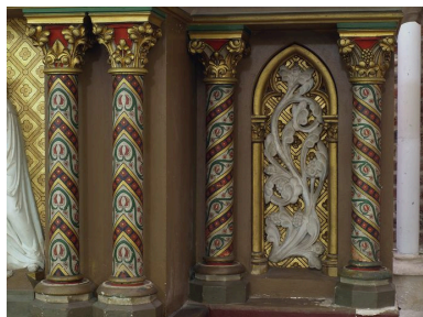
Partie antérieure senestre de l'autel : décor peint et doré IVR31_20106202663NUCA