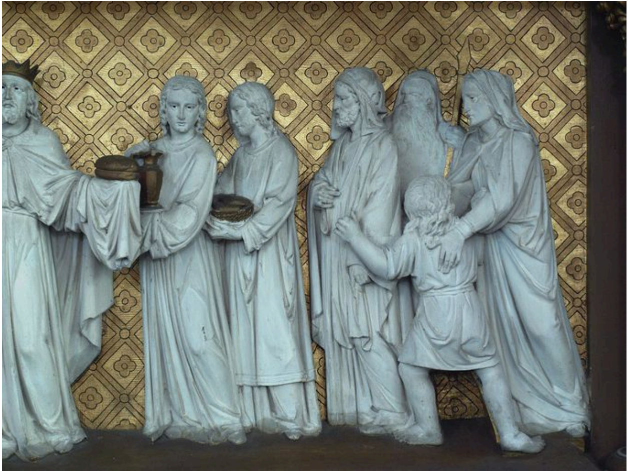
Détail du devant d'autel : personnages à senestre