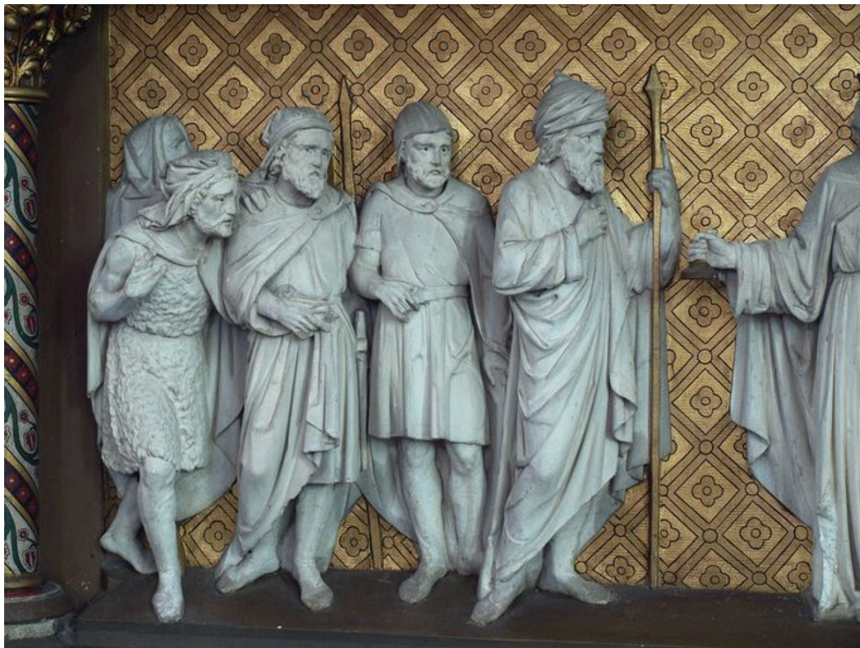
Détail du devant d'autel : personnages à dextre