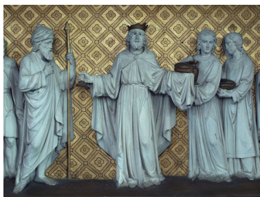
Détail du devant d'autel : Abraham et Melchisédech IVR31_20106202660NUCA