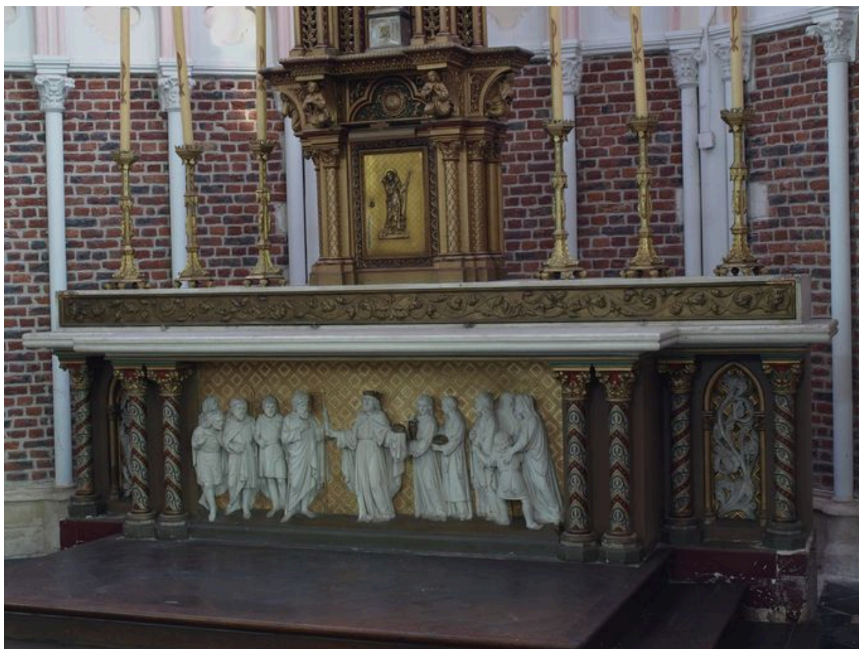
Autel et tabernacle