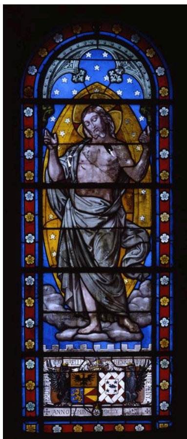
Baie 1. Le Christ glorieux. IVR22_19930202036XA