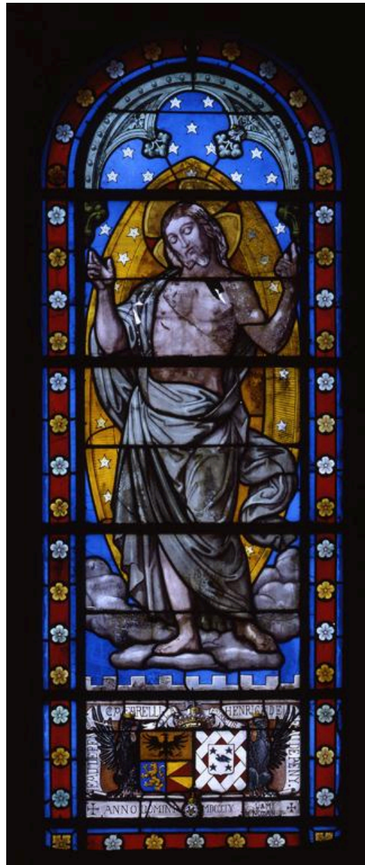
Baie 1. Le Christ glorieux.