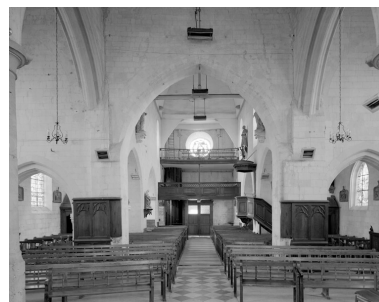
Vue intérieure, depuis le chœur. IVR22_19988000090V