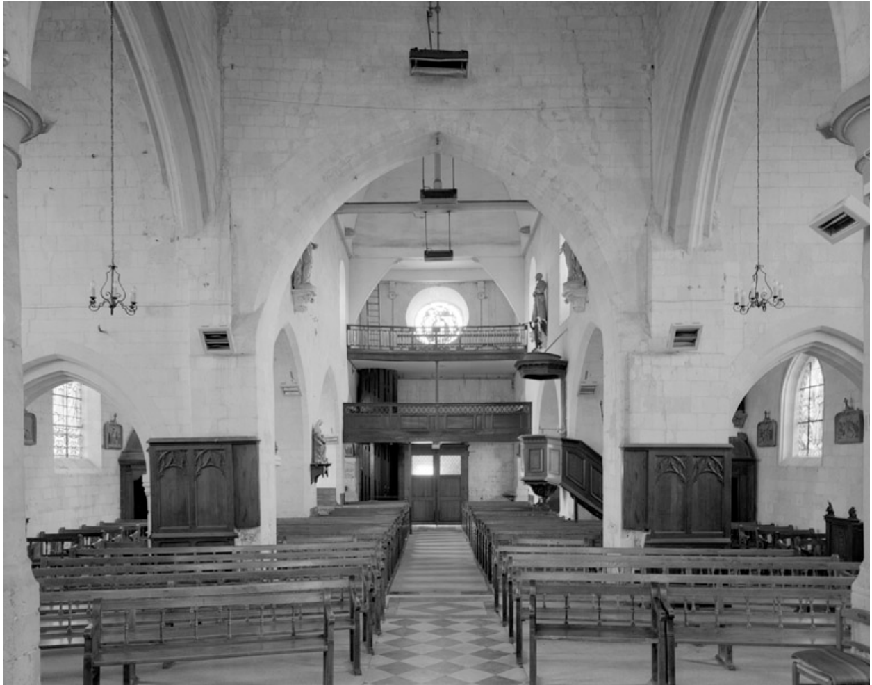
Vue intérieure, depuis le choeur.