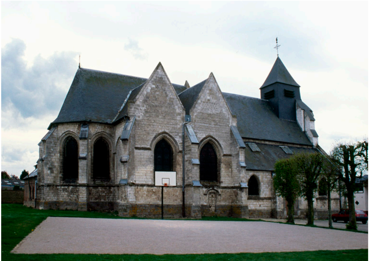
Vue générale depuis le nord-est.