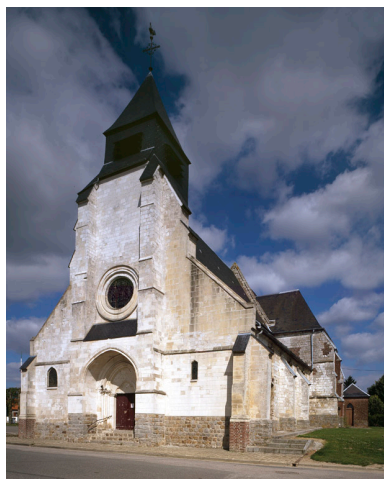
Vue générale depuis le sud-ouest. IVR22_19988000851VA