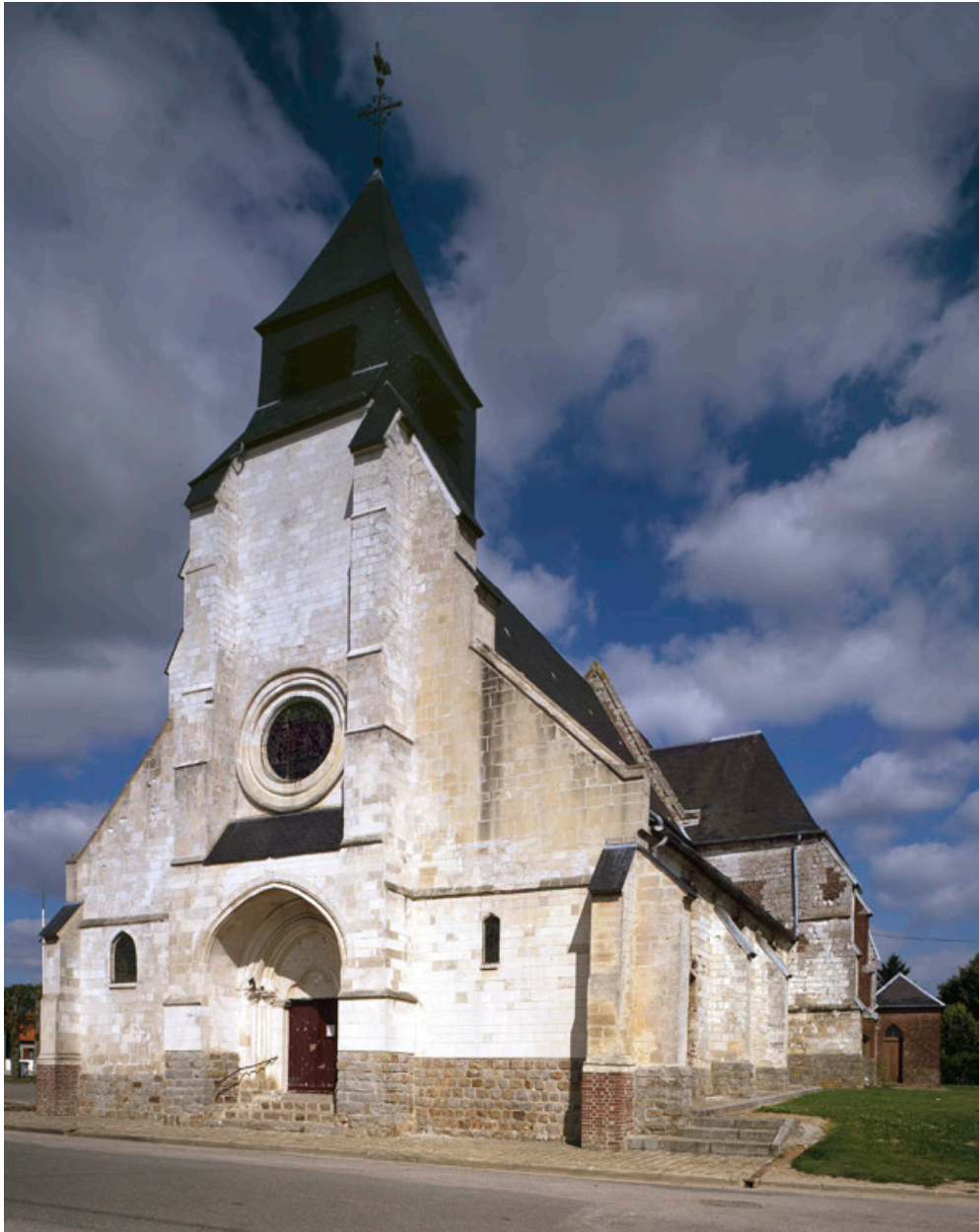
Vue générale depuis le sud-ouest.