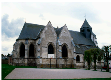
Vue générale depuis le nord-est.