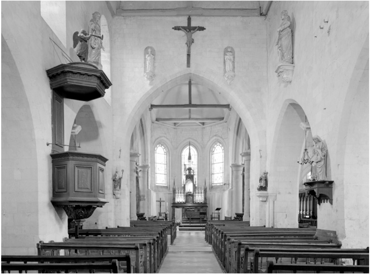
Vue intérieure, vers le chœur.