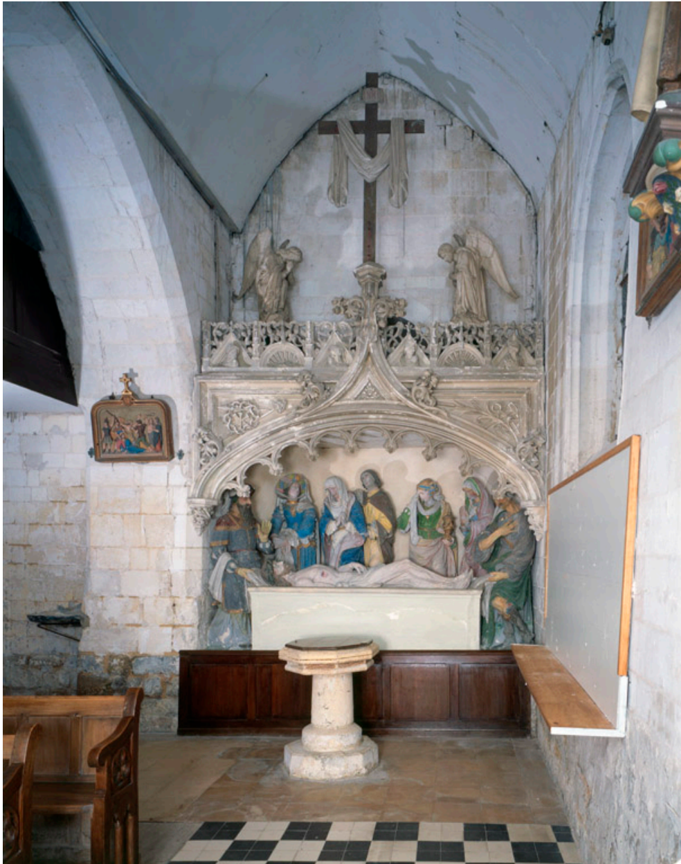
Première travée du collatérale nord.