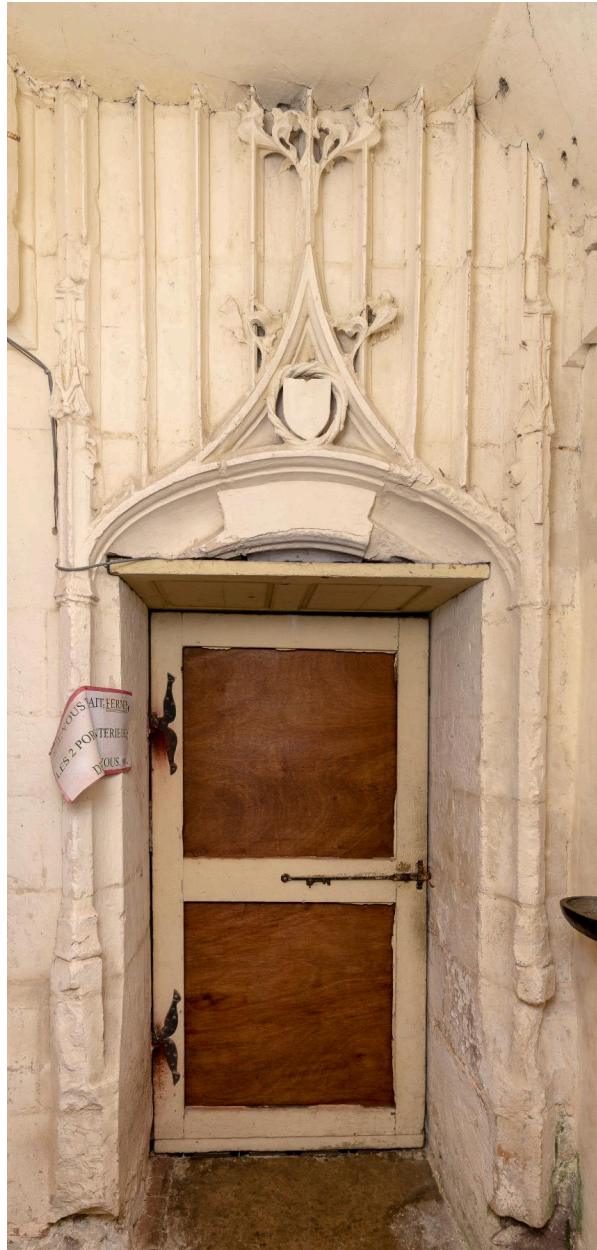
Porte d'entrée dans le chœur depuis l'ancienne sacristie.