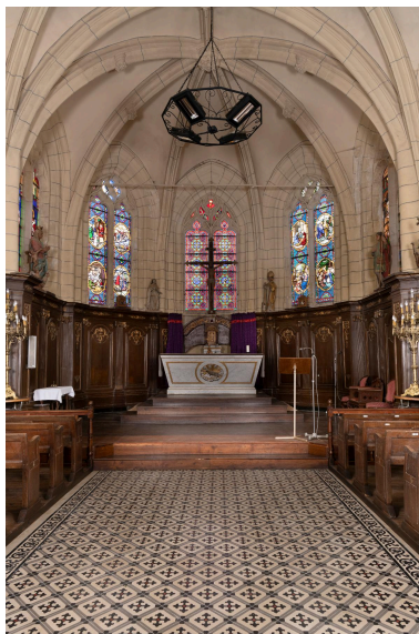
Vue générale du chœur.