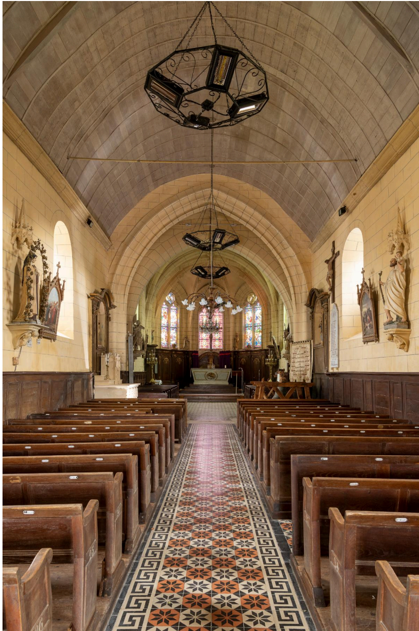
Vue générale vers le chœur.