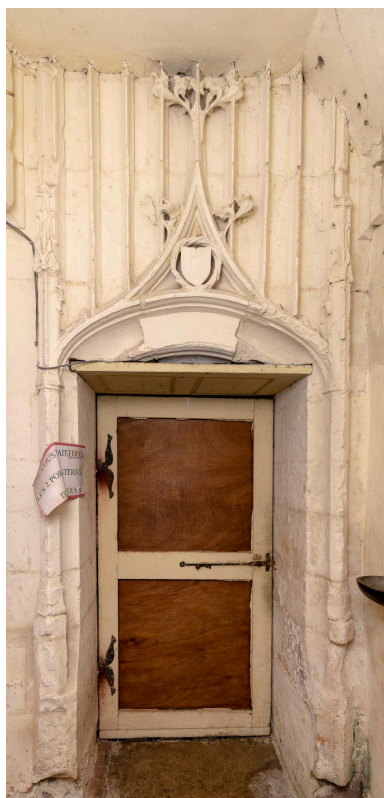
Porte d'entrée dans le chœur depuis l'ancienne sacristie.