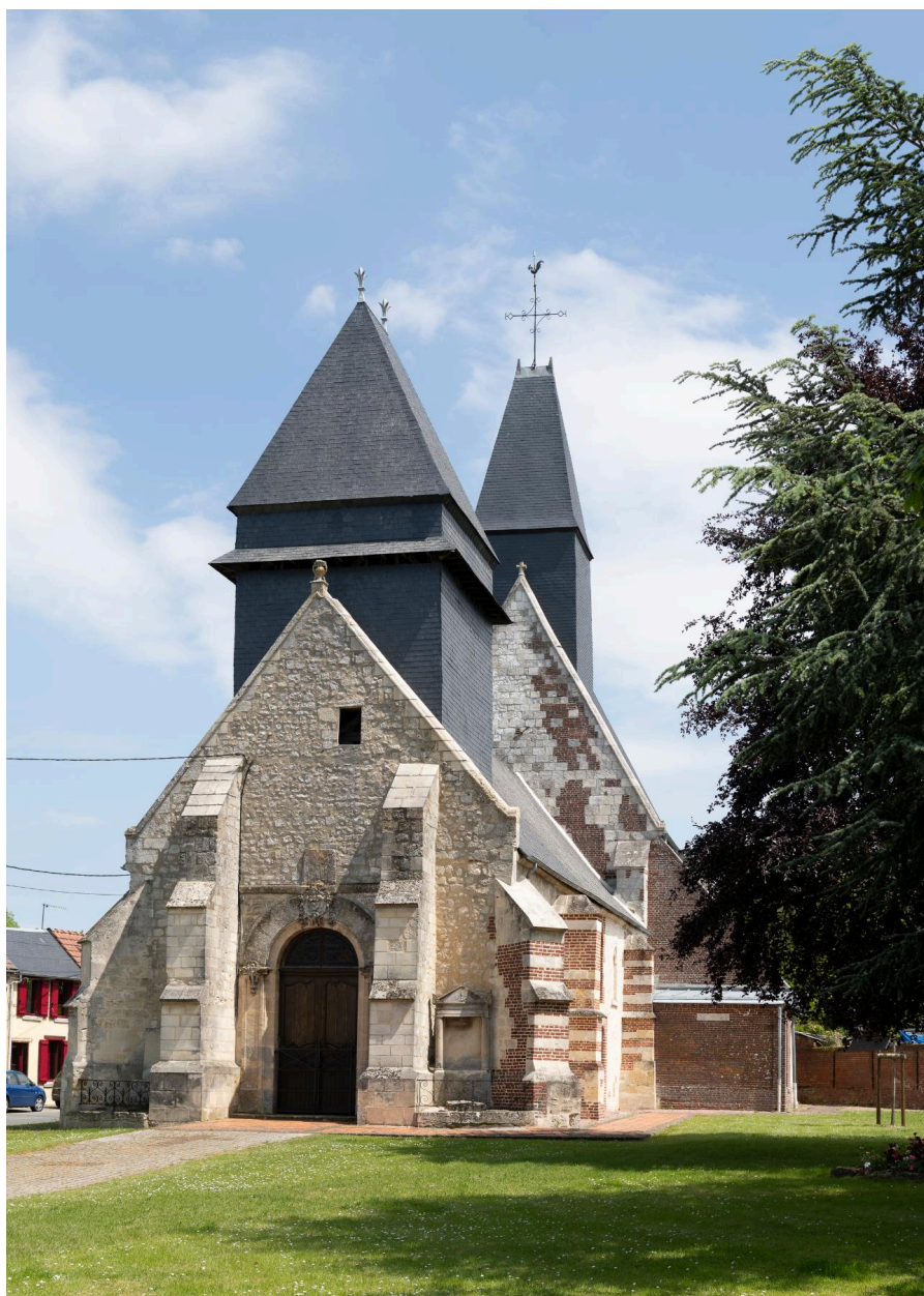
Façade occidentale de l'église.