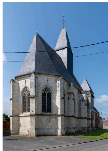
Chevet.