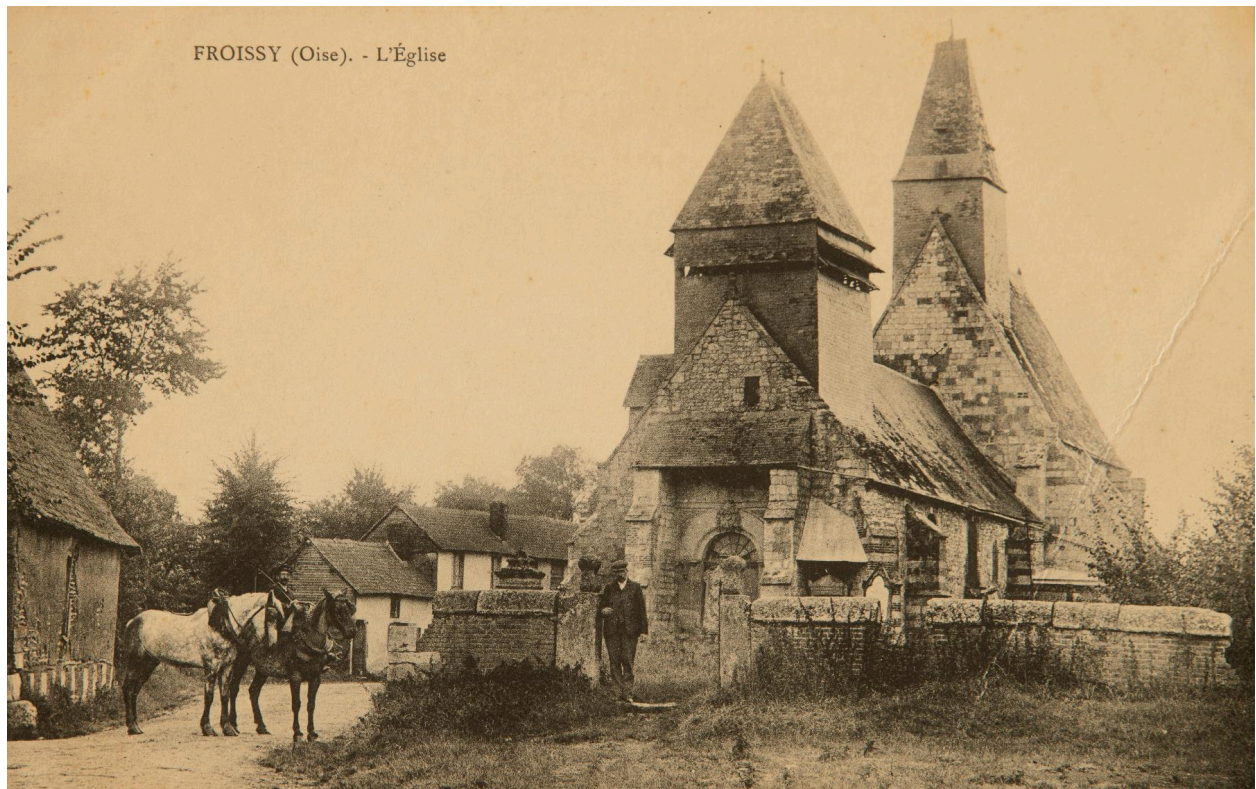
Froissy (Oise). L'église, carte postale, [premier quart du XXe siècle].