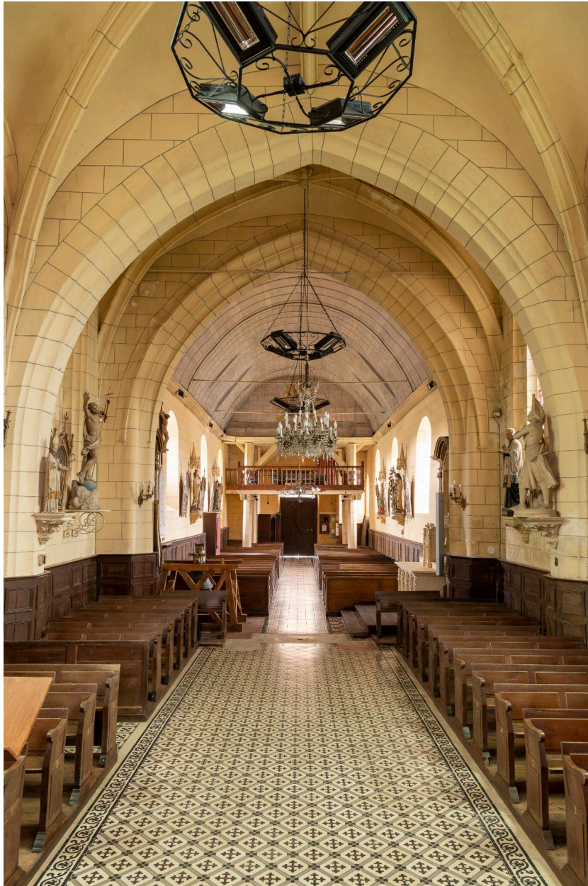
Vue générale vers la nef.