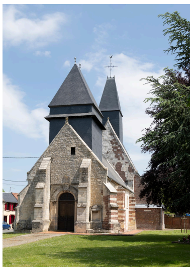
Façade occidentale de l'église. IVR32_20236000702NUCA