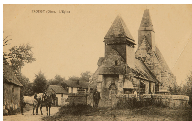
Froissy (Oise). L'église, carte postale, [premier quart du XXe siècle] IVR32_20236000043NUCA