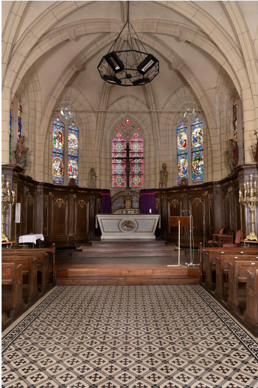
Vue générale du chœur.