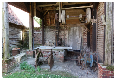
Détail du mécanisme de pompage du puits. IVR32_20226005076NUCA