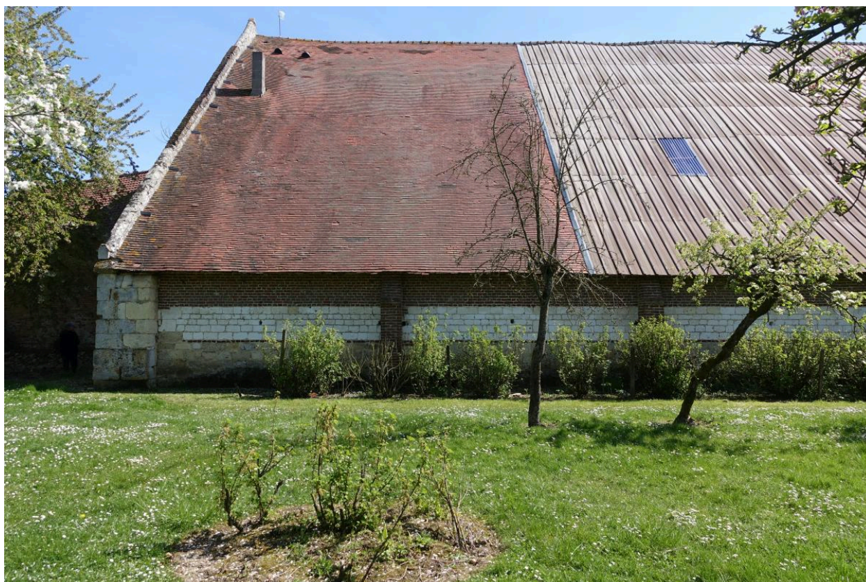
Vue générale de la partie nord-est de la grange.