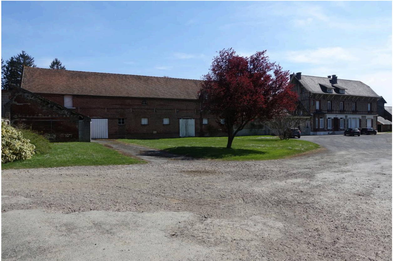
Vue générale depuis le nord des écuries et du logis de la ferme implantée au sud de la grange.