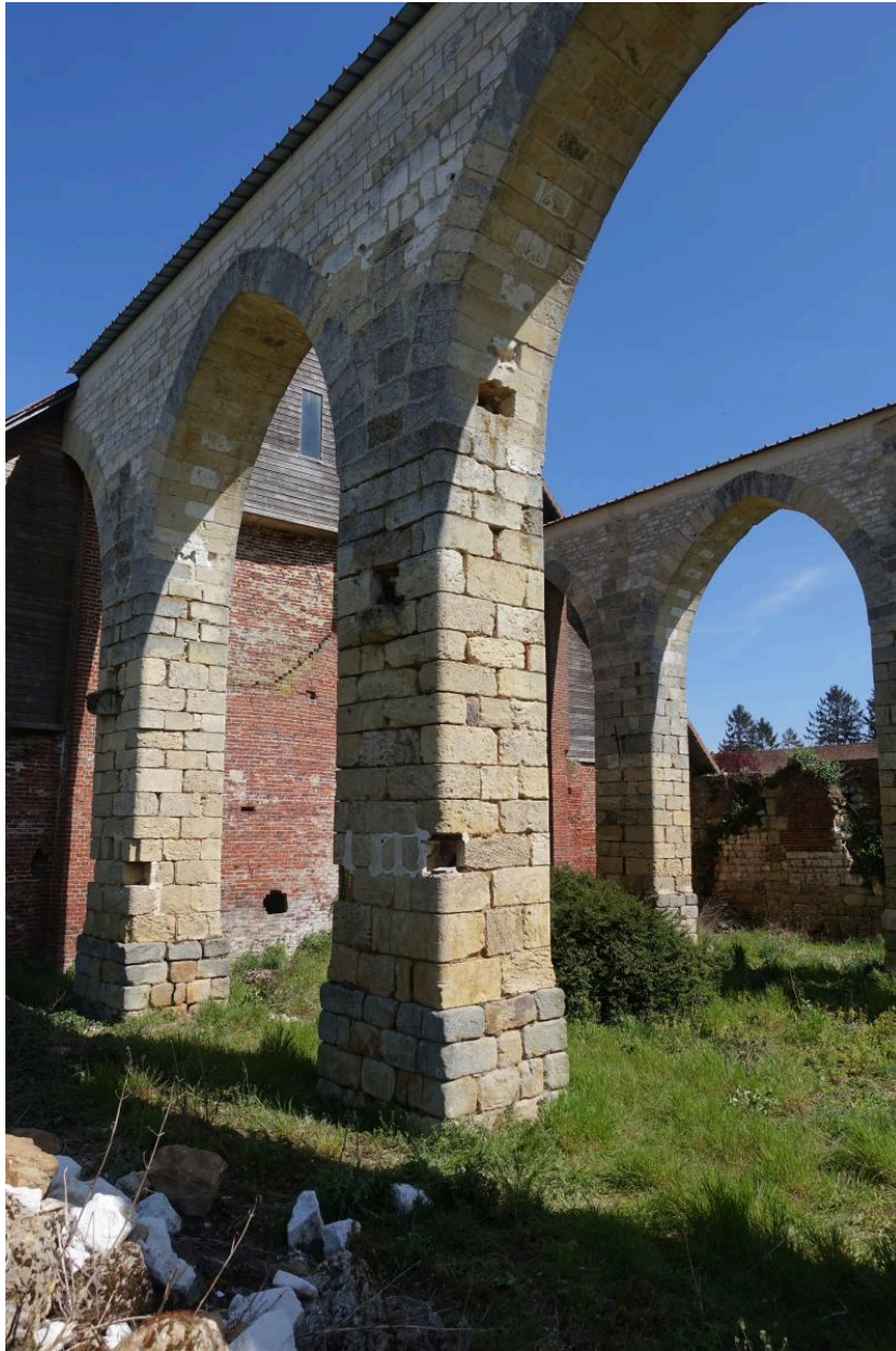
Vue rapprochée depuis le nord-ouest : piliers et arcades.