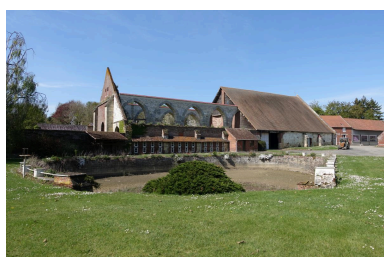
Vue générale du côté sud de la grange.