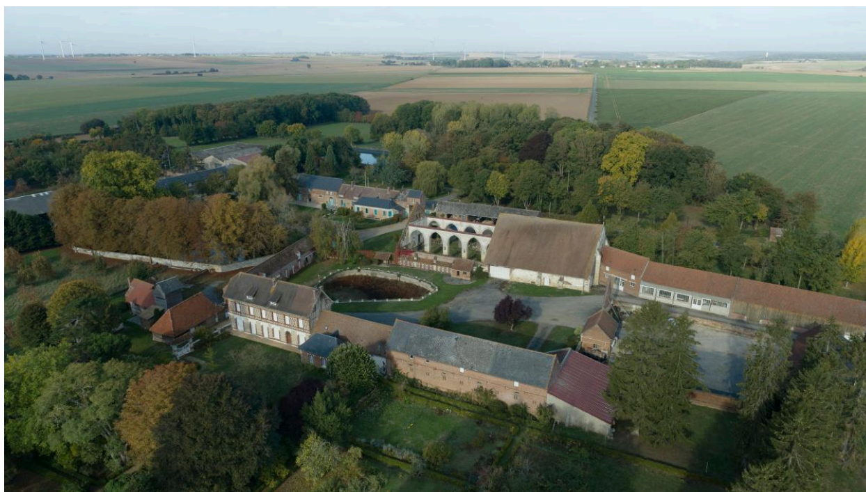
Vue aérienne des fermes depuis le sud-est.