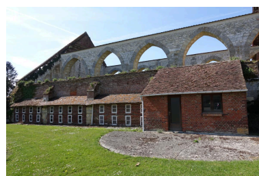
Partie ouest de la grange et clapiers, vue depuis le sud. IVR32_20226005078NUCA