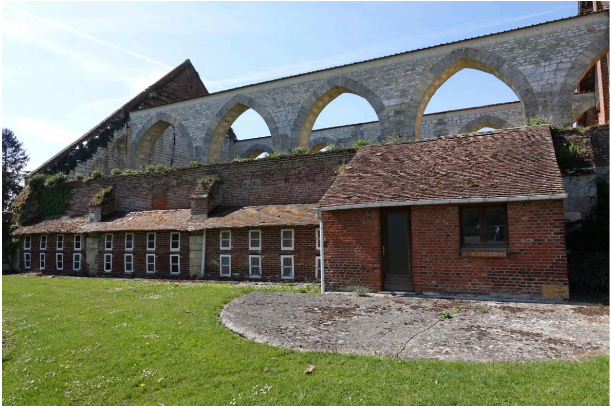
Partie ouest de la grange et clapiers, vue depuis le sud.