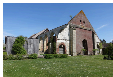
Vue générale de la grange médiévale depuis le nord-ouest.