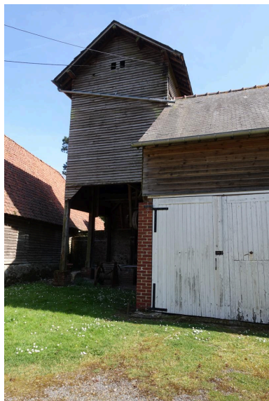
Puits surmonté d'une citerne, vue depuis le nord.