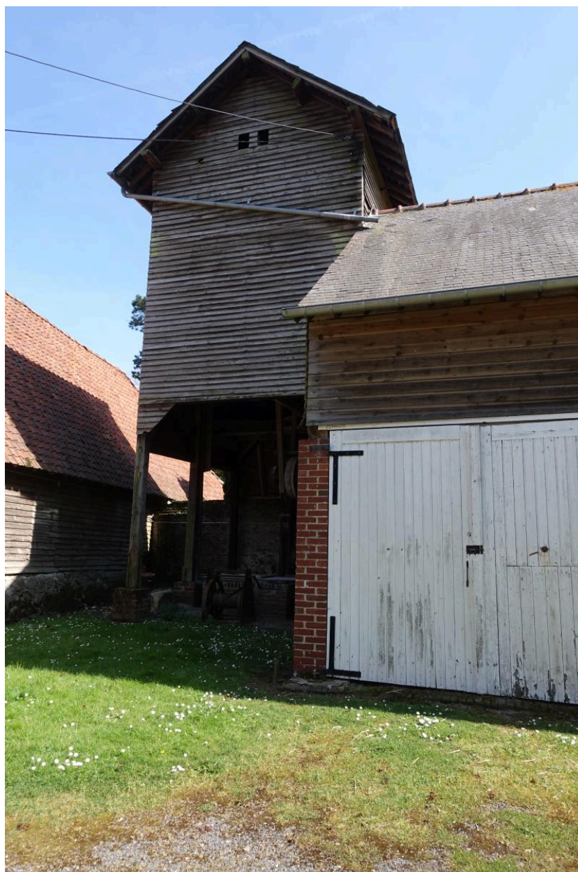
Puits surmonté d'une citerne, vue depuis le nord.