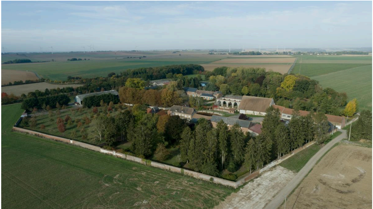
Vue aérienne de l'emprise parcellaire de la grange depuis le sud-est.