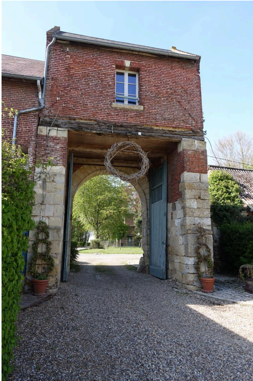
Vue générale de la porterie depuis l'intérieur de la cour (sud-est).