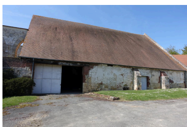
Partie est de la grange, vue depuis le sud. IVR32_20226005080NUCA