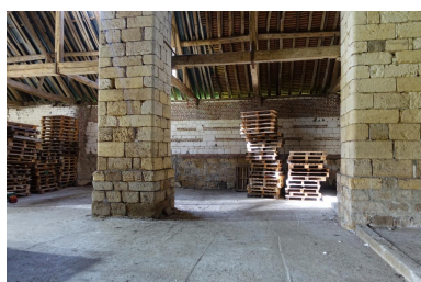
Piliers. IVR32_20226005083NUCA