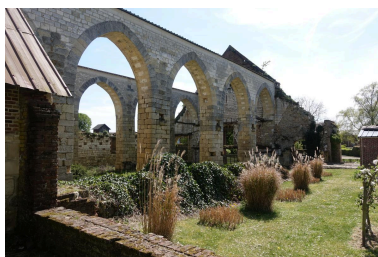
Vue de la grange depuis le nord-est. IVR32_20226005071NUCA