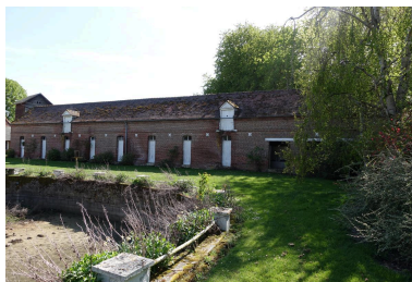
Anciennes porcheries, vue depuis le nord-est. IVR32_20226005079NUCA