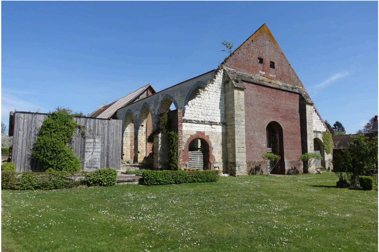
Vue générale de la grange médiévale depuis le nord-ouest.