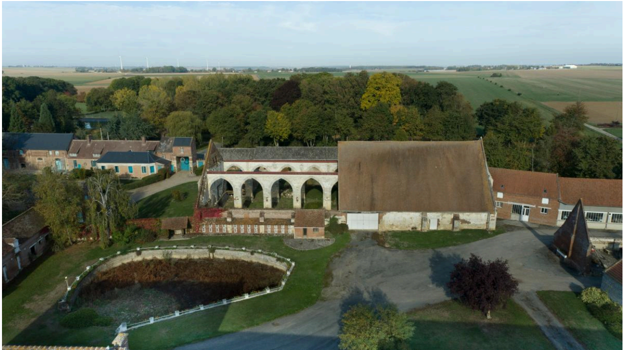
Vue aérienne de la grange depuis le sud.