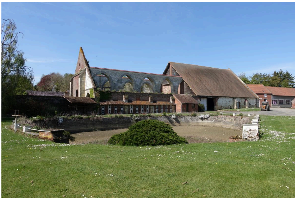
Vue générale du côté sud de la grange.