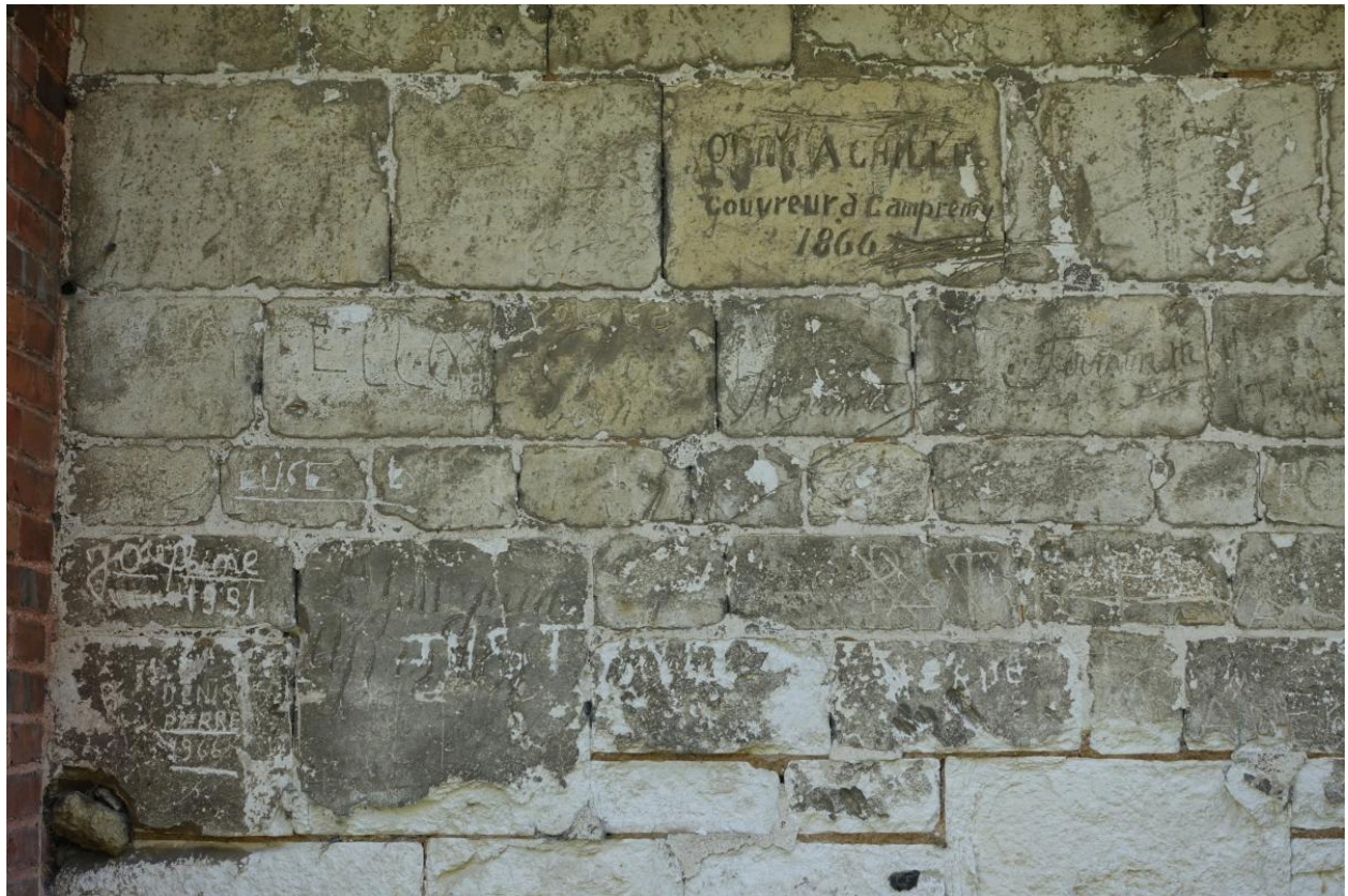
Mur nord gravé de la signature du couvreur Achille Obry.