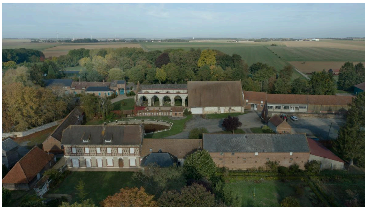
Vue aérienne de la grange médiévale depuis le jardin de la ferme côté sud.