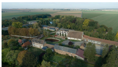
Vue aérienne des fermes depuis le sud-est. IVR32_20226001090NUCA