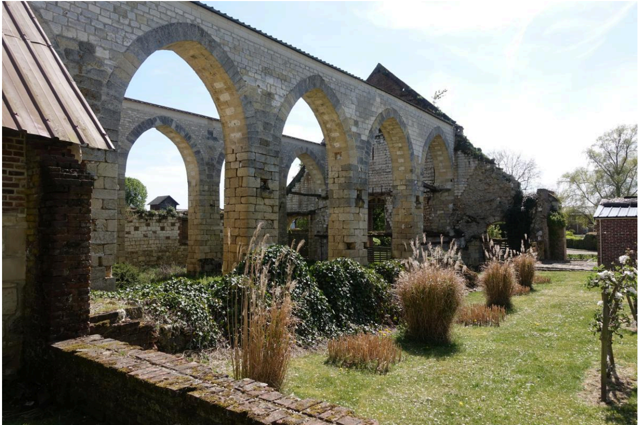
Vue de la grange depuis le nord-est.