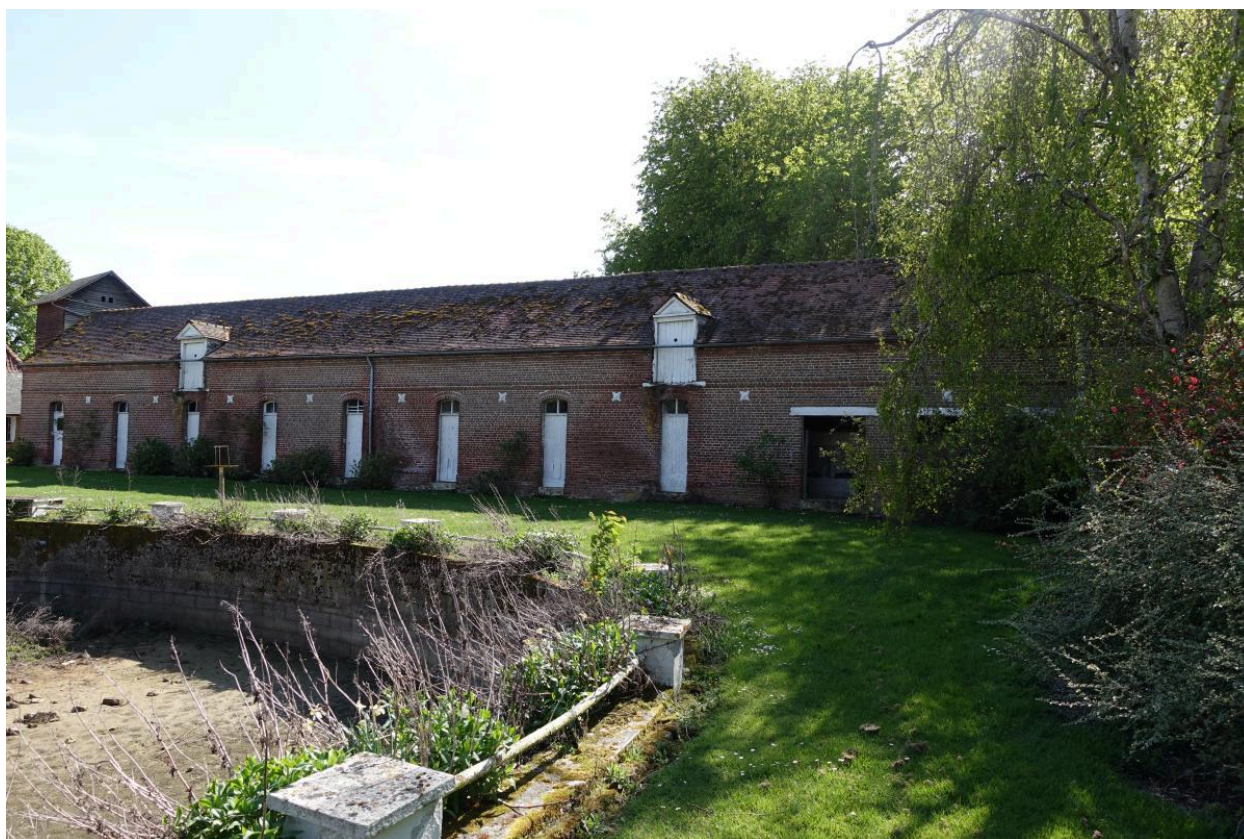
Anciennes porcheries, vue depuis le nord-est.