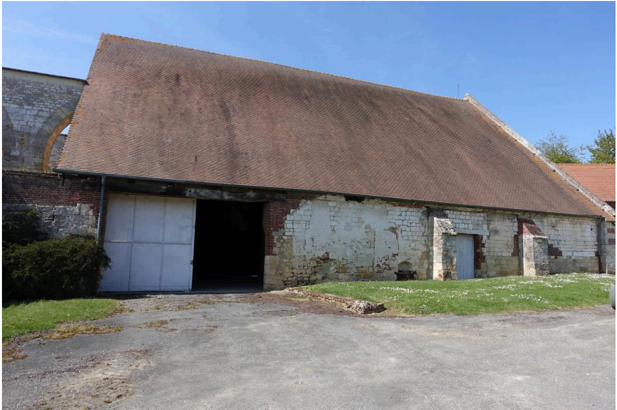
Partie est de la grange, vue depuis le sud.