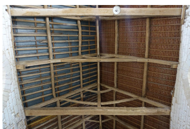
Charpente. IVR32_20226005082NUCA