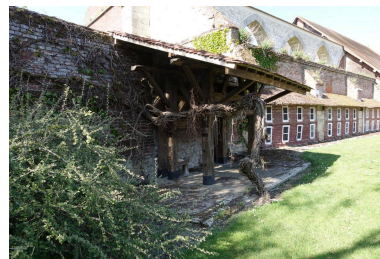
Travail à ferrer les bœufs, vue depuis le sud. IVR32_20226005077NUCA