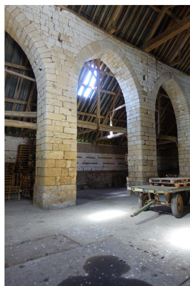
Vue intérieure de la partie est de la grange : grandes arcades. IVR32_20226005081NUCA