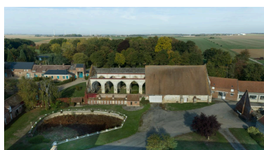
Vue aérienne de la grange depuis le sud. IVR32_20226001092NUCA