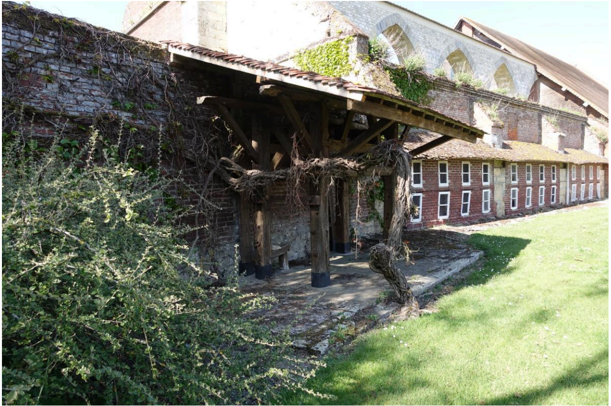
Travail à ferrer les bœufs, vue depuis le sud.