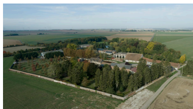
Vue aérienne de l'emprise parcellaire de la grange depuis le sud-est. IVR32_20226001089NUCA