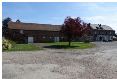
Vue générale depuis le nord des écuries et du logis de la ferme implantée au sud de la grange.