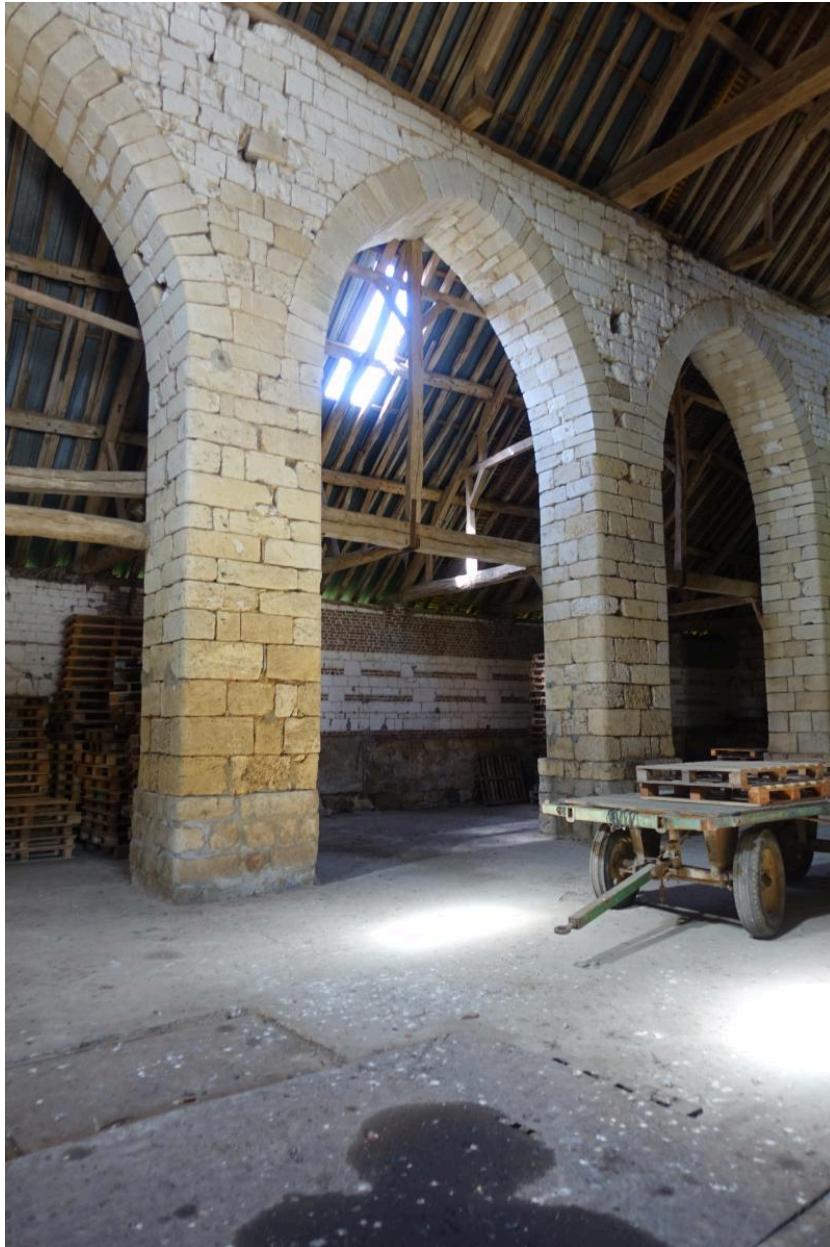
Vue intérieure de la partie est de la grange : grandes arcades.