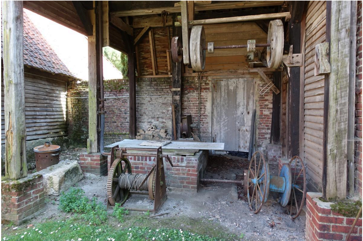
Détail du mécanisme de pompage du puits.