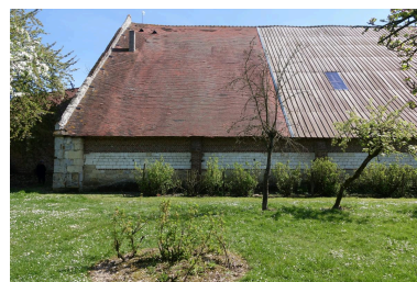
Vue générale de la partie nord-est de la grange. IVR32_20226005072NUCA