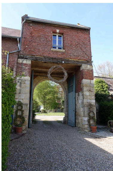
Vue générale de la porterie depuis l'intérieur de la cour (sud-est).