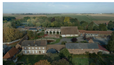
Vue aérienne de la grange médiévale depuis le jardin de la ferme côté sud.