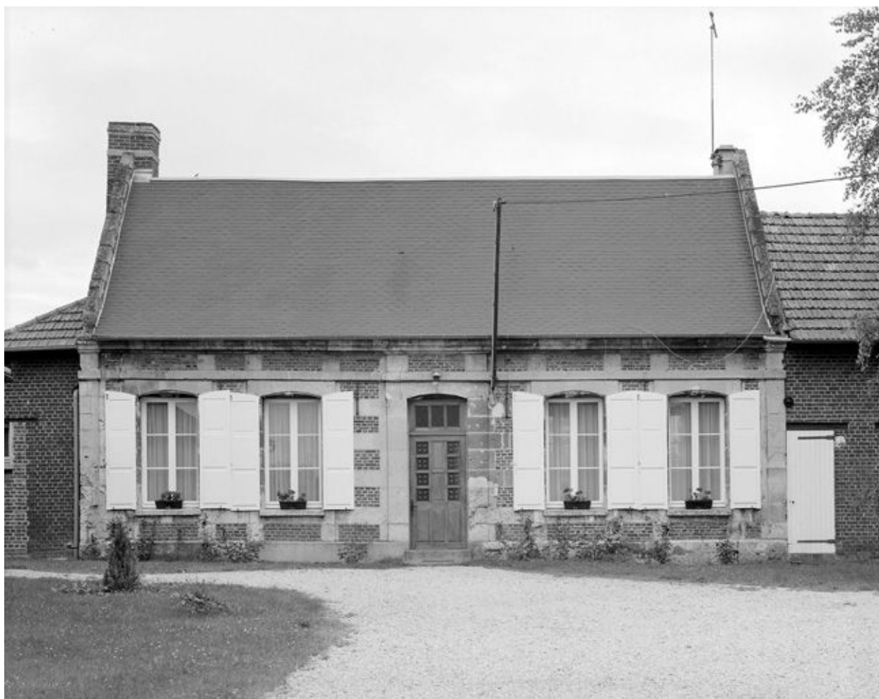
Logis. Elévation antérieure.