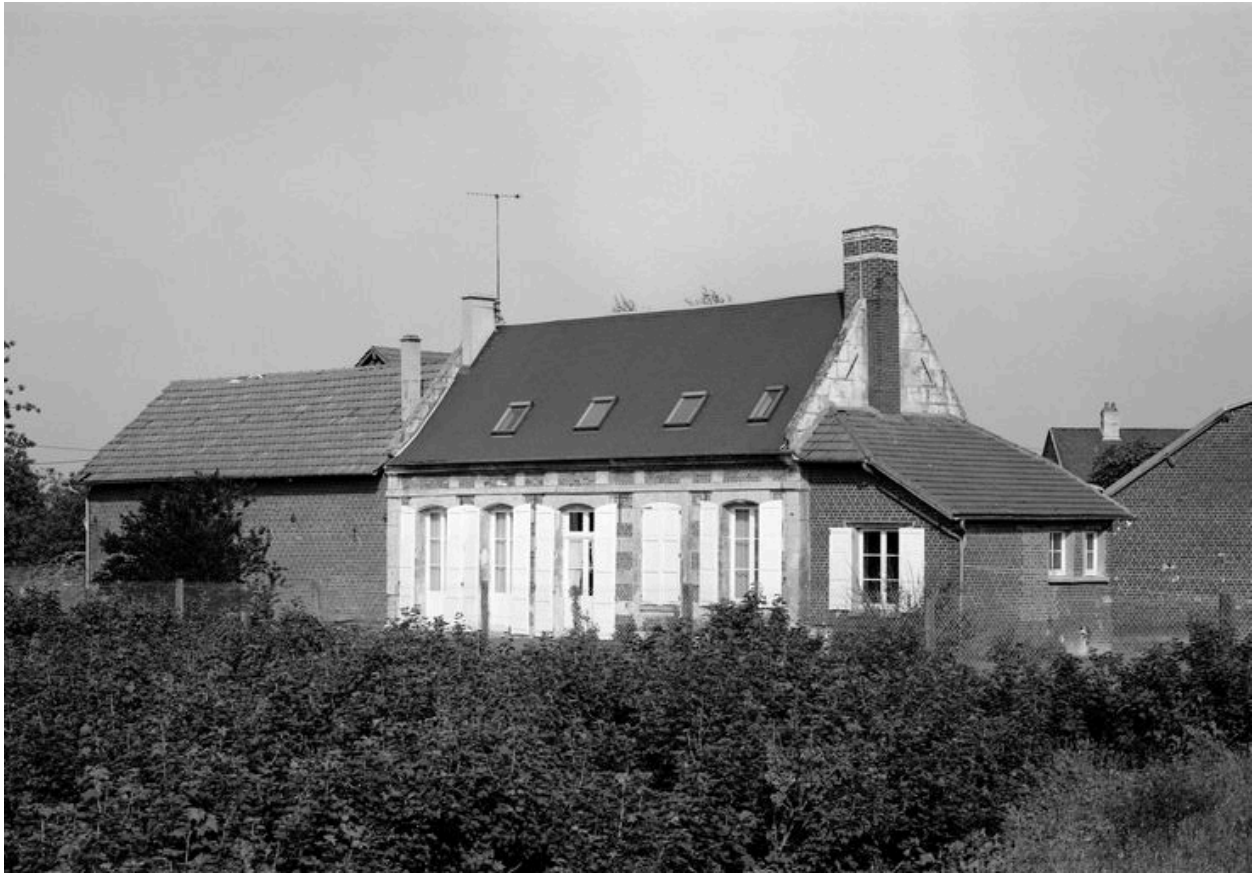
Logis. Elévation postérieure.