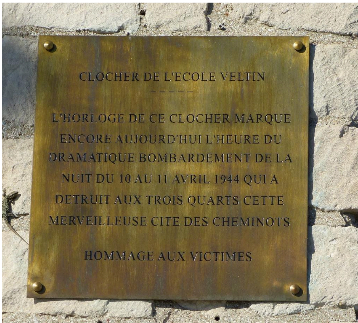
Plaque fixée à l'entrée du bâtiment.