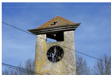
Détail de l'horloge arrêtée à l'heure du bombardement de la ville. IVR32_20170200151NUC2A