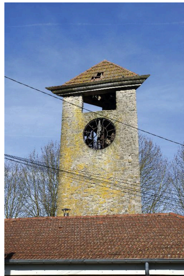
Détail du clocher de l'école. IVR32_20170200152NUC2A