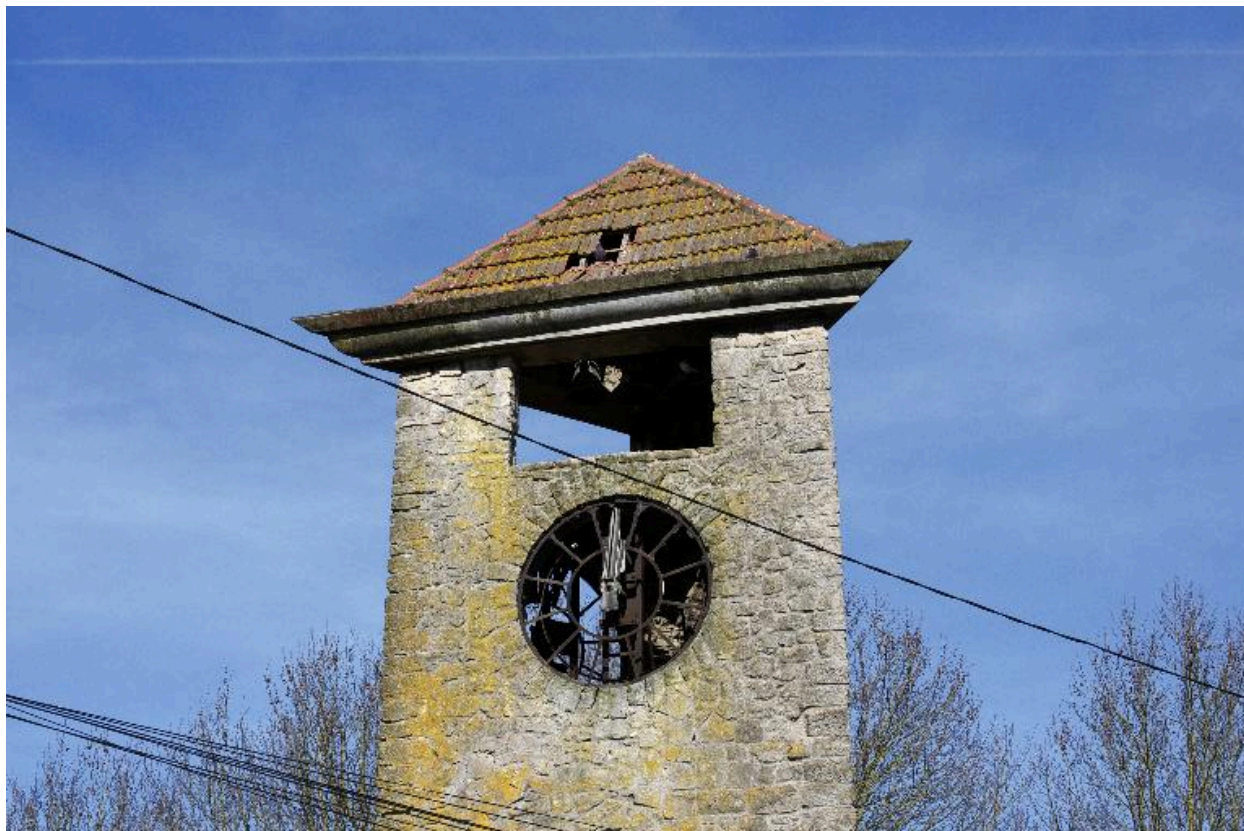
Détail de l'horloge arrêtée à l'heure du bombardement de la ville.