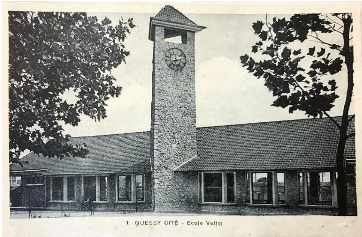
Ecole Veltin, carte postale, vers 1930.