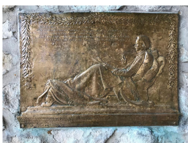
Bas-relief du sculpteur Augustus Saint-Gaudens. IVR32_20210205196NUCA