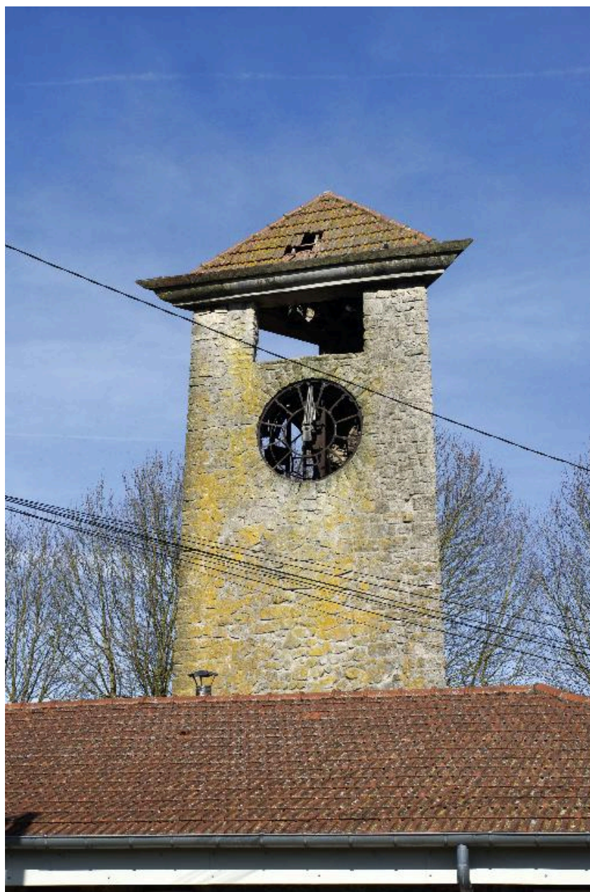
Détail du clocher de l'école.