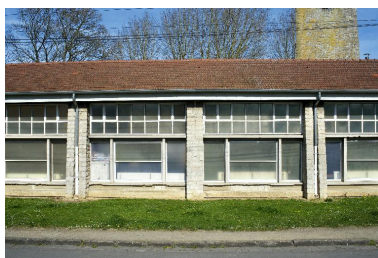
Détail de deux travées de la façade sud. IVR32_20170200153NUC2A