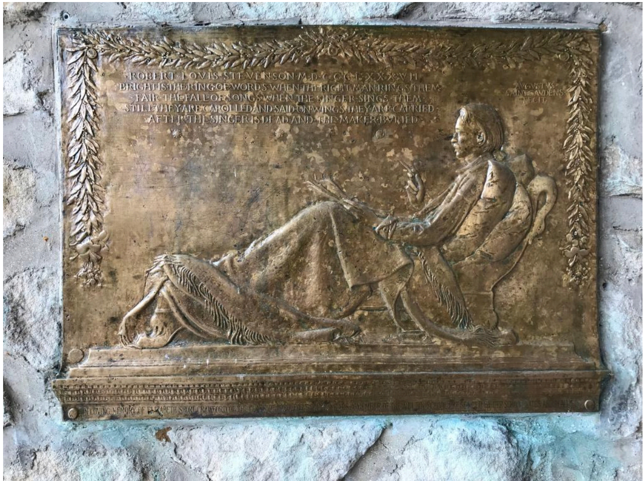
Bas-relief du sculpteur Augustus Saint-Gaudens.