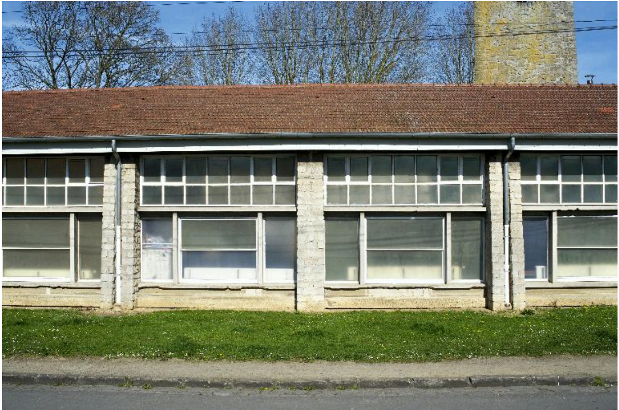
Détail de deux travées de la façade sud.