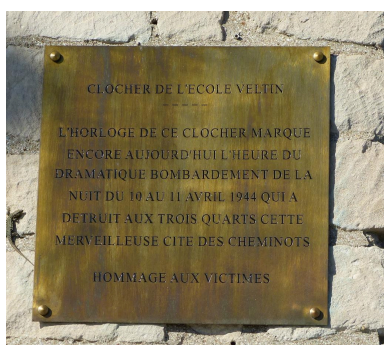
Plaque fixée à l'entrée du bâtiment. IVR32_20220205058NUCA