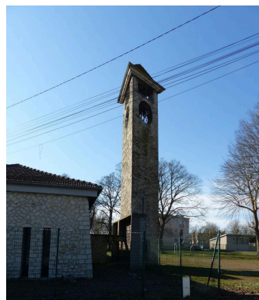
Le clocher isolé après la reconstruction de l'école.