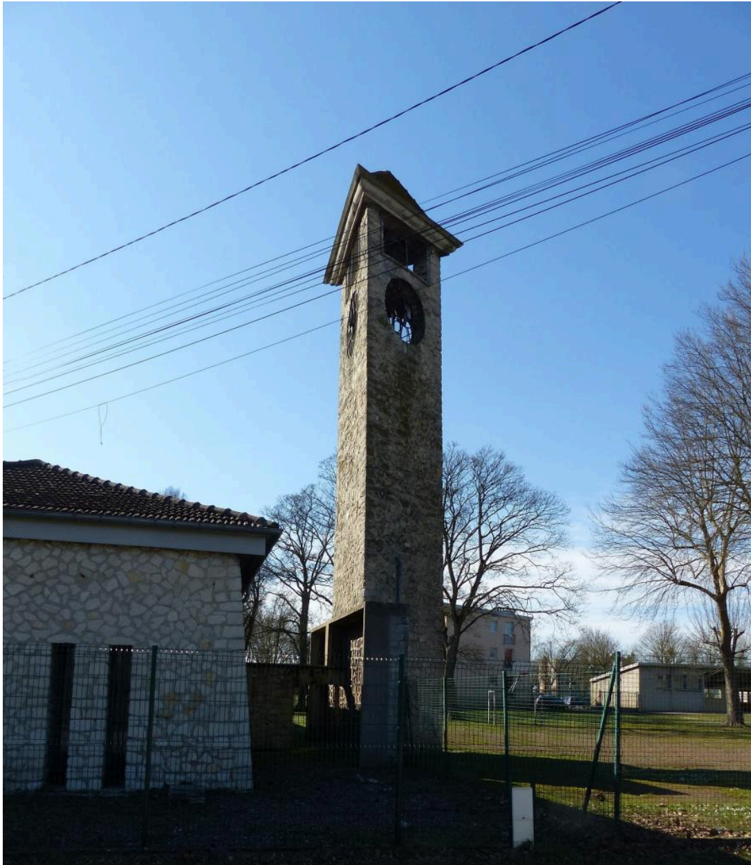
Le clocher isolé après la reconstruction de l'école.