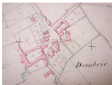
Plan de situation, cadastre de 1885.