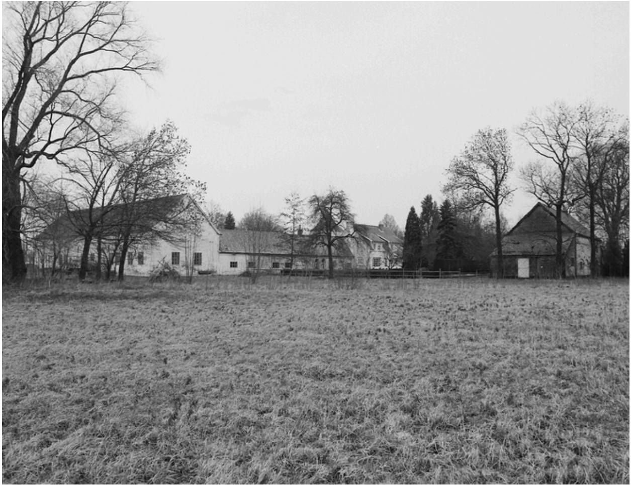
Vue générale postérieure et le chartil.