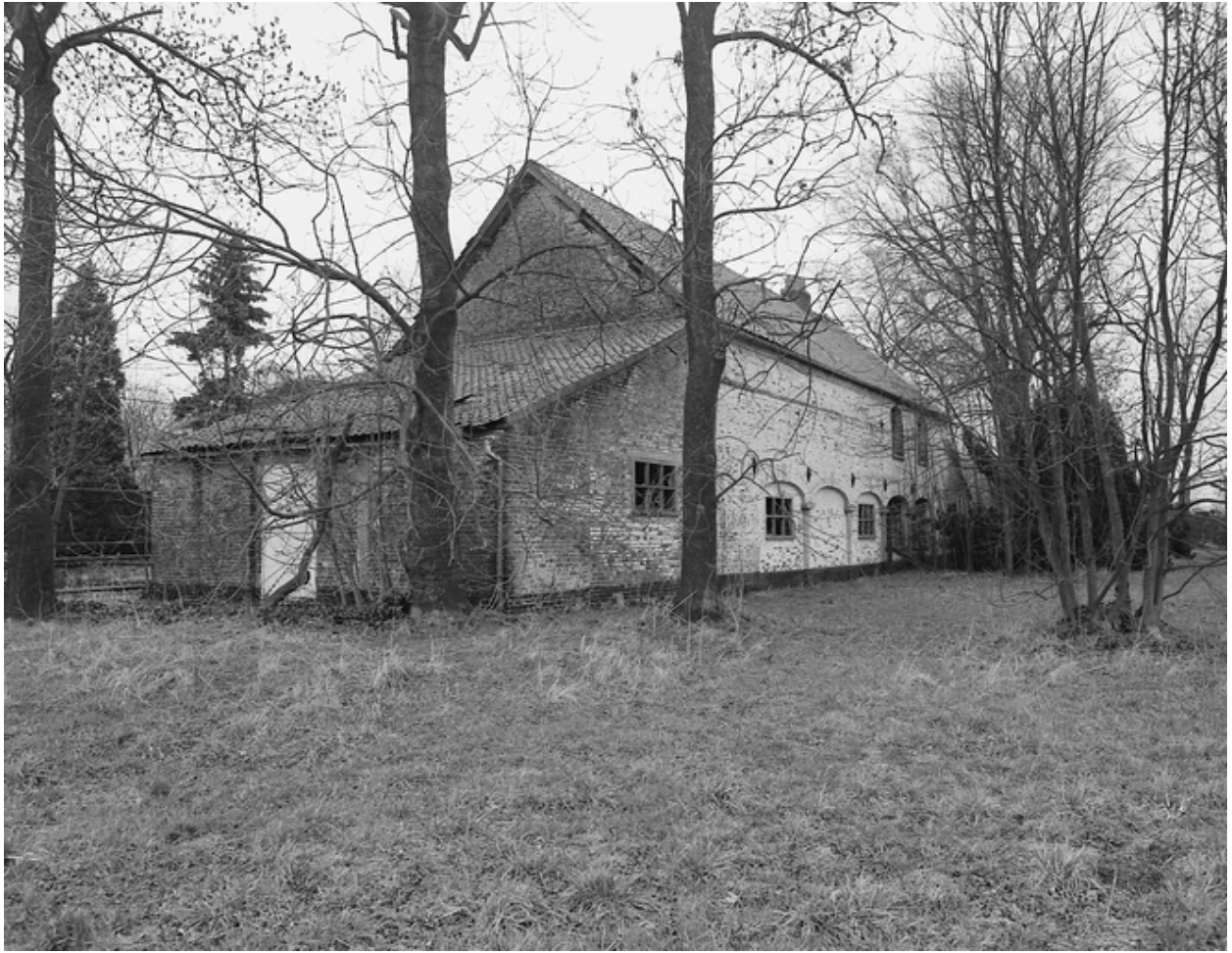
Vue générale du chartil.