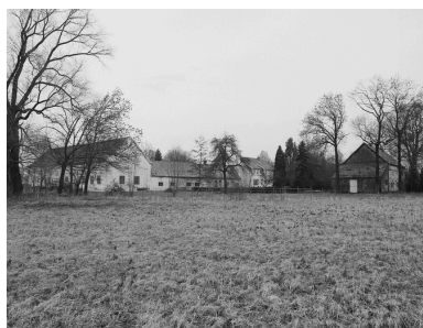
Vue générale postérieure et le chartil. IVR31_20045900050X