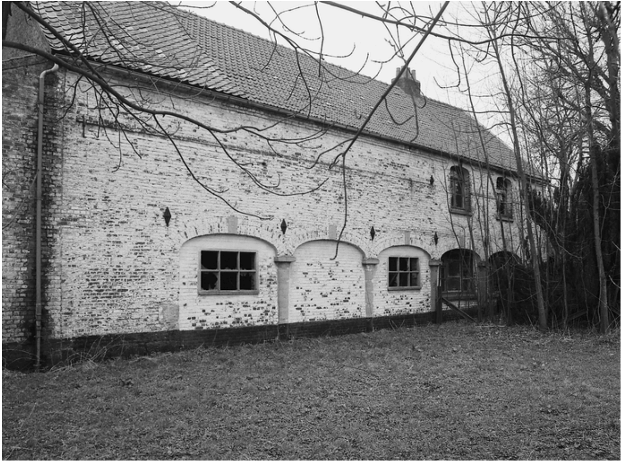
Les travées du chartil.