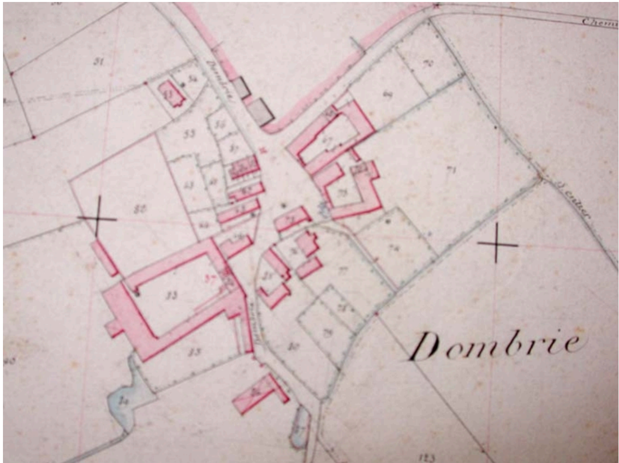
Plan de situation, cadastre de 1885 (AD Nord P31/598).