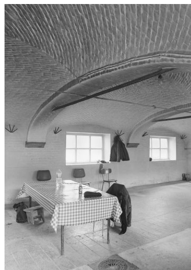
Vue intérieure des écuries.