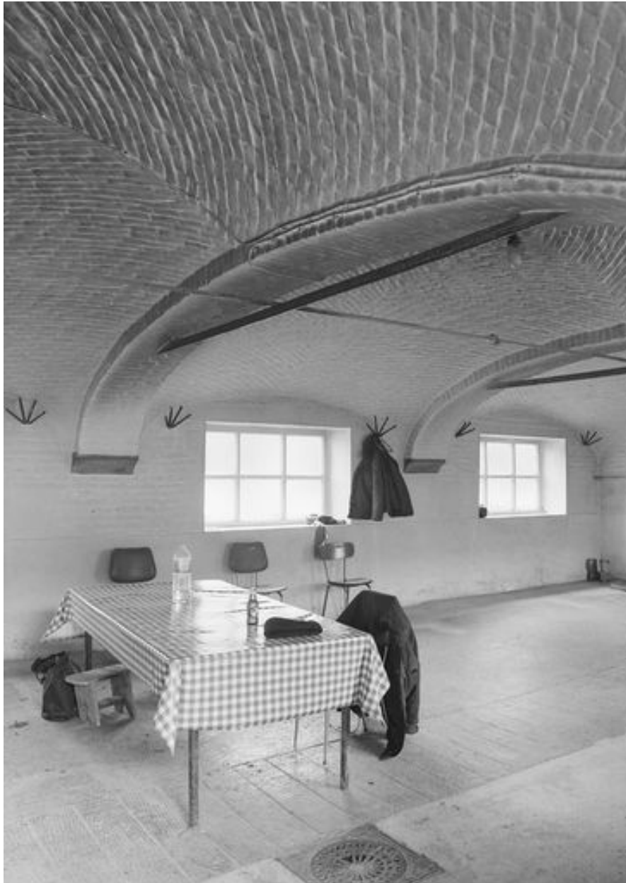
Vue intérieure des écuries.