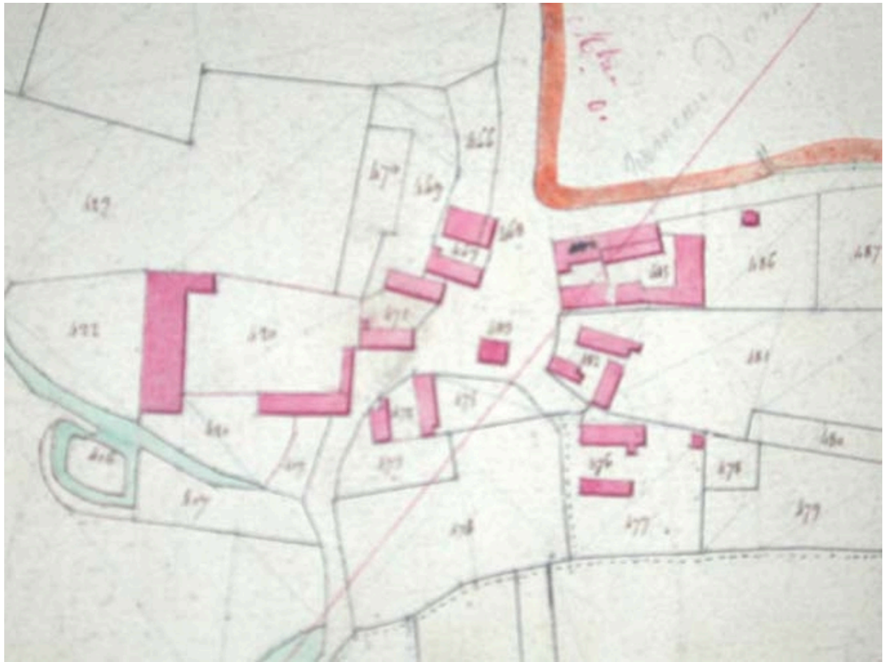
Plan de situation, cadastre de 1821 (AD Nord P31/598).