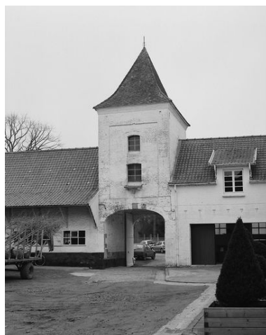
Le pigeonnier-porche depuis la cour. IVR31_20045900032X