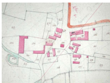
Plan de situation, cadastre de 1821 (AD Nord P31/598). IVR31_20045905470NUCA