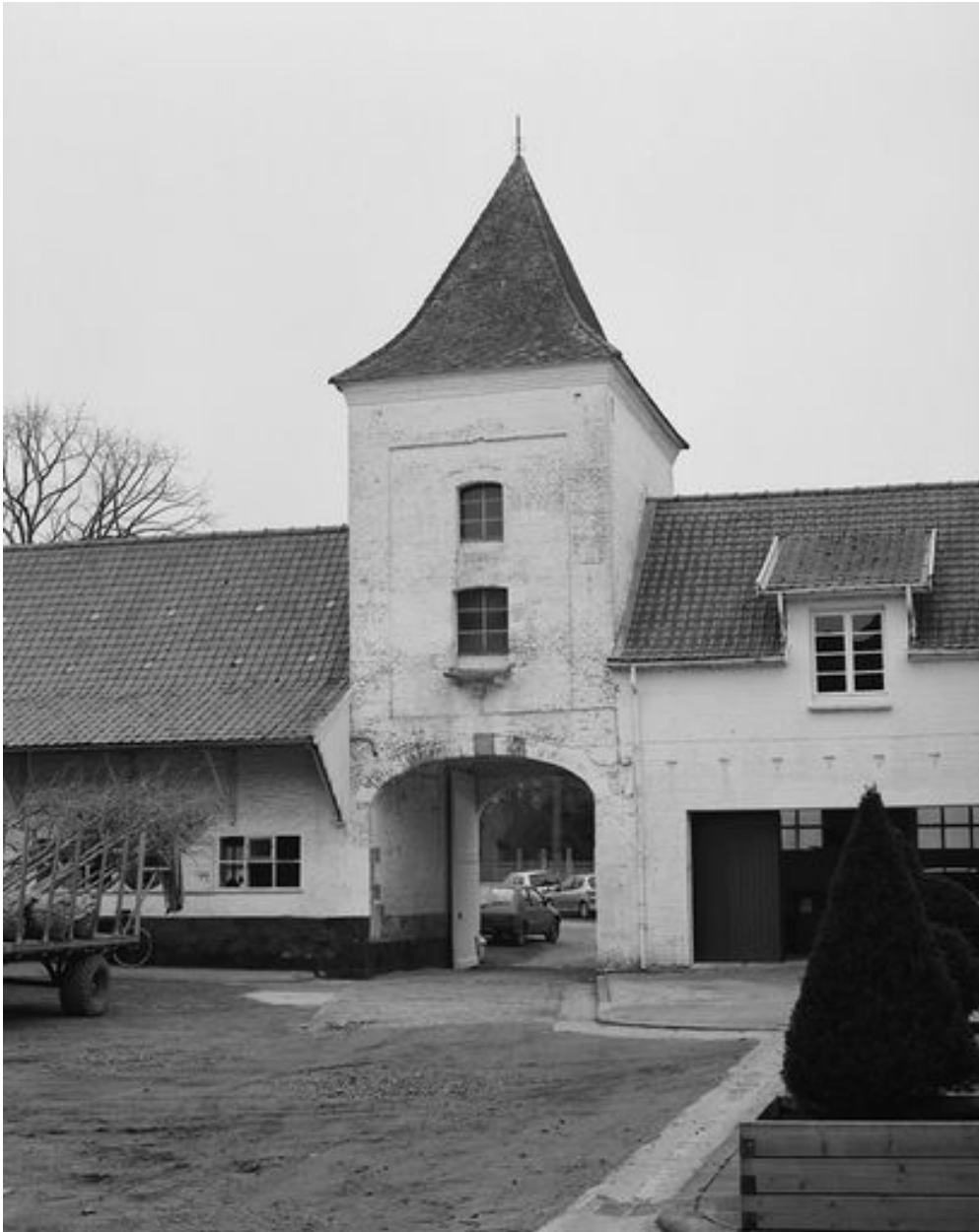
Le pigeonier-porche depuis la cour.