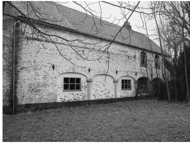
Les travées du chartil. IVR31_20045900048X