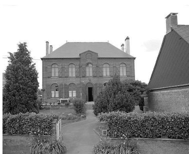
Vue générale.