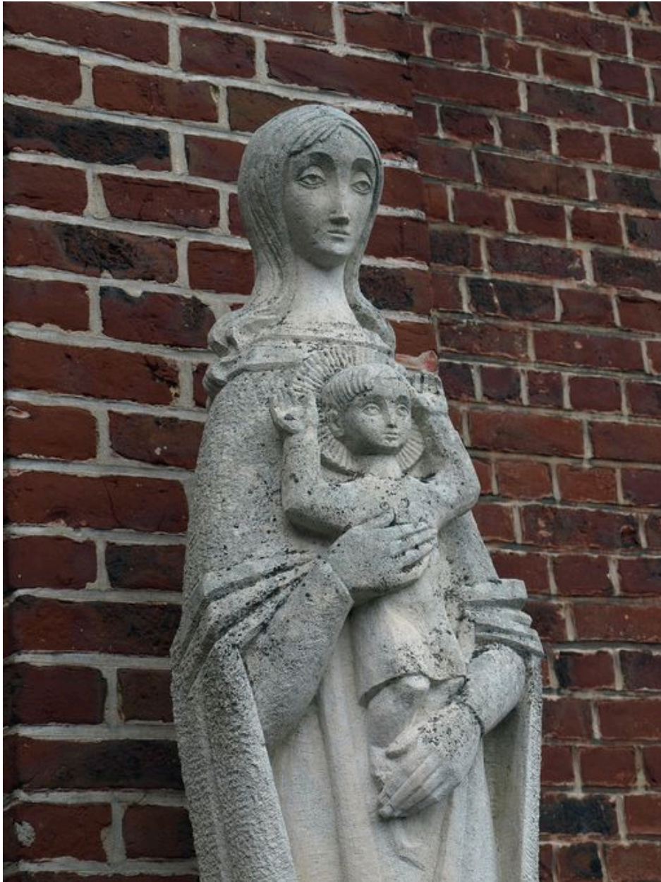
Vue partielle : Vierge à l'Enfant