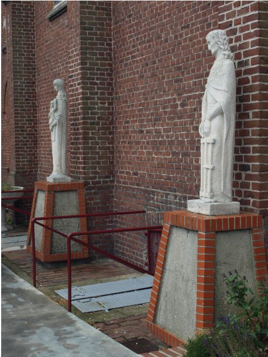
Vue générale : vue d'ensemble des deux statues