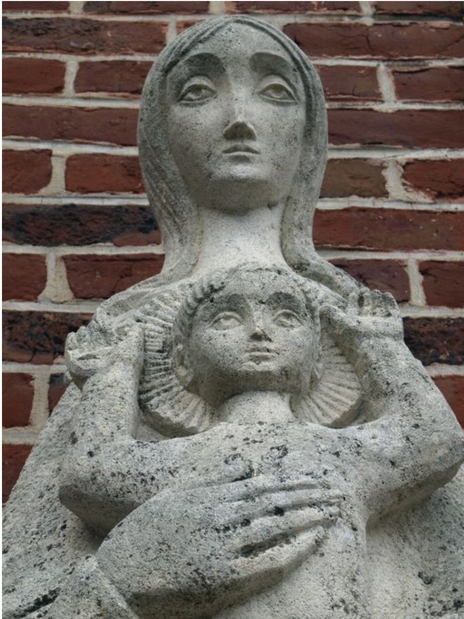
Vue de détail : Vierge à l'Enfant, buste