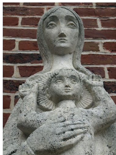
Vue de détail : Vierge à l'Enfant, buste IVR31_20106204019NUCA