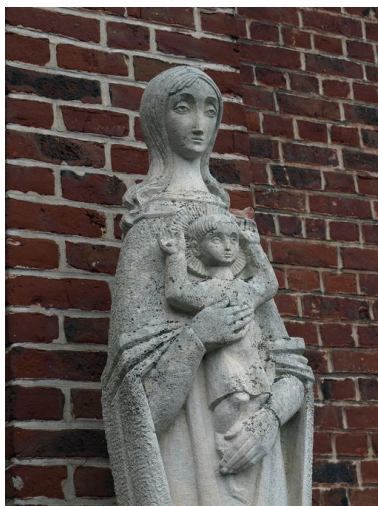
Vue partielle : Vierge à l'Enfant IVR31_20106204018NUCA