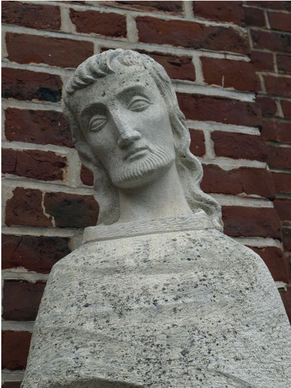
Vue partielle : saint Joseph, buste