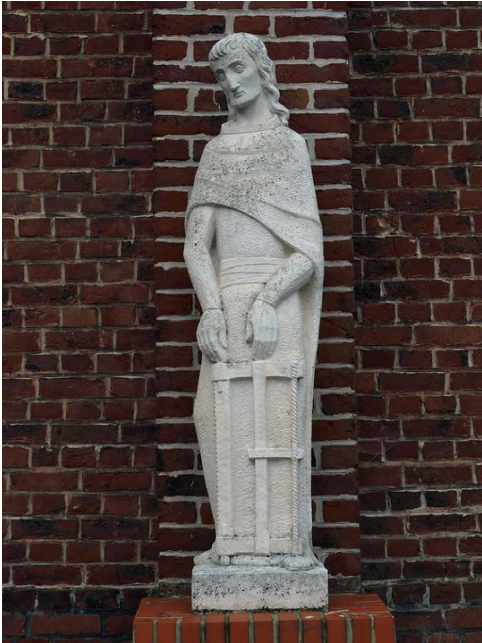
Vue générale : saint Joseph