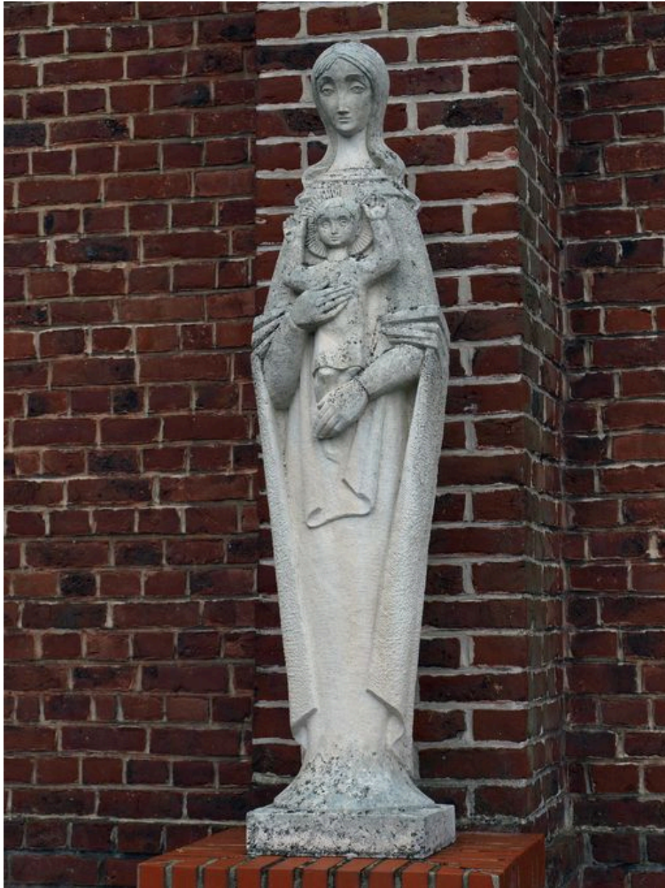
Vue générale : Vierge à l'Enfant