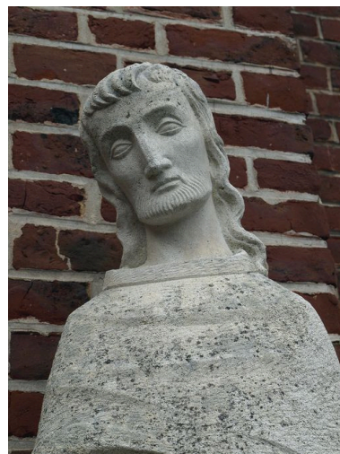
Vue partielle : saint Joseph, buste IVR31_20106204016NUCA