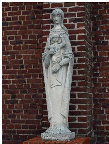
Vue générale : Vierge à l'Enfant IVR31_20106204017NUCA