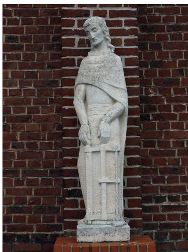
Vue générale : saint Joseph IVR31_20106204015NUCA