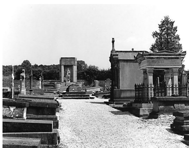
Vue de l'allée centrale.