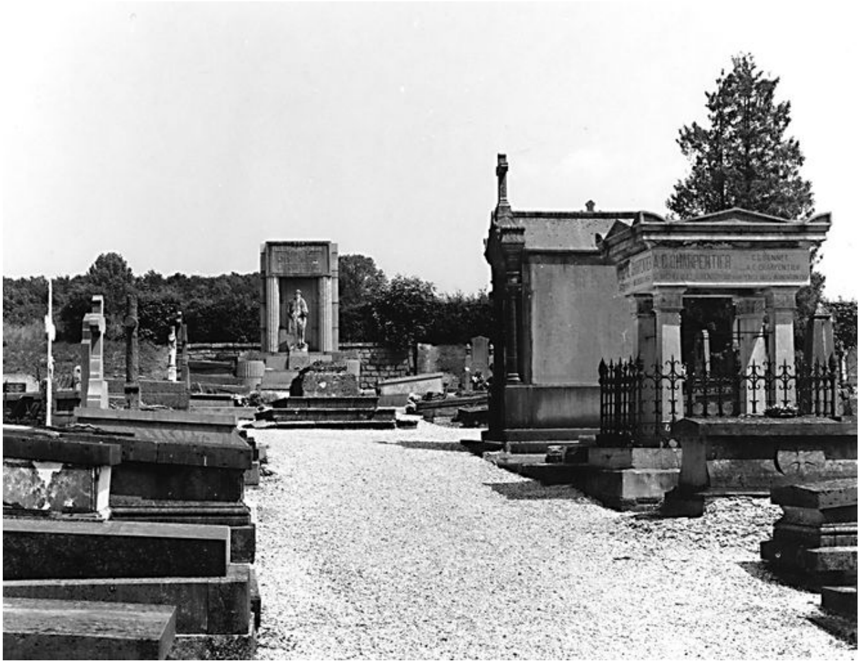
Vue de l'allée centrale.