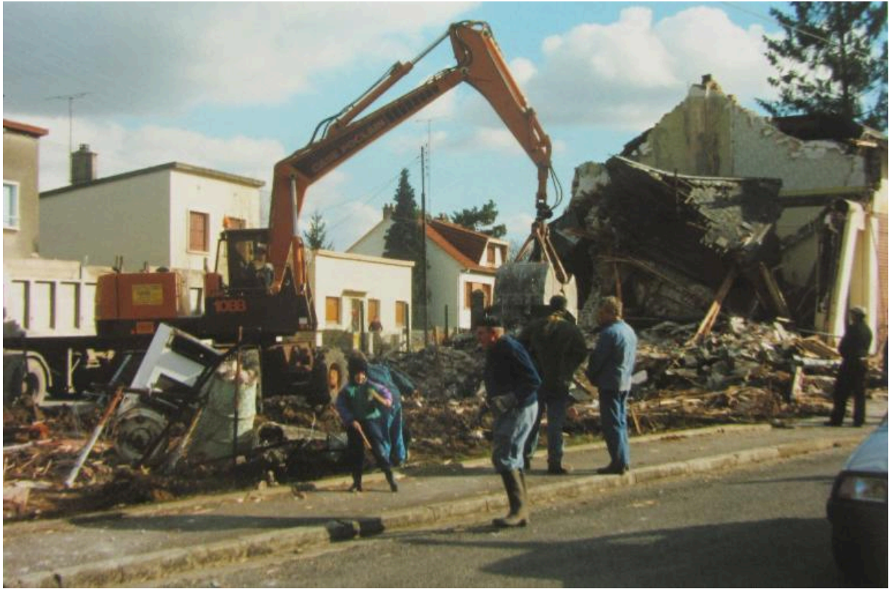
Démolition du magasin coopératif en 1990.