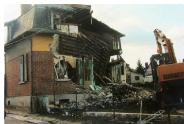
Démolition du magasin coopératif en 1990.