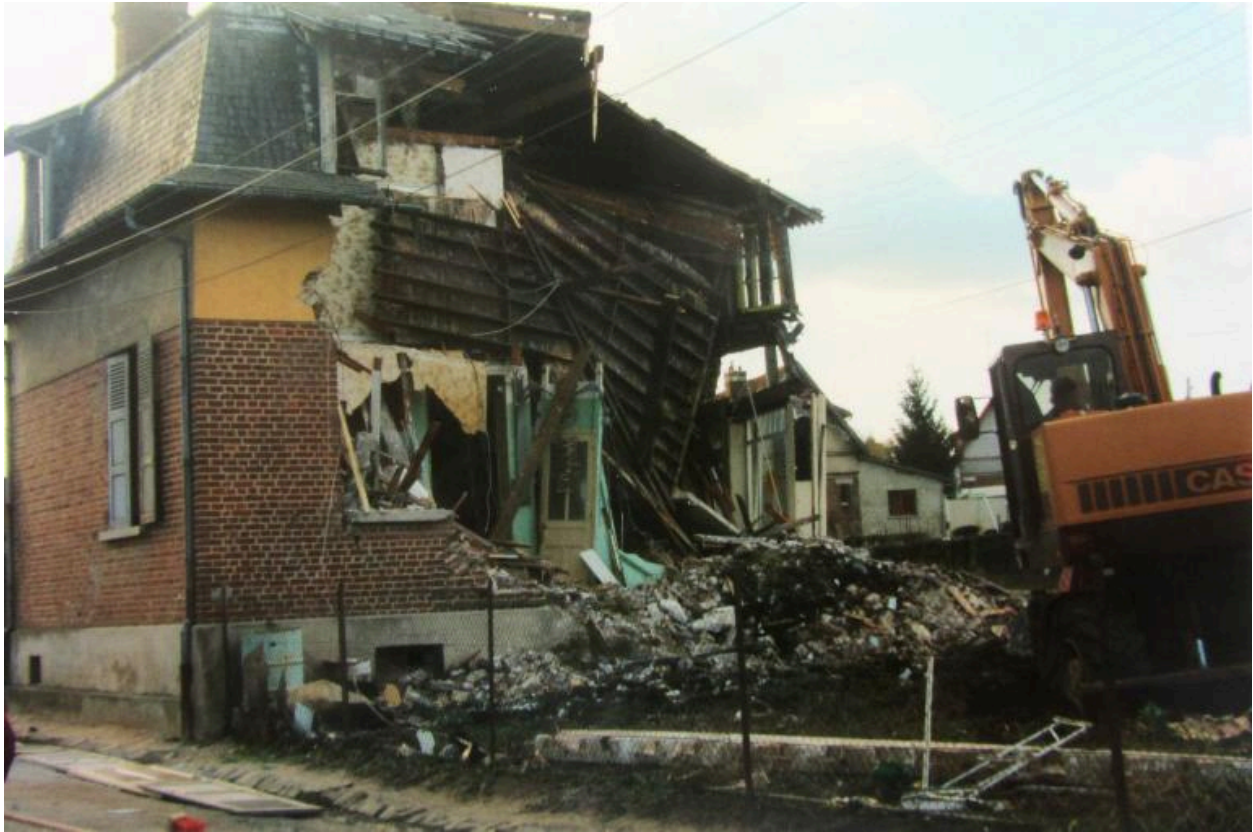
Démolition du magasin coopératif en 1990.