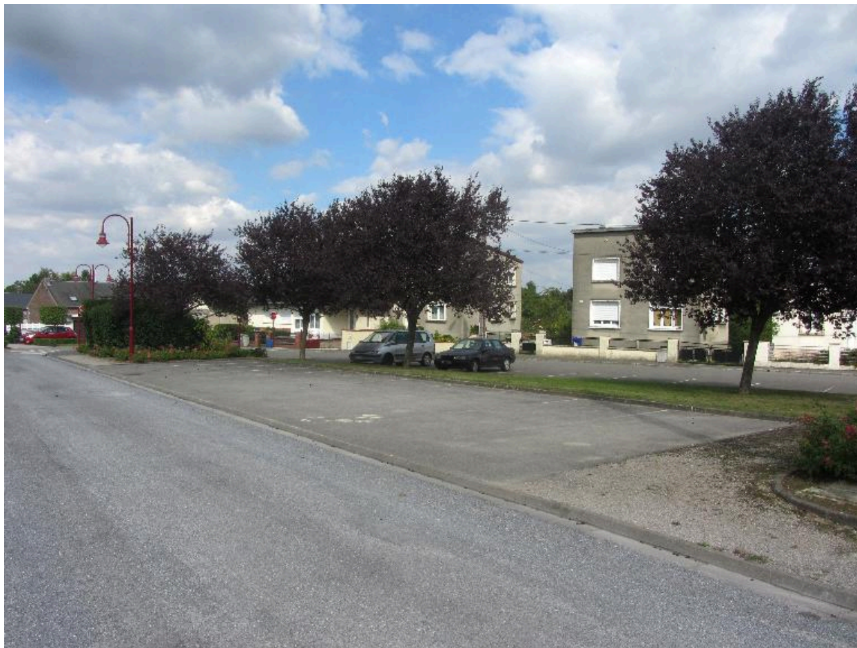
Vue actuelle de l'emplacement où se trouvait le magasin coopératif.