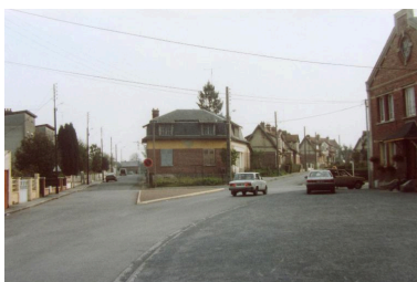
Magasin coopératif avant sa démolition en 1990.