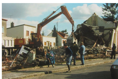
Démolition du magasin coopératif en 1990 (coll. part.).