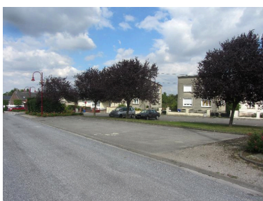
Vue actuelle de l'emplacement où se trouvait le magasin coopératif.