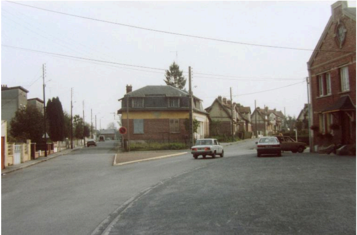
Magasin coopératif avant sa démolition en 1990.