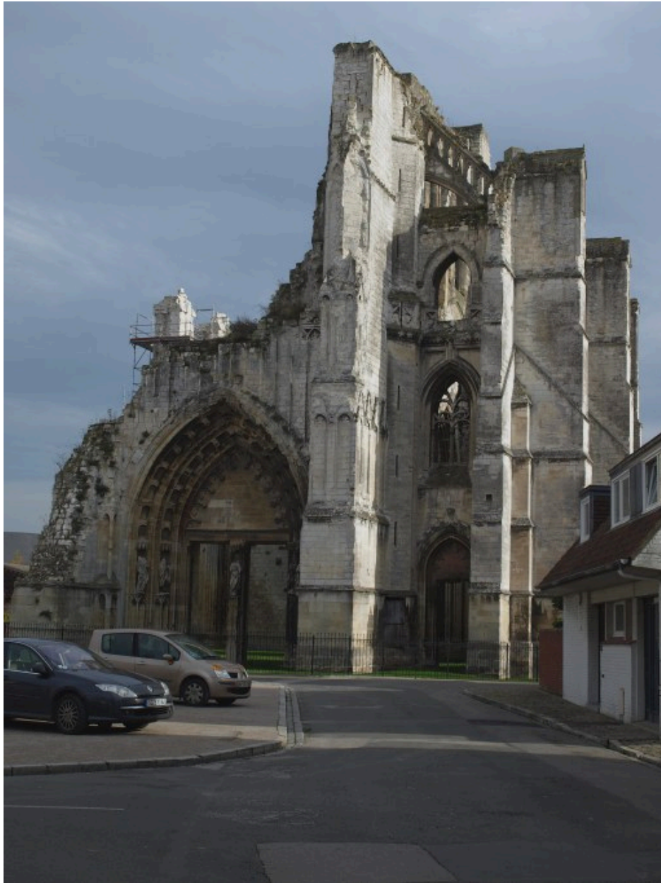
Vue générale de la façade ouest