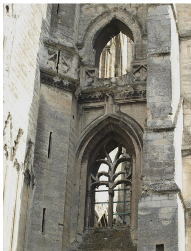
Baies ouest du bas-côté sud IVR31_20106202260NUCA