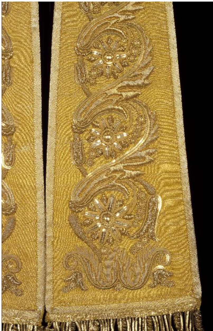
Détail du décor brodé d'un des fanons.