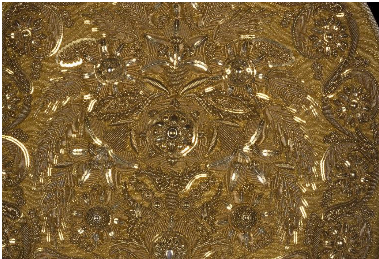
Détail du drap d'or brodé.