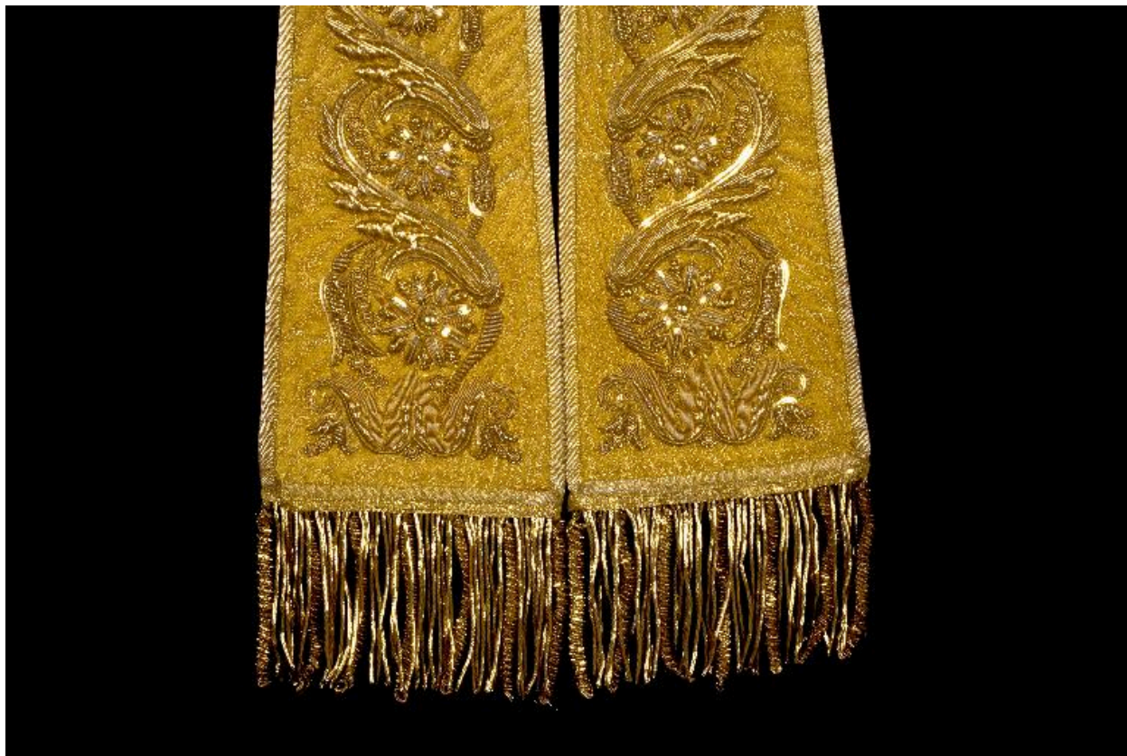
Détail de l'extrémité brodée des fanons.