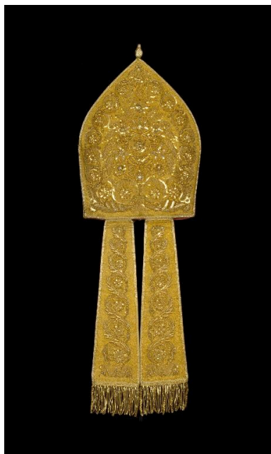
Vue du revers de la mitre.

IVR22_20020200744XA