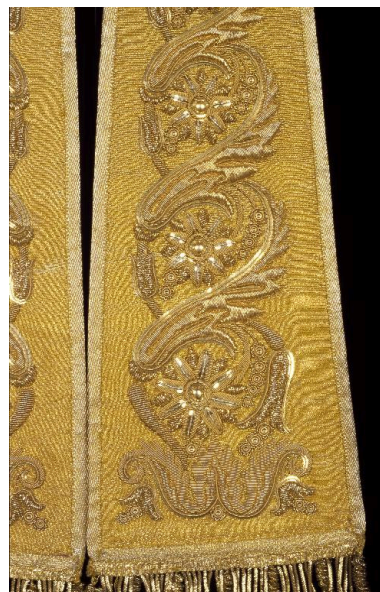
Détail du décor brodé d'un des fanons.