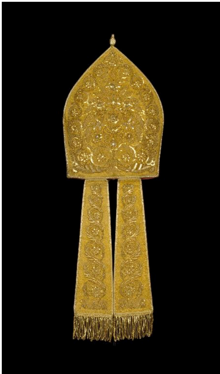
Vue du revers de la mitre.