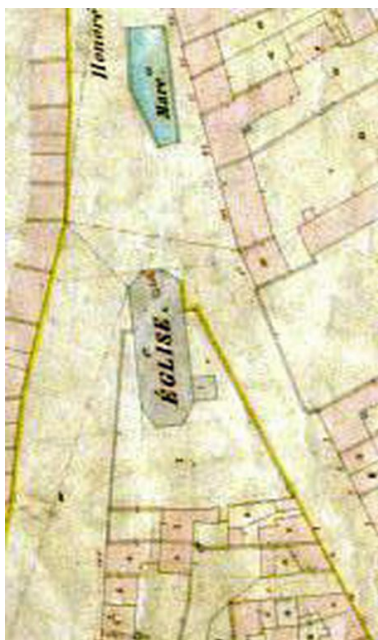
Extrait du cadastre de 1852 (DGI). IVR22_20038010975NUCA