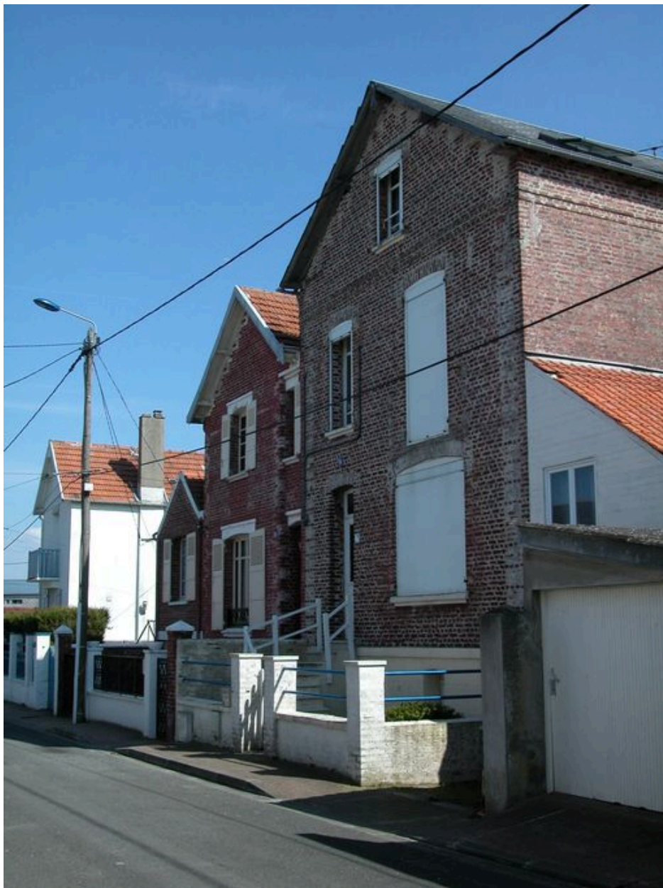
Maisons, 8 et 10 rue des Tilleuls (1985 AW 345 et 183).