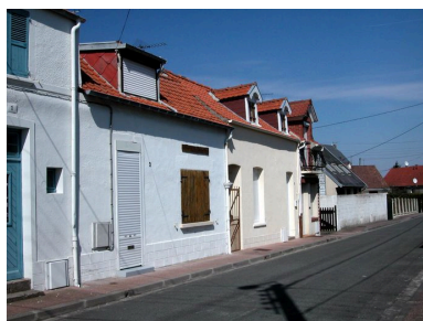
Maisons, 3 à 7 rue des Tilleuls (1985 AW 198 à 201). IVR22_20058003777NUCA