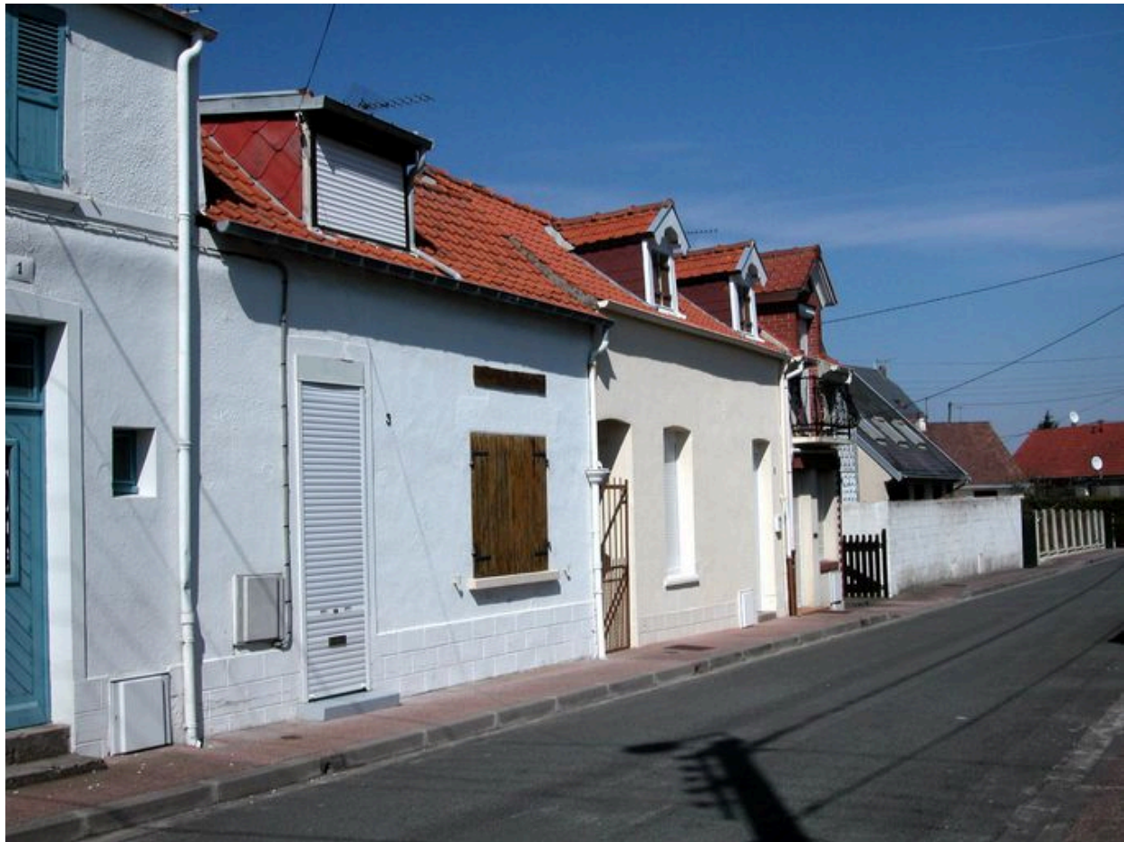
Maisons, 3 à 7 rue des Tilleuls (1985 AW 198 à 201).