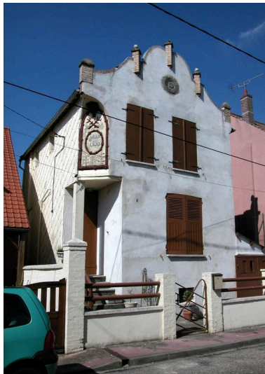
Maison dite les Lilas, 5 rue Jacques d'Harcourt (1985 AW 185). IVR22_20058003778NUCA

IVR22_20038001151XAB