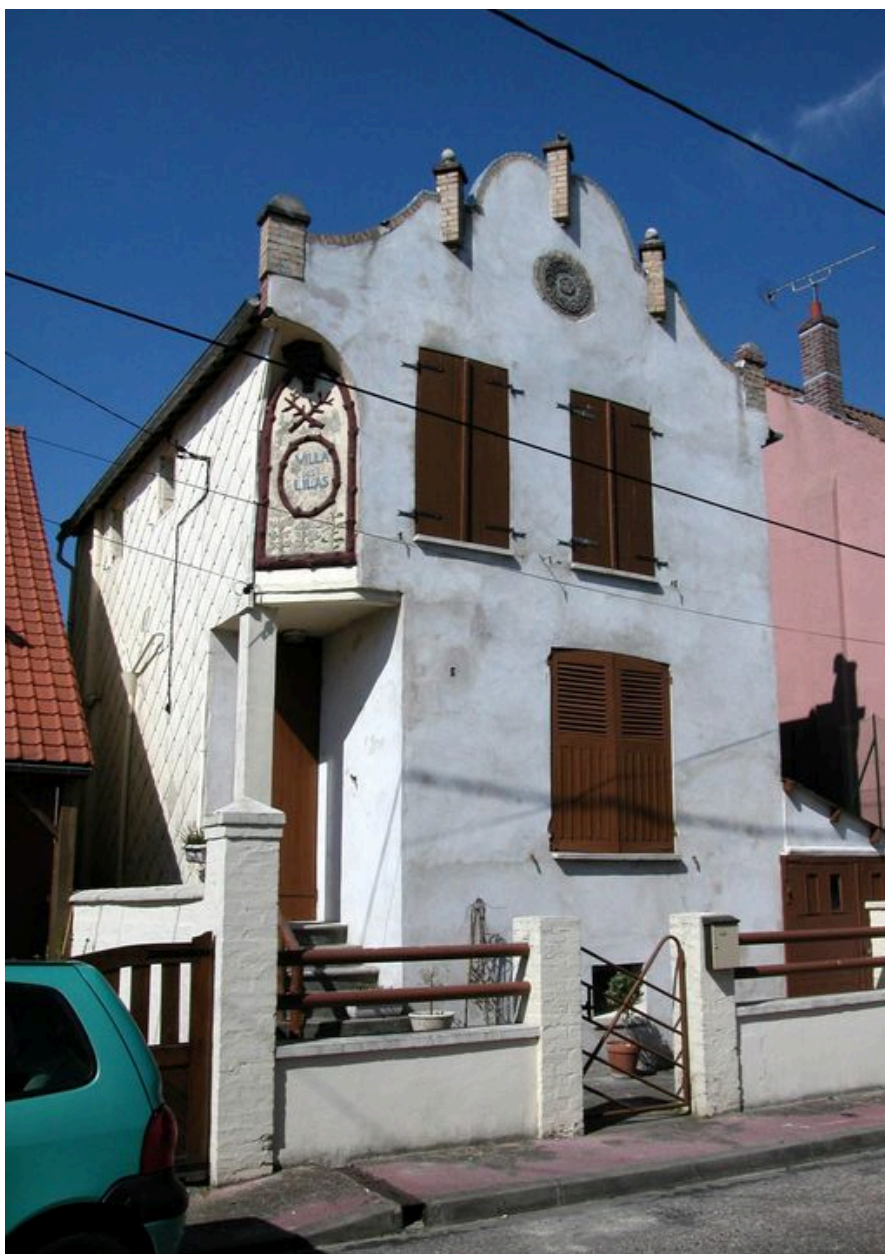
Maison dite les Lilas, 5 rue Jacques d'Harcourt (1985 AW 185).