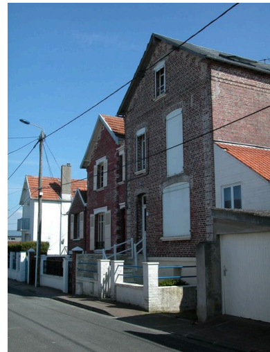
Maisons, 8 et 10 rue des Tilleuls (1985 AW 345 et 183). IVR22_20058003776NUCA