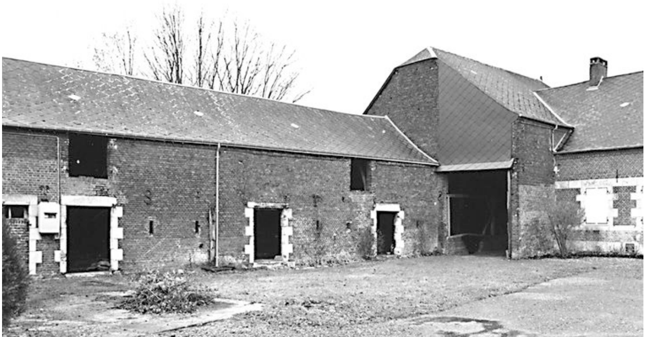
Etables à vache et chevaux, grange traversante attenante au logis.