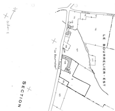
Plan de situation. Extrait du plan cadastre de 1986, section B.

Phot. Monnehay-Vulliet Marie-Laure IVR22_20080290044NUCA