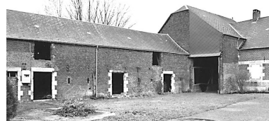
Etables à vache et chevaux, grange traversante attenante au logis. IVR22_19970202392Z