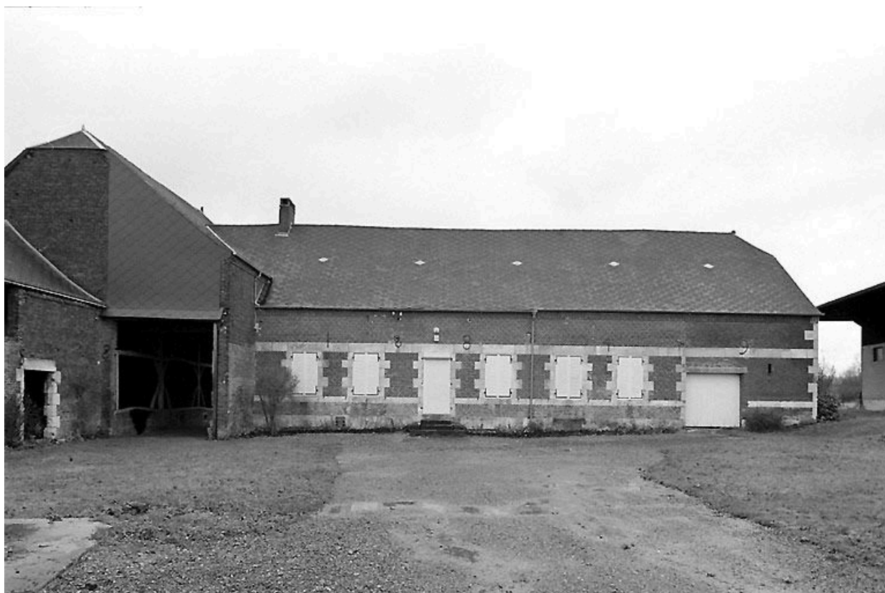
Logis et grange traversante.