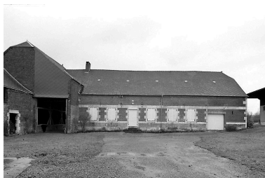
Logis et grange traversante.