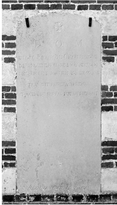
Vue générale. IVR22_19978001013X